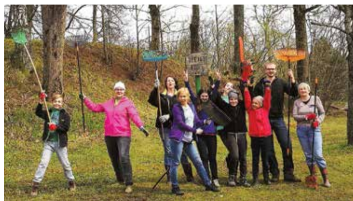
Dzejas ozolu apkārtnē Kaibalā ir sakopta!