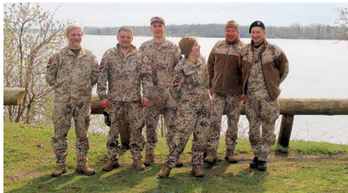
Rembates parku jau tradicionāli sakopuši Lielvārdes zemessargi.

Jaunajiem jumpraviēšiem prieks par paveikto.