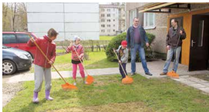
Mazie un lielie talkotāji Lāčplēša masīvā.