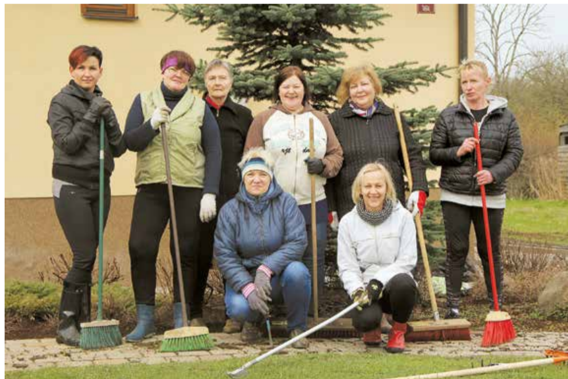
Uzņēmuma "Māris&Co" čaklās talkotājas.