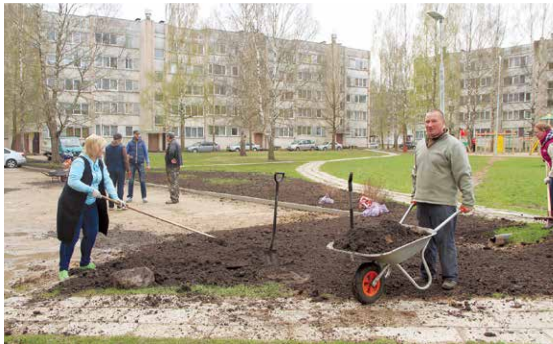
Pagalma sakopšanas darbi pie mājas Avotu ielā 5.

28. aprīļa talkas rīts Lielvārdes novadā sākās rosīgi. Talkotāji Lielvārdē strādāja Rembates parkā, Vizbuļu mežā, Avotu ielas dzīvojamā masīvā, pie kafējnīcas „Panna”, Lielvārdes parkā, Lāčplēša dzīvojamā masīvā, pie katoļu un luterāņu baznīcām, Daugavmalā, Zaļās un Stacijas ielas krustojumā un dzelzceļa malā. Kopīgs darbs noslēdzās ar draudzīgu talkas dienas atzīmēšanu.