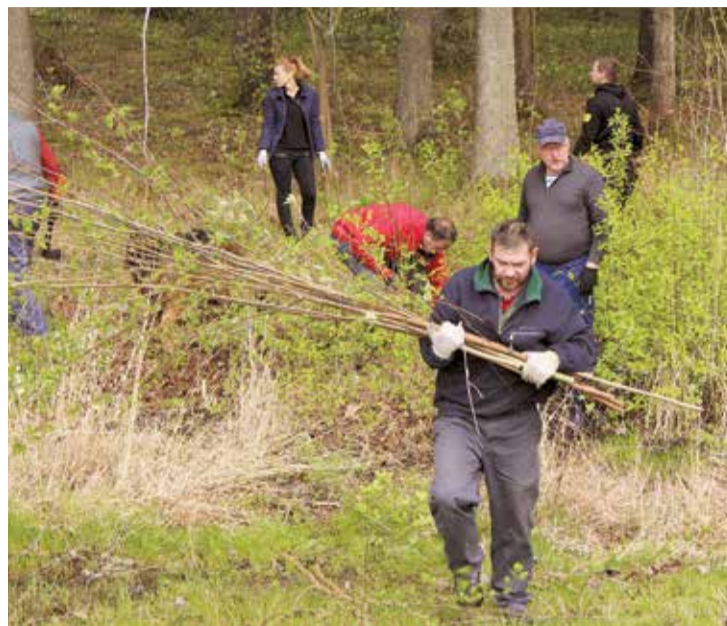
Talka Vizbuļu mežā.

Lielvārdes novada pašvaldība pateicas katram talkotājam par ieguldīto darbu novada sakopšanā! ❄