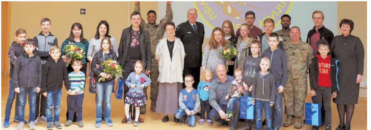
Pasākuma dalībnieku kopīgs foto atmiņai par saulaino pasākumu.

Pasākuma priekšvēsture meklējama decembrī, kad pašvaldībai, sadarbībā ar ASV militāristiem, kas Latvijā ieradusies „Atlantic Resolve” programmas ietvaros, tapa ideja par labdarības basketbola spēli pirms Ziemassvētkiem, šo ideju atbalstīja arī Latvijas Gaisa spēki un Lieltvārdes Attīstības fonds. Rezultātā par uzvaru cīnījās 4 komandas, divas no tām pārstāvēja Lieltvārdi, izšķirošā cīņa bija sīva un tikai pēdējās spēles minū-