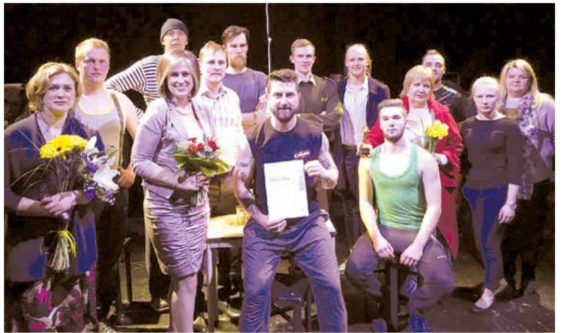
Izrādes „Palikt cilvēkam” radošā grupa.