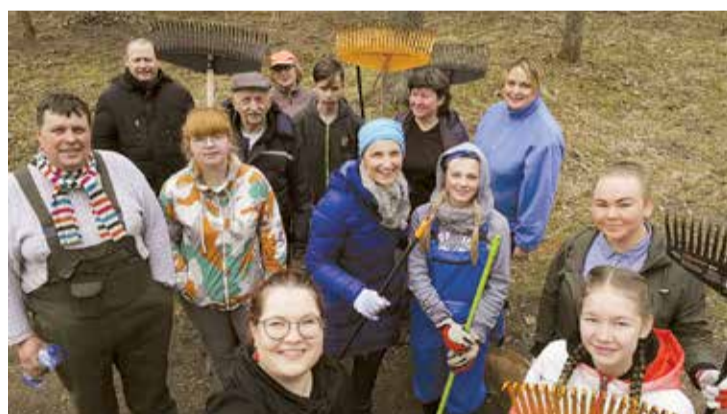
Talkotāji Jumpravas parkā gatavi darbam!