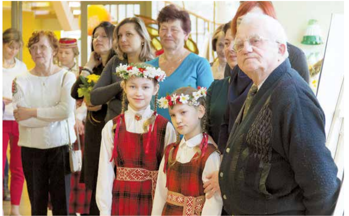
Pasākuma "Rakstu rakstus izrakstīju, rotā" atklāšana.

Pēc izstādes atklāšanas un koncerta pasākuma dalībnieki kopā