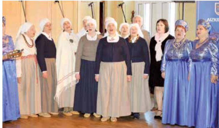
Šķan “Daugavas dziesmu festivālā” noslēguma dziesma.