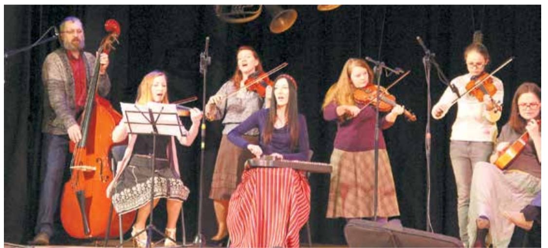
Spēlē Jumpravas kultūras nama folkloras kopa "Liepu laipa".