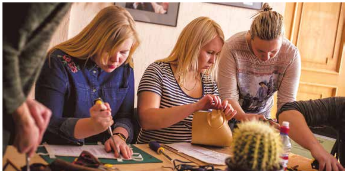
Aizraujošās pastalu darināšanas nodarbības.