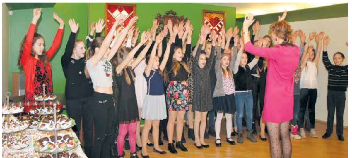
Jaukais un skanīgais kora "Lielvārde" priekšnesums – dāvana visiem klātesošajiem.