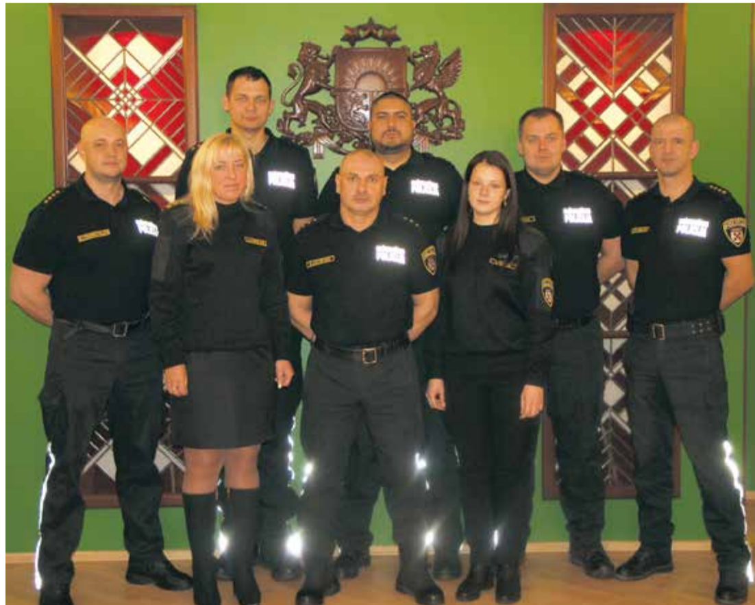
Lielvārdes novada pašvaldības policijas kolektīvs.

Saistībā ar minēto lēmumu, tika pieņemts lēmums, ar kuru tika apstiprināti seši amati Lielvārdes novada pašvaldības policijā – viens vecākais inspektors, trīs inspektori un viens jaunākais inspektors, bet likvidēts policijas priekšnieka amats. No 2014. gada 2. jūnija darbu uzsāka divi jaunākie inspektori, un policijas patruļēšanas laiks palielinājās, ietvertot arī brīvdienas un svētku dienas. Visu sešu policijas inspektoru darbs 2014. gada jūnijā tika organizēts pēc slidošā grafika principa, kā rezultātā tika ierobežotas vecākā inspektora iespējas veikt struktūrvienības vadītāja funkcijas. Lai nodrošinātu policijas struktūrvienības vadītāja funkciju veikšanu, tika izvērtēta iespēja, sākot ar jūliju organizēt policijas darbu tā, lai vecākais inspektors darbu veiktu Administrācijai noteiktajā darba laikā, nodrošinot policijas vadītāja funkciju veikšanu, un pārējie pieci inspektori darbu veiktu pēc slidošā grafika, nodrošinot policijas patruļas septiņas dienas nedēļā. Šāda darba organizācija nozīmētu policijas darbinieku intensīvu noslogotību kā iepriekš. 2014. gada 19. jūnijā, pēc policijas darbinieku iebildumu saņemšanas, tika sasaukta sapulce, kurā piedalījās visi policijas darbinieki, domes priekšsēdētājs, Sabiedriskās drošības komitejas vadītājs, izpilddirektors un izpilddirektora vietniece. Izvērtējot esošo situāciju un iespējas, tika secināts, ka kvalitatīva policijas darba nodrošināšanai nepieciešams darbinieks,