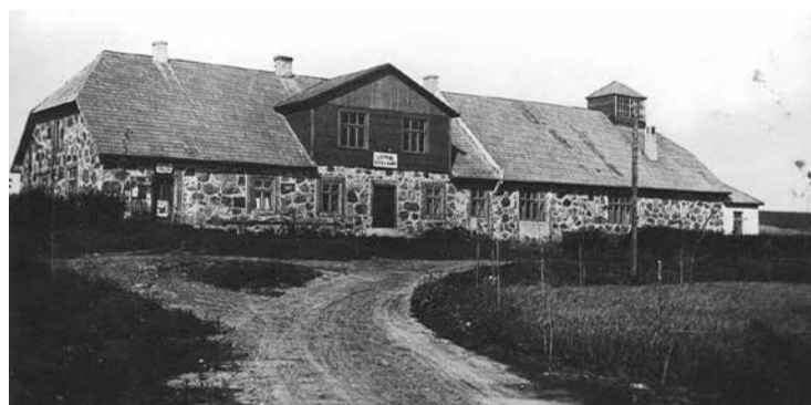
Padomju gados Tautas nams bija izvietots Lubes kroga ēkā. Attēlā: 1950. gadu Tautas nama ēka Lubes krogā.

- Ir Adventes Pārdomu laiks. Cilvēkam piemīt prāta APZIŅA, bet sirdij – sirds APZIŅA. Prāta APZIŅA "deķīti" velk uz savu jeb ego pusi. Turpretī sirds APZIŅA uz Dieva jeb kopuma (visuma) pusi. Tāpēc visiem novada ļaudīm novēlu Jaunajā gadā iemantot sirds mieru, bet to var panākt tikai tad, ja klausās sirds APZIŅAI.