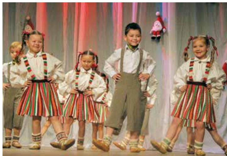
Mazie „Pūpoliša” dejotāji izpelnījās skaļākos skatītāju aplausus.