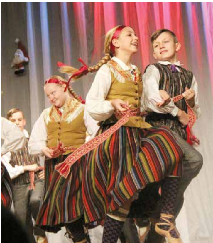
Dejo ciemiņi – bērnu deju kolektīvs „Oļi” no Olaines.