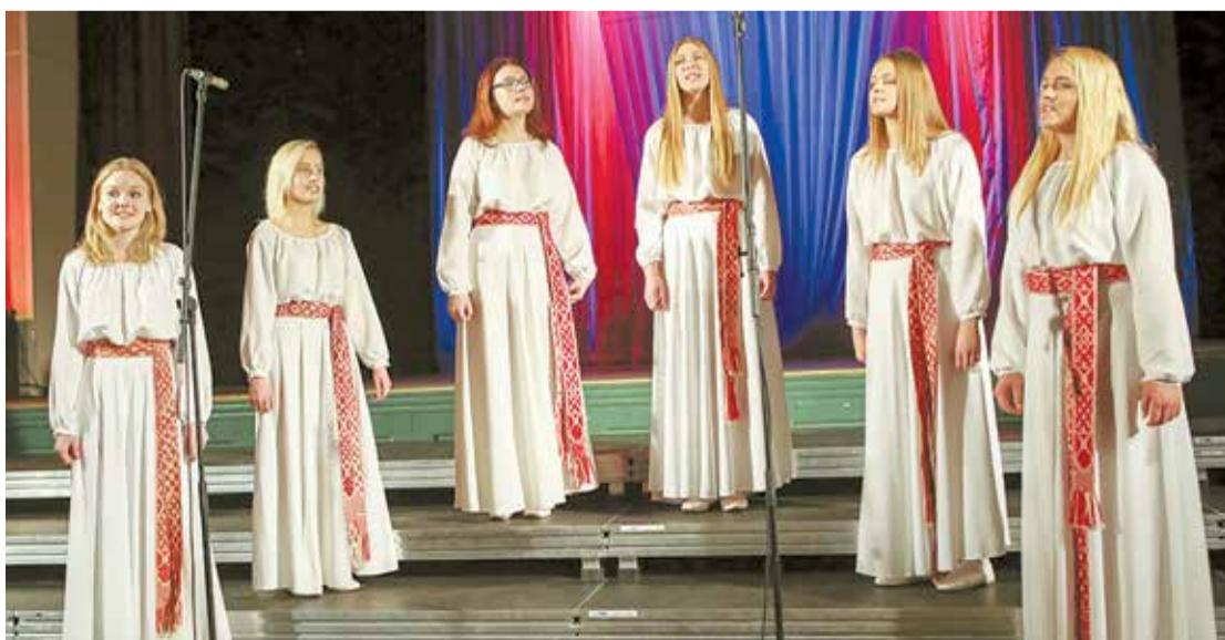
Uzstājas vokālās studijas "Mikauši" meitenes.