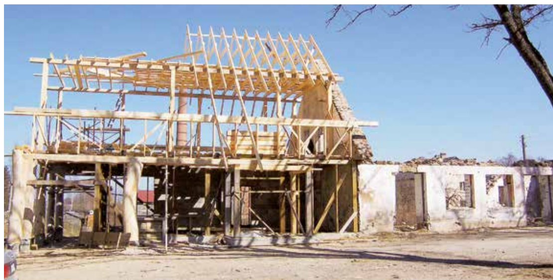
Bijušās pienotavas vietā top pirmās jaunā Ģimenes un izglītības centra "Aivas" ēkas konstrukcijas.