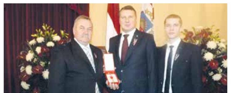
Ivars Blumfelds no Valsts prezidenta Raimonda Vējoņa saņem Atzinības krustu.