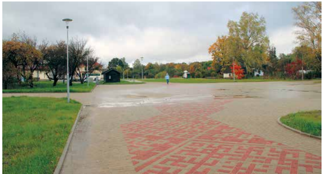
Brūģētais laukuma segums ar Lielvārdes jostas rakstu zīmēm.

Sākotnēji Lāčplēša laukumā kā galvenie vienojošie objekti tika plā-