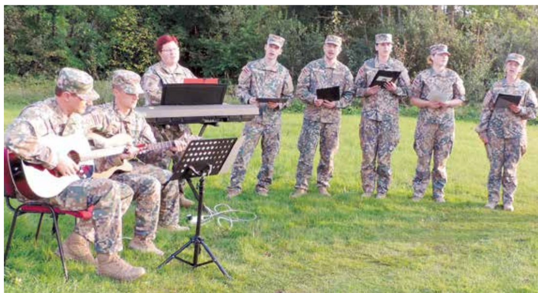
Lēdmanē Baltu vienības dienu atzīmēja kopā ar Lielvārdes garnizona ansambli.

Muzeja pagalmā gaiši dega uguns, krāsaini gaismekļi un lāpas, visus vienoja folkloras kopas „Jostas” uzsāktās dziesmas un LU folkloras deju kopas “Dandari”