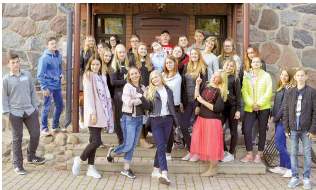
Lielvārdes novada un Gulbenes jaunieši.