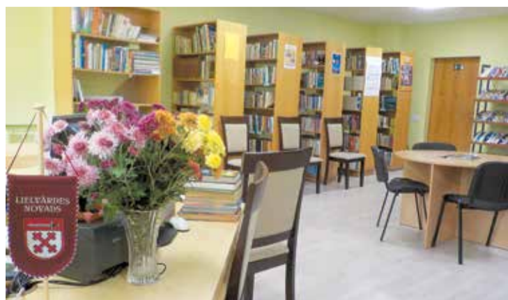
Jumpravas pagasta bibliotēkā, tāpat kā pārējās trijās novada grāmatu krātuvēs, ļoti rūpīgi seko līdz aktualitātēm Latvijas grāmatniecībā. Un tas prasa nemitīgu darbu un izglītošanos: lai zinātu un saprastu, kas vajadzīgs lasītārajiem novadniekiem.

Raiņa iela 50 - 9, Lielvārde, Lielvārdes novads, LV – 5070. Tālrunis saziņai – 65053644, 28858911.