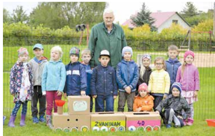
"Zvaniņa" vilciens gatavs ceļam.