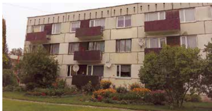
3. vieta nominācijā "Sakoptākā daudzdzīvokļu māja" - daudzdzīvokļu dzīvojamajai mājai Ozolu ielā 3, Jumpravā.