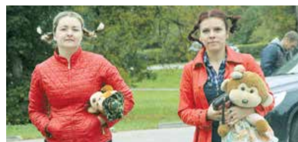
Komandas "Pepija" dalībnieces dodas uz starta vietu.

2. vieta – Ābolu pīrāgs; 3. vieta – Neķer kreņķi. Uz tikšanos nākamajās sacensībās! ✕