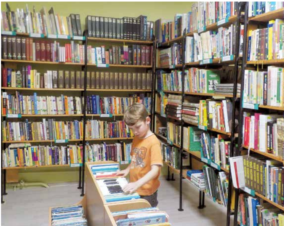
Bibliotēkas vienmēr bijušas un būs teju vai visa pagasta vai novada intelektuālās dzīves centrs. Gan tāpēc, ka šeit vienmēr iespējams sastapt zinātkārākos ļaudis, gan tāpēc, ka tieši bibliotēkās vienmēr iespējams uzzināt pēdējos jaunumus – presē, grāmatās, internetā. Un bibliotekāres īpaši priecājas sastapt pie sevis novada jaunāko paaudzi.

ņā. Par izglītojošiem pasākumiem domā arī citviet – Lāčplēša bibliotēkā, Lielvārdes pilsētas bibliotēkā.