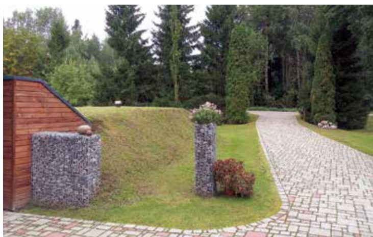
Mājai "Vizbulītes" Jumpravas pagastā - 3. vieta nominācijā "Sakoptākā dzīvojamā māja". Gabioni un ziedu kompozīcijas "Vizbulītēs".