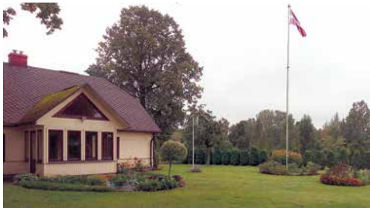
Lauku viensētai "Duķi" Jumpravas pagastā - 2. vieta nominācijā "Sakoptākā lauku viensēta".