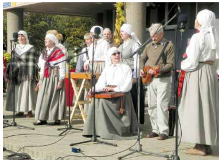
Folkloras kopa „Josta” Tukuma Miķeļdienas tirdziņā.