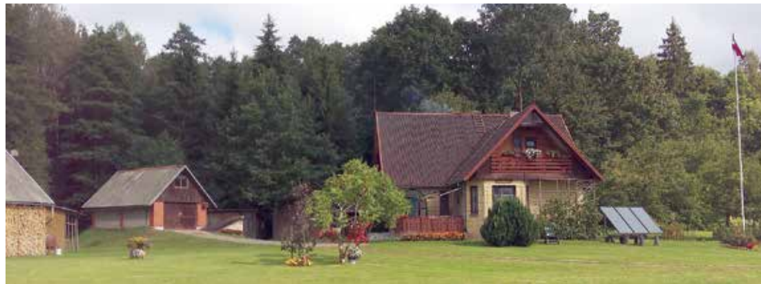
Lauku viensētai "Dzimtenes" Jumpravas pagastā - 3. vieta nominācijā "Sakoptākā lauku viensēta".