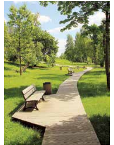
Atpūtas vieta „Dzelmes”.

Neskatoties uz lietaino vasaru, arī tūrisma sezona Uldevena pilī bija visnotaļ veiksmīga. Varbūt nedaudz mazāk skolēnu bija pava-