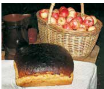
Muzeja pagalmā visus gaidīja cienasts.

Pirmo reizi baltu vienības ugunu sasauksme bija sarīkota starp Lietuvas un Latvijas pilskalniem. Vienības uguns izplatījās pāri robe-