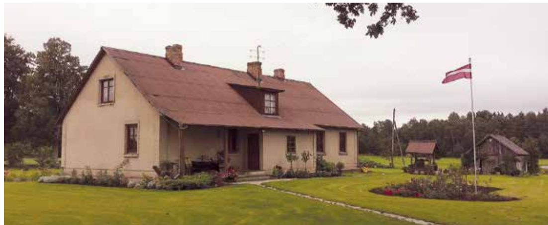
“Auziņas” Lielvārdes novadā – “Sakoptākā lauku viensēta”.

Lai noteiktu, kura sēta ir skaistākā un sakoptākā, vērtēšanas komisija vērtēja pēc vairākiem kritērijiem – teritorijas kopskats (īpašuma nosaukuma noformējums, pasta