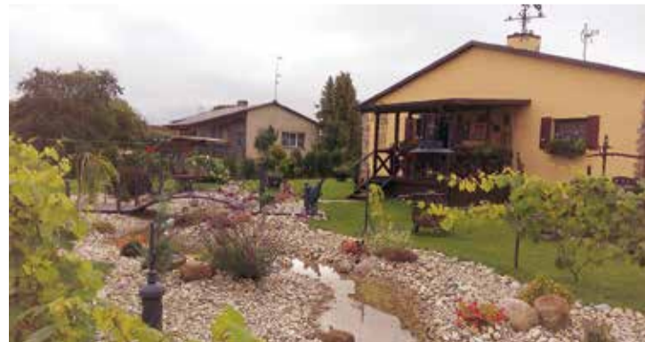
“Sakoptākās dzīvojamās mājas” dārzs Vidus ielā 11, Jumpravā.