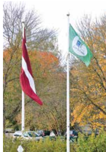
Lai bērnudārzā Zaļais karogs lepnī plīvo līdzās mūsu valsts karogam!

Aktīvi darbojoties EKO skolu programmā, piedaloties "Zaļās jostas" konkursos un daudzos citos pasākumos, kas saistīti ar dabu un tās saudzēšanu, bērnudārza "Zvaniņš" bērni ieguva dāvanu – braucienu ekskursijā uz Līgatnes dabas takām.