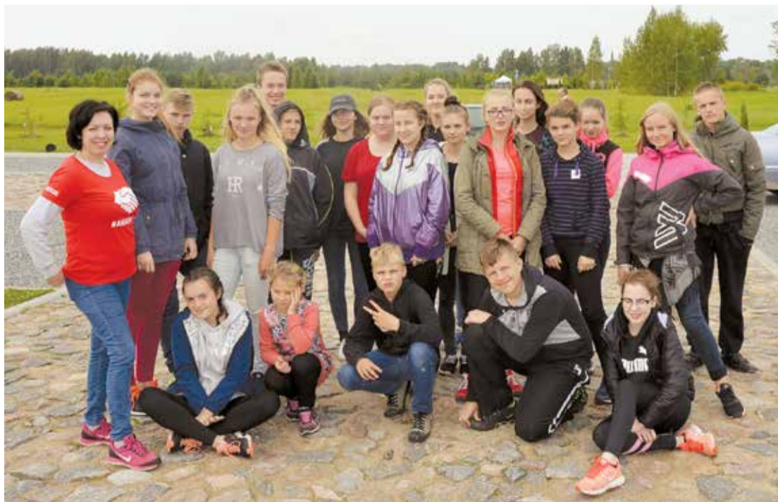
Talkas dalībnieki no Lielvārdes.

Šī talka bija īpaša, jo notika reizē ar Kokneses fonda organizēto Ābolu balli. Tūlīt pēc svinīgās Ābolu balles atklāšanas talkas dalībnieki tika sadalīti vairākās darba grupās