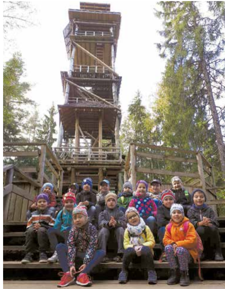
Ekskursijā Līgatnē pie skatu torņa.

Diena izvērtās kā liels piedziņojums, braucot lielajā autobusā un izstaigājot garās Līgatnes dabas takas, vērojot un iepazīstot Latvijas meža dzīvniekus dabā. Liels notikums bija redzēt meža cūkas un 4 mazos strīpains sivēnus, lāci, kurš cītīgi raka smiltīs sev alu, vāveru puiku, kurš draiskojās savā namiņā un alni, kurš gozējās atvasaras saulītē. Bērni ar interesi aplūkoja un izzināja pie katra dzīvnieka mitnes novietoto informāciju par dzīvnieku dzīvesveidu. Ļoti interesanta informācija bija par lapsu dzīvi. Drosmīgākie bērni, viņu sko-