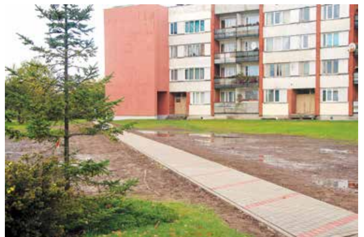
Jaunā ietve ļauj ērti pārvietoties no Mēness ielas līdz Raiņa ielai.

Projekta mērķis bija nodrošināt iedzīvotāju drošu un ērtu pārvietošanos no Mēness ielas līdz Raiņa ielai. Minētājā objektā darbus veica SIA „Uzars bruģēšana”. Kopējā līguma summa 8334,66 EUR. ✕