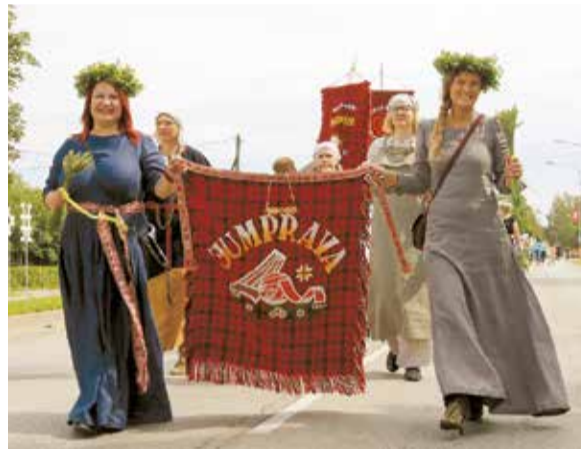
Ar lepnumu tiek nests Jumpravas kultūras nama karogs.