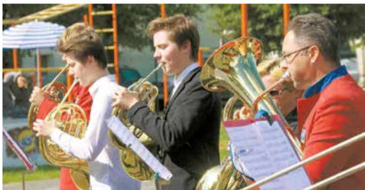
Svētku stafeti pārņem Lēdmanē. Sportošanu atklāj Ogres Kultūras centra pūtēju orķestris "Horizonts".