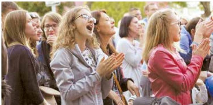
Novada svētki sākās Jumpravā. Vakara koncertā kopā ar grupu "Tumsa".