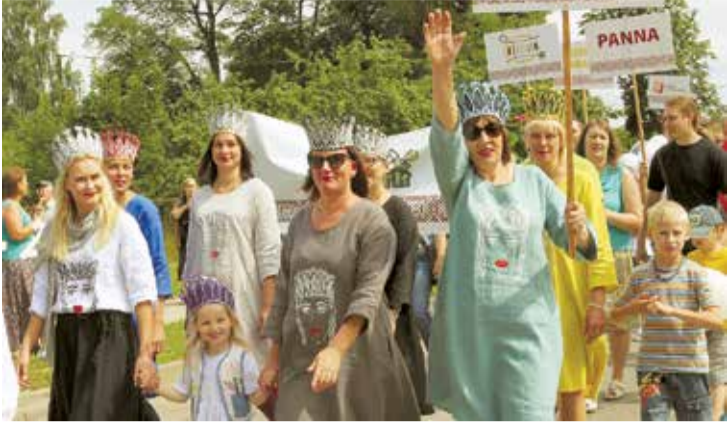
Sevi un pārdomātos tēpus rāda „Linu mājas” meitenes.