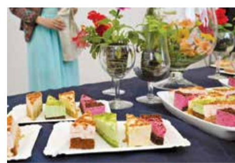
Bezglutēna produkcijas ražotne / Monika Ziemele (SIA "DIAMONDS FOOD GROUP").

11.oktobra plkst. 17.00. Papildus informācija Lauku atbalsta dienesta tīmekļvietnē www.lad.gov.lv .