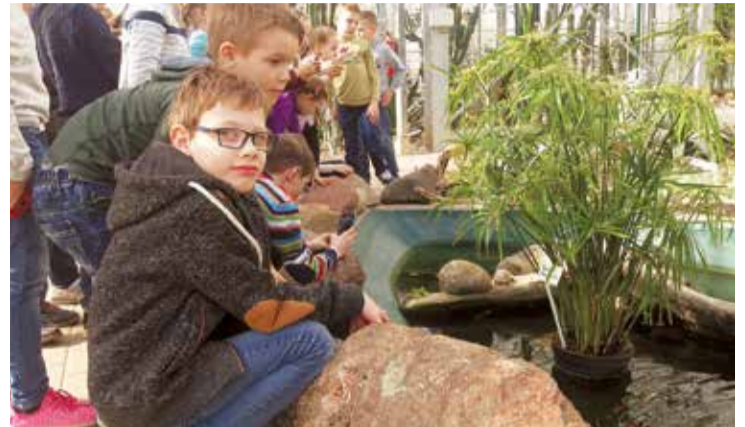
Lielvārdes pamatskolas 2. a un 2. b klases skolēni Nacionālajā Botāniskajā dārzā Salaspilī.