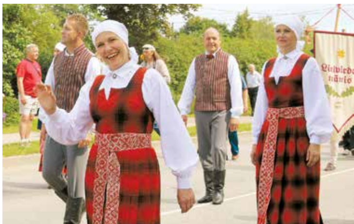
Vidējās paaudzes deju kolektīvs „Lāčplēsis”.