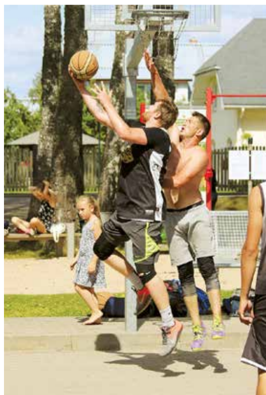
Svētdiena Lielvārdē veltīta sportam. Strītbols.