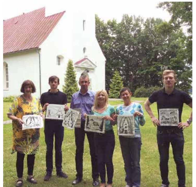
Nodarbības "Arhitektūras mantojums Lielvārdē" dalībnieki.

Projekts "Pasākumu cikls "Arhitektūras mantojums Lielvārdē"" Nr.LNP/12-10.3/17/1136-G tiek īstenots ar Lielvārdes novada pašvaldības līdzfinansējumu, kas piešķirts pašvaldības 2017. gada kultūras projektu konkursā. ❖