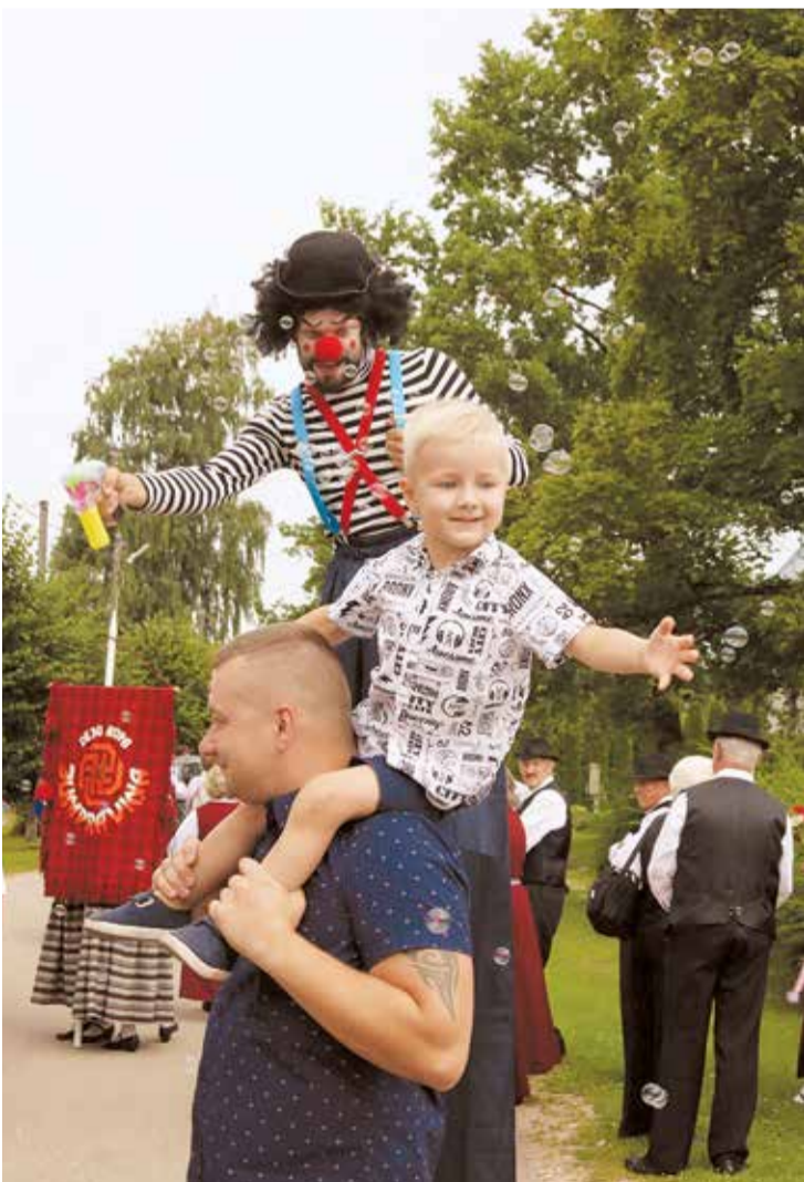
Garkājainie klauni un ziepju burbuļi lielo un mazo priekam.