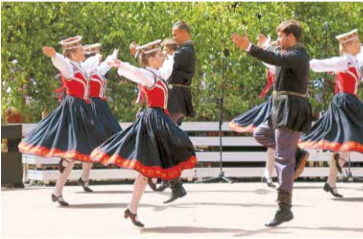
Pūpolītis – deļotprieks.