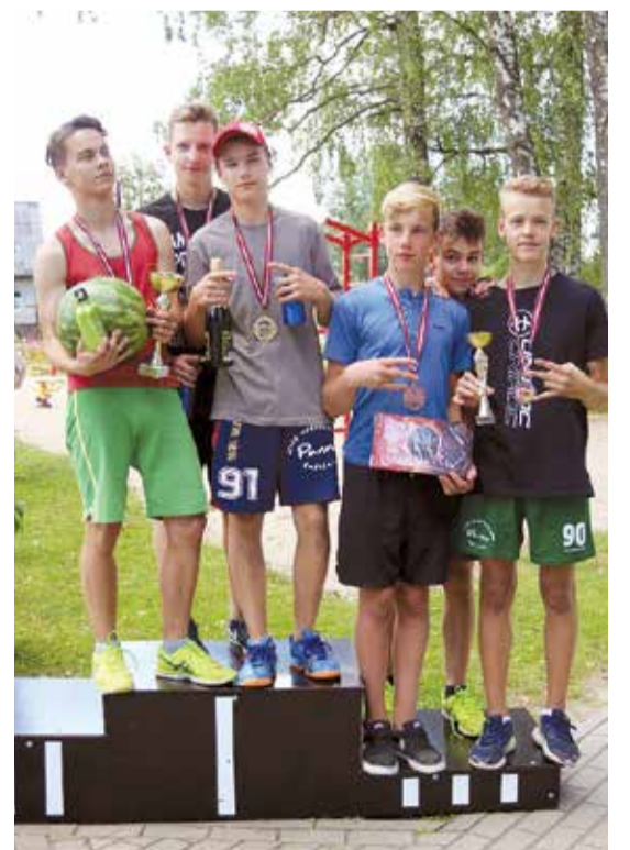
Lielvārdes sporta dienas medaļnieki.