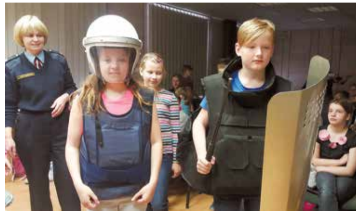
Lielvārdes pamatskolas 4. klases skolēni Ogres policijas nodaļā.

Bērni darbojās radošajā darbnīcā, uzdeva jautājumus. Nodarbošanās rosināja skolēnus nopietni padomāt par savu nākotni un karjeru.