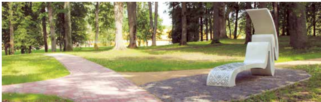
Parkā izbūvēti vairāku veidu celiņu segumi.