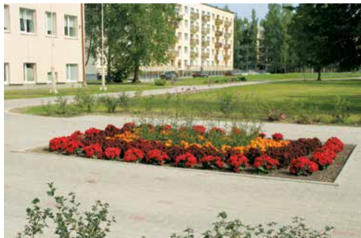
Pretī skolas fasādei izveidoti gaumīgi apstādījumi.