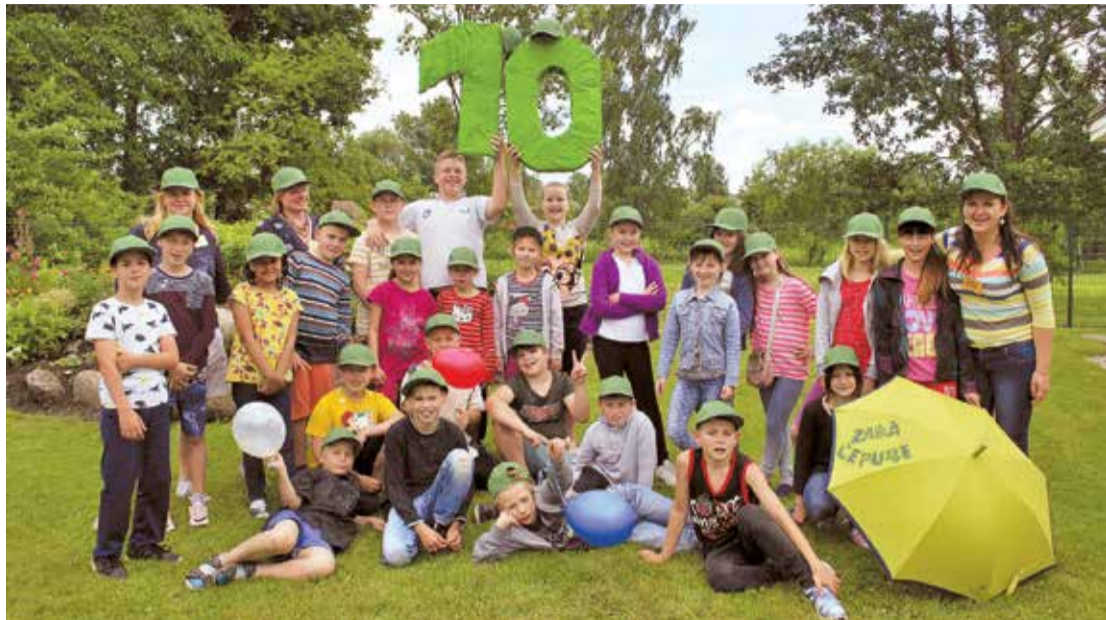
Nometnes "Zaļā cepure" 10 gadu jubilejā.

Šogad Lielvārdē pirms Lielvārdes novada svētkiem nosvinēti vēl kādi svētki. Pašvaldības finansētajai bērnu vasaras nometnei "Zaļā cepure" šogad apritēja apaļi 10 gadi. "Zaļās cepures" dzimšanas diena nosvinēta godam – ar dāvanām un dzimšanas dienas torti.