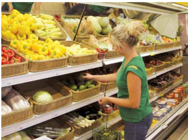
Arta veikala „Elvi” tirdzniecības zālē.

Par paveikto darbu jaunieši saņēma atalgojumu, kas ir ne mazāks par valstī noteikto minimālo algu par pilnu nostrādātu darba laiku. NVA darba devējam nodrošina dotāciju skolēna mēneša darba algai 50% apmērā no valstī noteiktās minimālās mēneša darba algas, savukārt otru algas pusi jaunietim maksā Lielvārdes novada pašvaldība. Darba devējs jauniešiem nodrošina arī nelaimes gadījumu apdrošināšanu un apmaksā obligātās veselības pārbaudes. Par nodarbināto skolēnu uzņēmēji veic darba devēja un darba ņēmēja nodokļu