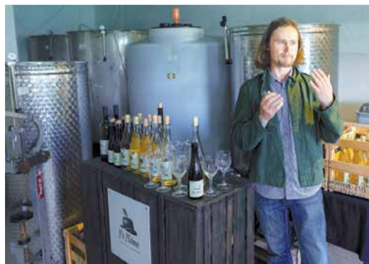
Ražošanas iekārtu iegāde ar mērķi palielināt ražošanas apjomus un ieviest jaunus produktus / SIA "Jumpravas sidrs".

Projektu iesniegumus var iesniegt līdz 2017. gada 11. oktobrim elektroniski, izmantojot Lauku atbalsta dienesta Elektroniskās pieteikšanās sistēmu vai saskaņā ar Elektronisko dokumentu likumu sūtot elektroniski parakstītu dokumentu uz Lauku atbalsta dienesta elektroniskā pasta adresi: lad@lad.gov.lv. Projektu iesniegumus papīra dokumenta formā iesniedz PPP biedrība "Zied zeme", Raiņa ielā 11a, Lielvārdē līdz 2017. gada