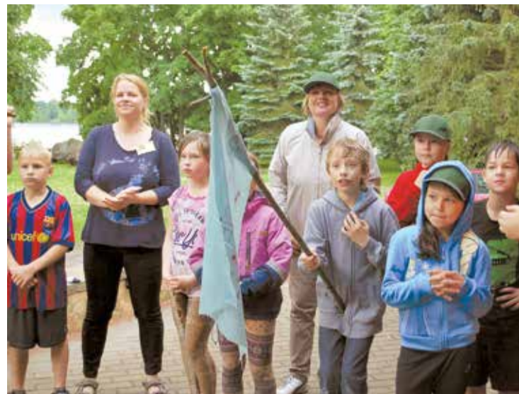
Sporta dienā Lielvārdes parkā.

Paldies Izglītības nodaļas speciālistiem Zītai un Reinim par teicami noorganizēto foto orientēšanos!