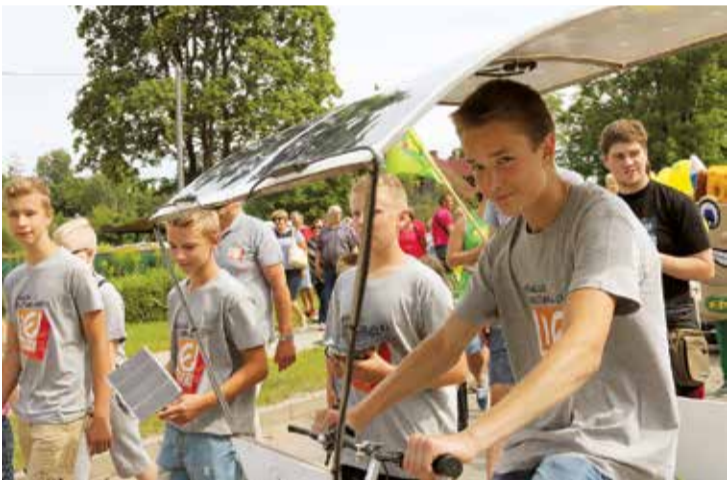
Interesū izglītības centrs Lielvārdi gājiēnā demonstrē velosipēdu ar gaismas baterijām.