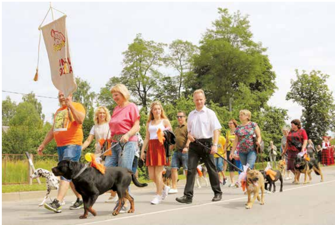
Suņu skolas audzēkņi gājienā demonstrē lielisku disciplīnu.