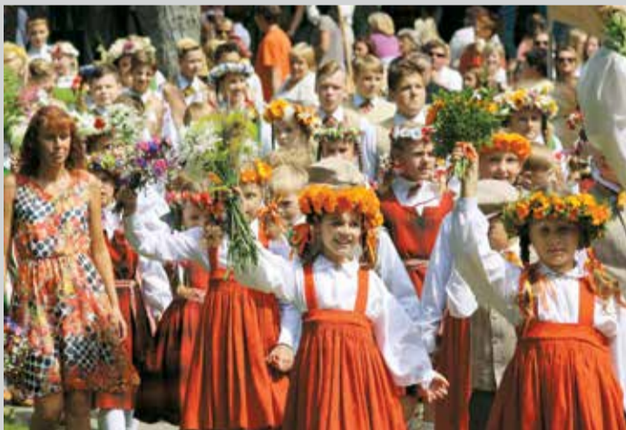
Pulcēšanās svētku koncertam Rembates parkā.