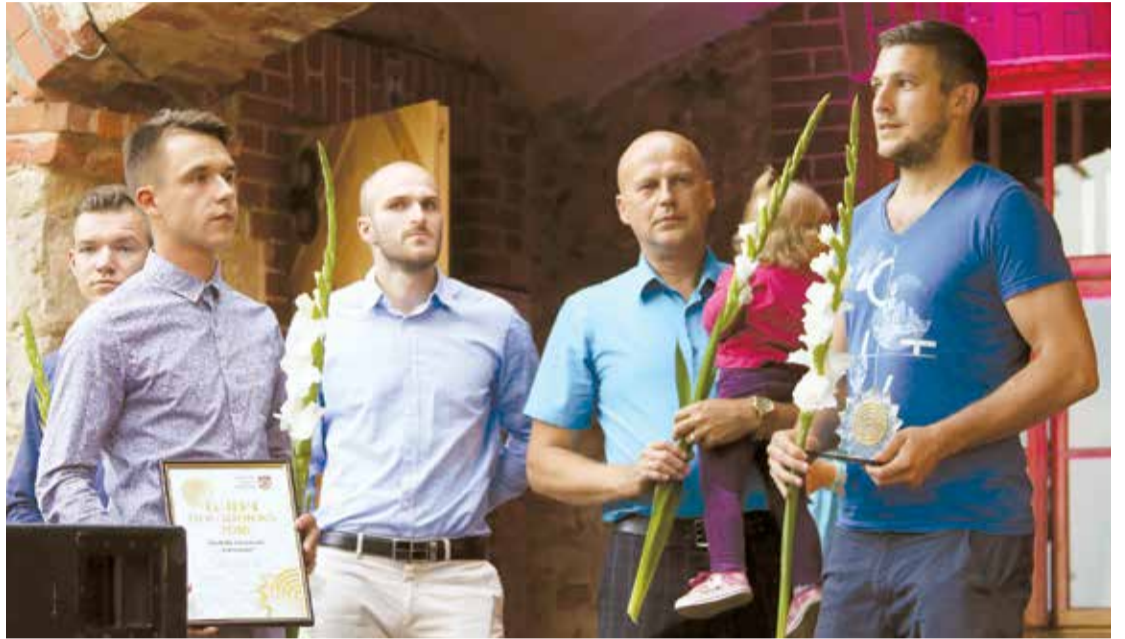
Latvijas florbola virslīgas čempioni, saņemot "Gada novadnieka" balvu novada svētkos.

A.K.: Florbols pēdējos gados ir ļoti strauji attīstījies, spēle ir ātra, dinamiska un fiziska, līdz ar to aug popularitāte. Divu pēdējo sezonu fināl-