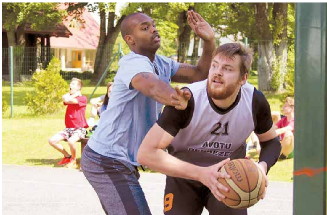
Cīņa par bumbu Lēdmanes sporta laukumā.