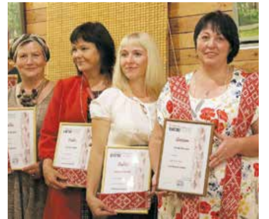
Izstādes „Laimas zemē dzīvojojot” dalībnieces Lielvārdes A. Pumpura Lielvārdes muzejā.