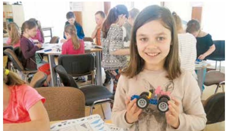
Nodarbošanās Izzaņas un eksperimentu centrā „Lielvārdi”.