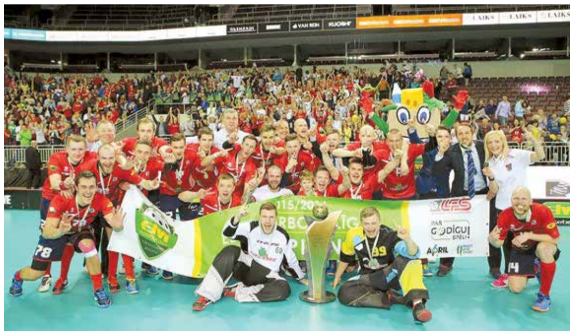
Titula "Gada novadnieks 2016" ieguvēji – Latvijas florbola virslīgas čempioni, sporta klubs "Liēlvārde".

A.S.: Galvenais, neesiet vienaldzīgi ne pret saviem ģimenes locekļiem, ne pret kaimiņiem, ne pret novadu kopumā. Esiet aktīvi, iesaistieties dažādās sabiedriskās aktivitātēs, paudiet viedokli, pat ja tajā ir kritikas piesitiens.