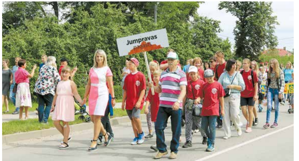
Svētku gājiēnā – Jumpravas pagasta pārvalde.