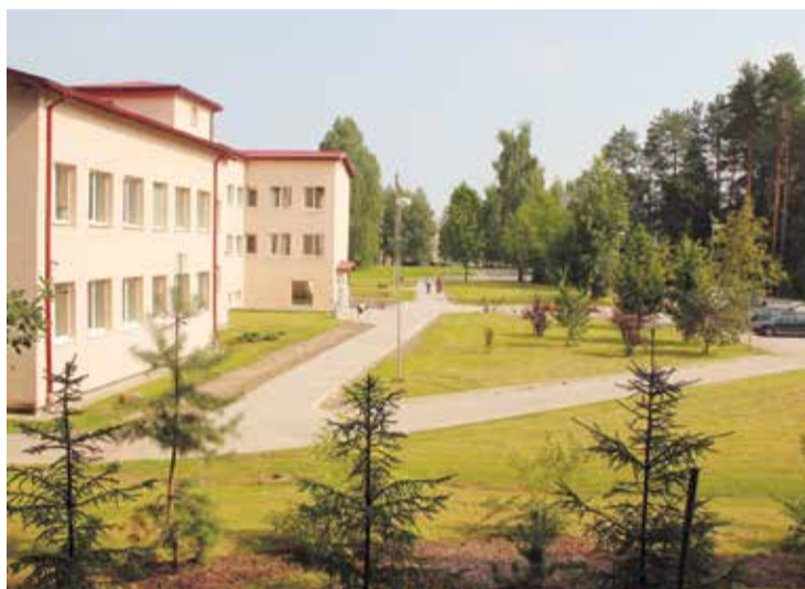
Jaunie bruģētie celiņi gar skolas fasādi.