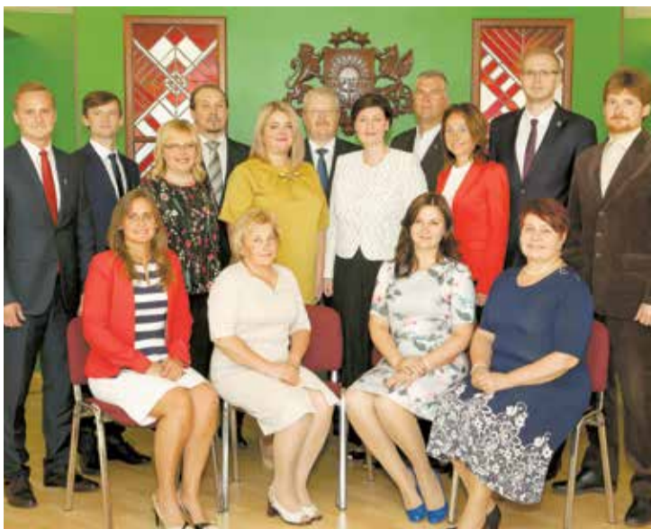
Lielvārdes novada domes jaunais sasaukums.