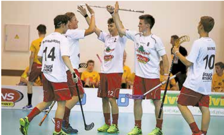
Prieks par gūtajiem vārtiem.