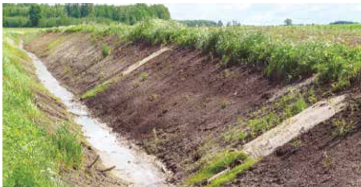
Projekta ietvaros iztīrītās ūdensnotekas garums ir 3,1 km.

2017. gada 30. jūnijā Lielvārdes novada pašvaldība pieņēmusi ekspluatācijā koplietošanas ūdensnoteku (ŪSIK kods 415192:02) – meliorācijas sistēmu. Ūdensnoteka savāc ūdeni no 470 ha liela sateces baseina, ekspluatācijas laikā tā bija nolietojusies un neatbilda normatīvo aktu prasībām.