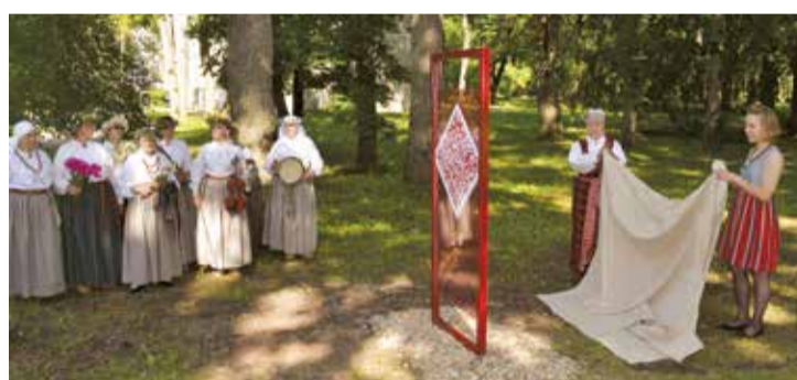
Viedzīme ir atklāta!

Lielvārdes pilsētā ir uzstādītas divas viedzīmes – Lielvārdes Rēmbates parkā. Tagad jebkurš, nolasot viedzīmes kvadrāt-