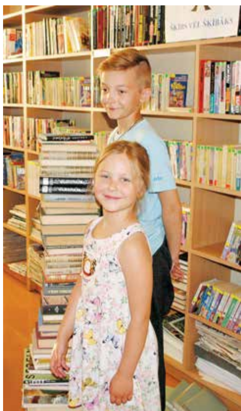
Augstais grāmatu tornis uzbūvēts!