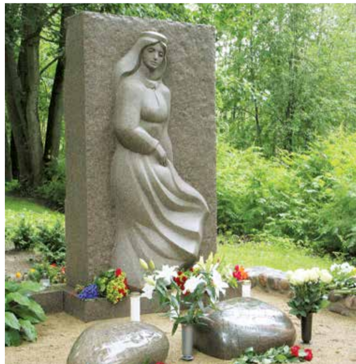
Jaunais pieminēklis – Tautumeitas veidols – Uldim Žagatam Lāčplēša kapos Lielvārdē.