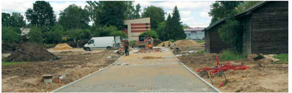
Betona bruģa seguma izbūve Lāčplēša laukumā.

Projekta 1. kārtas būvdarbus plānots pabeigt 2017. gada 31. augustā. ✘