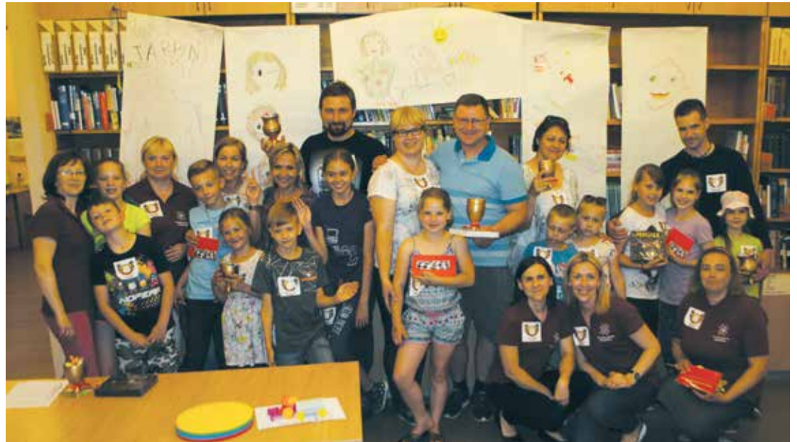
"Starpplauktiskā rallija ģimenēm" dalībnieku kopīgais foto.

Sirsniņi pateicamies mūsu sponsoriem: kafejnīcai "Gamma", kafejnīcai "Kante", picērijai "Bacca",