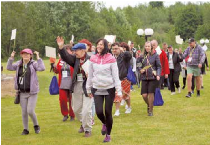
Dalībnieku ierašanās “Debesu blodā”.

Otrā diena bija veltīta radošajām aktivitātēm. Visi IE[SPĒJAS] dalībnieki varēja darboties trīs dažādās meistarklasēs. Kustību un teāt-