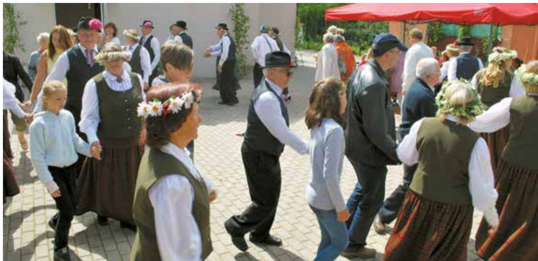
Kopīgā Jāņu rotaļā Dienas centra pagalmā.