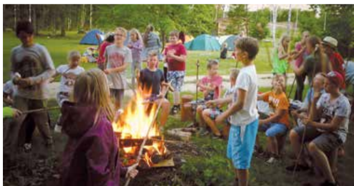
Kopīgs ugunskurs – neatņemama nometnes sastāvdaļa.