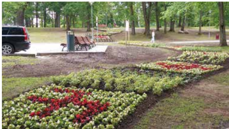
Dobe ar rakstu zīmēm Rēmbates parkā.