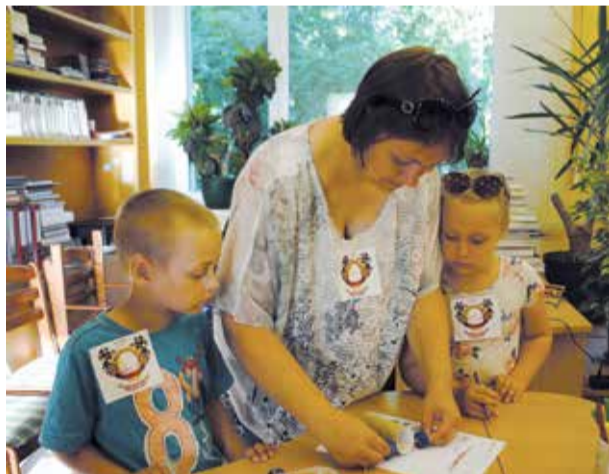
Rallija mašīnu būvēšana sacensībām.