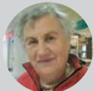
Ausma, pensionāre, mazliet strādā, palīdz bērniem

Protams. Apmeklēšu pasākumus visu trīs dienu garumā. Gan koncertu, gan visu pārējo – cik varēšu paspēt. Galvenais, lai laiks būtu labs. Tad noteikti būs svētku sajūta. Visus gadus ir patikuši svētku pasākumi, vēlētos arī šogad redzēt ko līdzīgu iepriekšējiem gadiem. Un varbūt kaut ko vairāk. Varētu būt pasākumi ar dejošanu, lai var izdejoties. Novads ar katru gadu kļūst sakoptāks, redzu, ka viss notiek. Novēlu, lai lielvārdiešiem veicas!