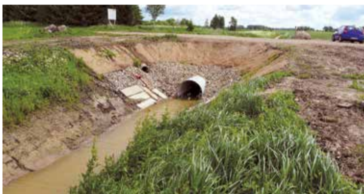
Caurteka zem pašvaldības autoceļa „Upmaļi – Rantes – Rēdnieki”.