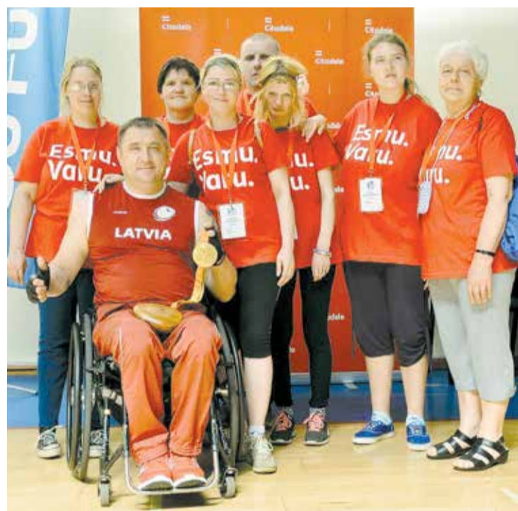
Atbalsta grupas “Dzīvesprasmis” un “Dzīvespēks” dalībnieki – paraolimpieši.