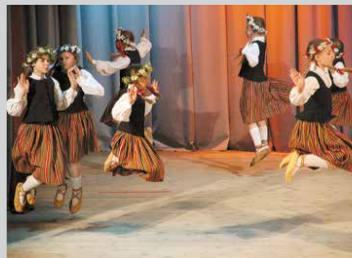
“Ritupītes” dejas lidojums Māmiņdienas koncertā.