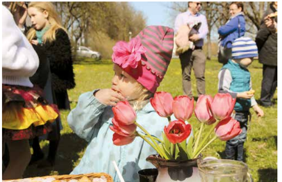
Baltā galdauta svētkos Lielvārdē.

Beata Kempele, Lielvārdes novada pašvaldības informācijas līdzekļu redaktore