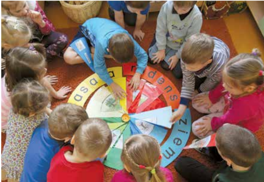
Svarīgs pirmsskolnieku uzdevums – apgūt gadalaikus.