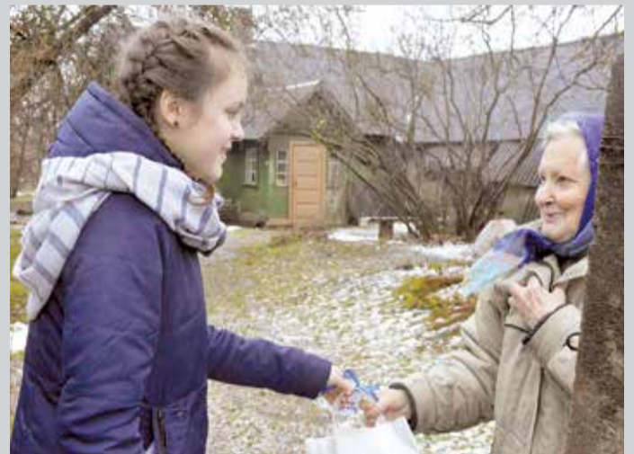
Sirsnīga dāvana svētkos.