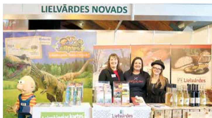
Lielvārdes novada stends izstādē „Balttour 2017” saistīja ar topošā izklaides un atpūtas parka „Avārijās brigāde” un novada gardumu piedāvājumu.

Kartēs ir pieejama informācija arī par ēdināšanas pakalpojumiem un naktsmītnēm Lielvārdes novadā, kā arī pievienota cita noderīga informācija. Jaunums Lielvārdes novada tūrisma kartē ir īpaši izveidotā sadaļa tūrisma maršrutiem, tajā iekļauti divi – „Lielvārdes novada amatnieki un saimniecības”