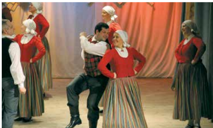
Uz skatuves – vidējās paaudzes deju kolektīvs „Saime”.