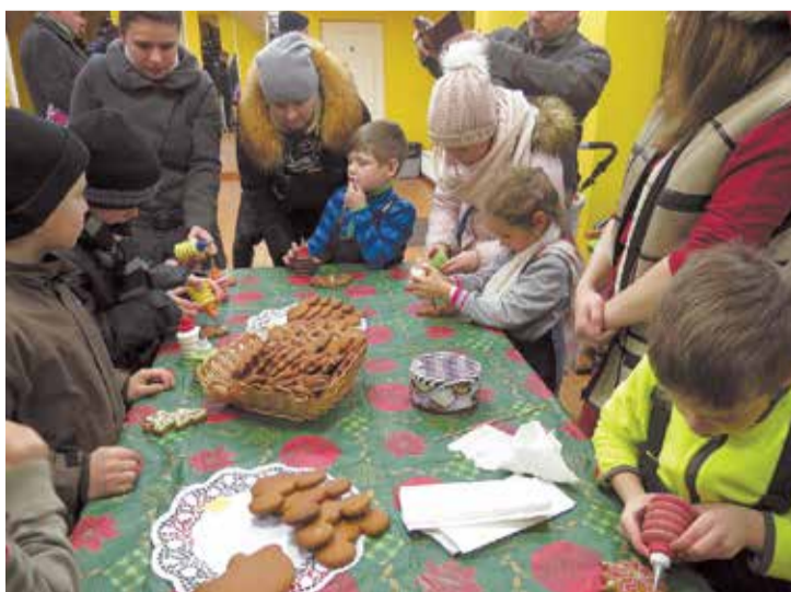
Piparkūku darbnīca atklāta!