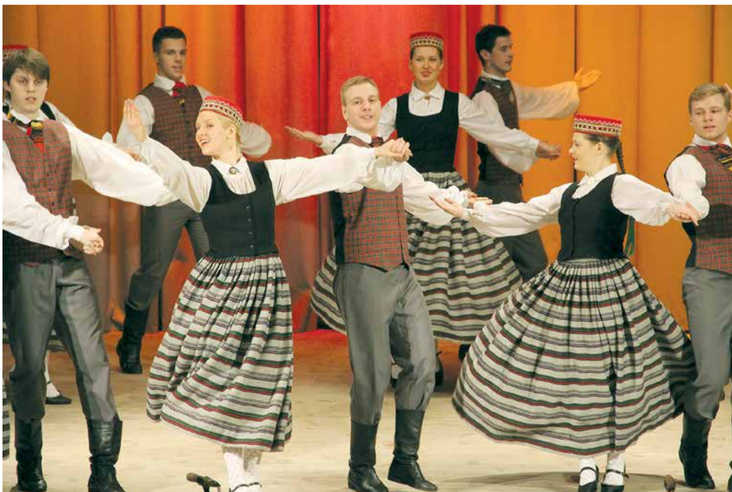
Kā jauka tradīcija ir Jumpravas kultūras nama amatierkolektīvu gada koncerts, kas noris janvāra pēdējā sestdienā. Krāšņums, pilns ar siltumu un mīlestību, kas tika iedejots katrā dejā un izdziedāts katrā dziesmā, skatītājos radīja pozitīvas un mīļas sajūtas, kā arī atziņīgu novērtējumu par gada laikā ieguldīto darbu.