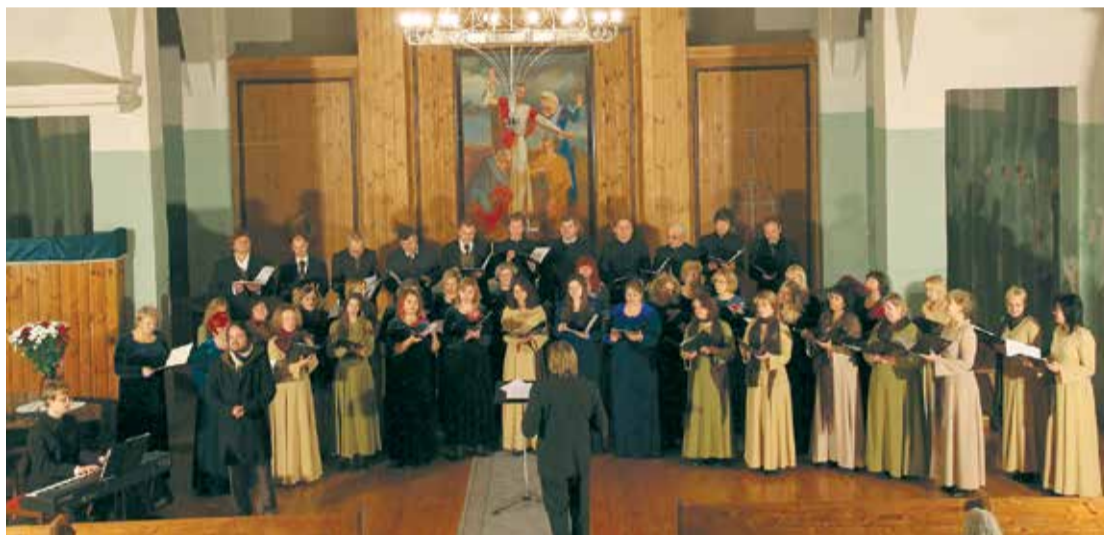
Novembrī skatītājus priecēja Garīgās mūzikas koncerti Jumpravas Sv.Jāņa ev.lut. baznīcā, Dzelmeš.