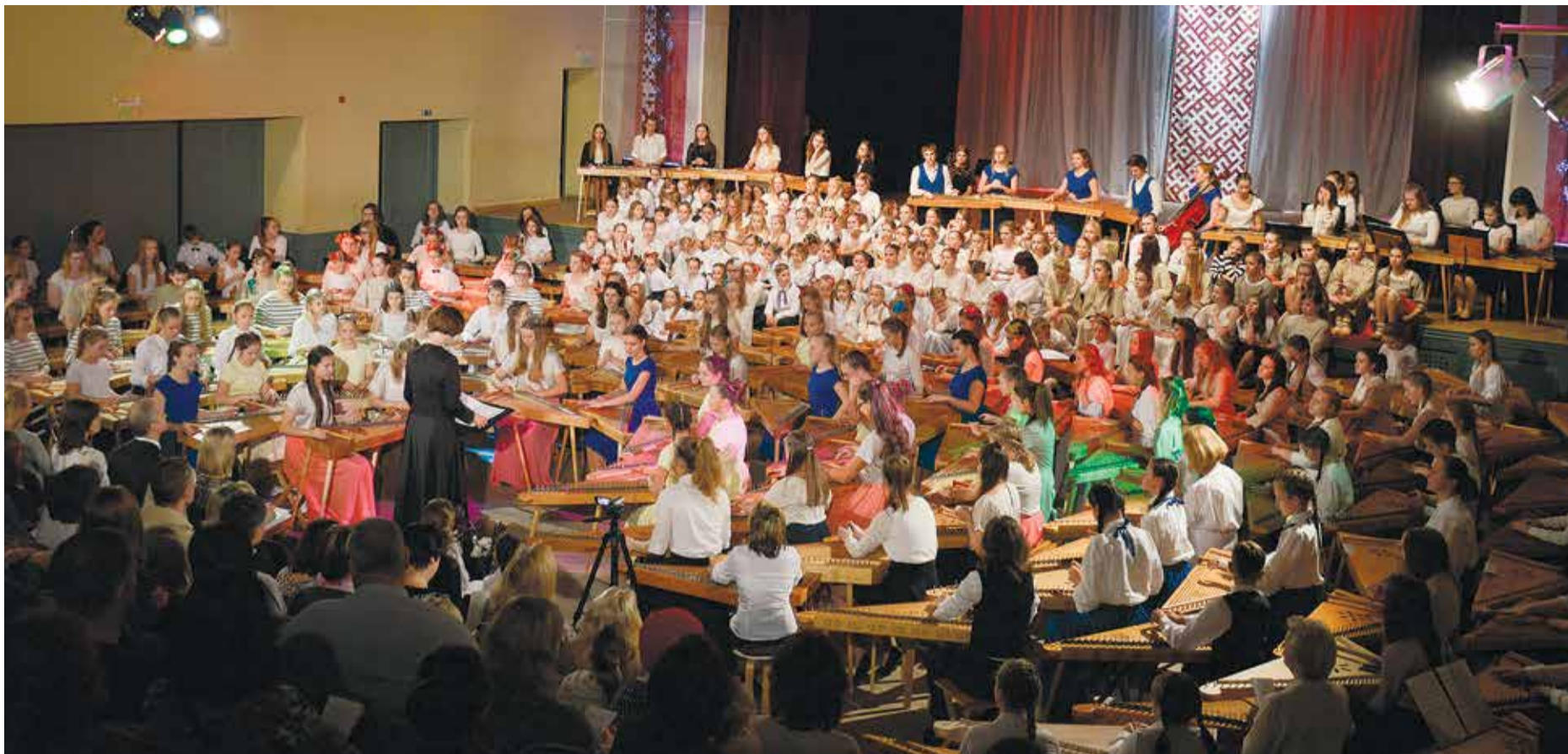
Kokļu mūzikas festivāls „Gaismas ceļā” Lielvārdē notika pirmo reizi.