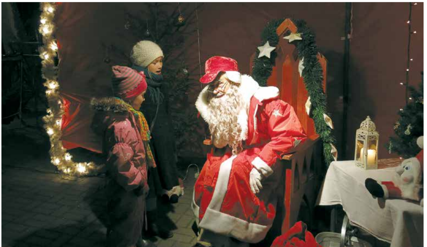
Mazajiem lielvārdiešiem bija iespēja Ziemassvētku vecītim pie auss pačukstēt savas karstākās vēlēšanās.

Vēlamiem pateikt sirsnīgu paldies visiem, kas palīdzēja radīt gaišumu un prieku Ziemassvētku jampadra-