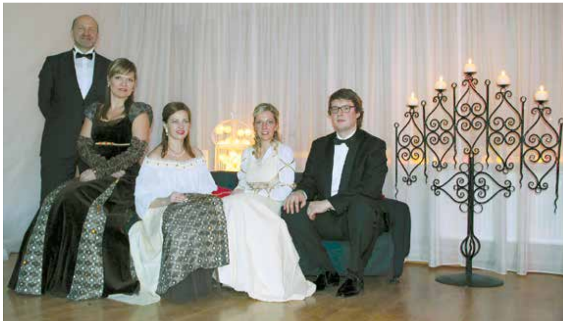
Senās mūzikas vokālais ansamblis „Modus Vivendi”.