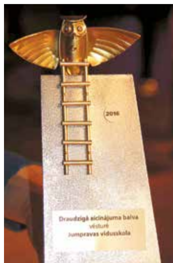
Jumpravas vidusskola šogad ieguvis Draudzīgā aicinājuma fonda balvu „Mazā pūce”. Skolu reitingā 2016.gadā Lauku skolu grupā 1.vieta nominācijā: vēsture.

Novada iedzīvotājiem vēlam priecīgus Ziemassvētkus un panākumiem bagātu Jauno gadu!