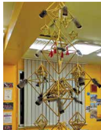
2. klases darinātais puzurs. Tas tapa no 31 tradicionālās formas, kura simbolizē gadu ar 12 mēnešiem. Puzura rotājumi tika papildināti ar spalvām, latviskām zīmēm un sarkaniem dzīpariem, akcentējot dzīvības, iedvesmas un spēka nozīmi. Arī paši šajā tapšanas procesā sajūtām labas domas, saliedētību un klases spēku. Lai izdodas! Visiem gaisus un siltus svētkus!