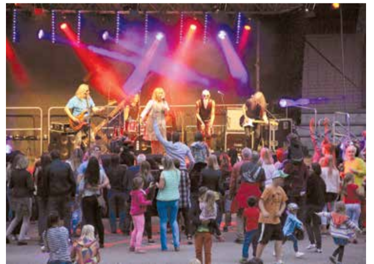
Grupa „Pērkonis” Jumpravā!