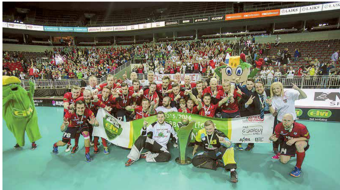
Florbola komanda „Lielvārde” – Latvijas čempioni!

Izvērtējot lielvārdiešu aktivitāti, varam priecāties, ka pieaudzis trenāžieru zāles un brīvā laika apmeklētāju skaits, esam kļuvuši sportiskāki un veselīgāki. Daudzi no mums ne tikai paši ir aktīvi, bet arī apmeklē sacensības un atbalsta mūsu sportistus. Organizējot dažāda līmeņa sacensības un veicot saimniecisko darbī-