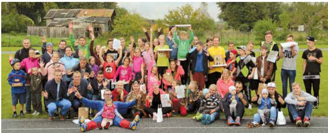
Septembrī, uzsākot jauno sezonu, tiek organizētas netradicionālās sporta spēles "Jumpravas Olimpiskās spēles", kas ik gadu iezīmē Jumpravas kultūras nama sezonas sākumu, kad visas dienas garumā ģimenes, bērni, amatierkolektīvi, iestādes, uzņēmēji un sporta entuziasti var piedalīties dažādās sporta un netradicionālās sporta aktivitātēs, bet vakarā izdejoties sezonas disko ballītē Jumpravas kultūras namā.