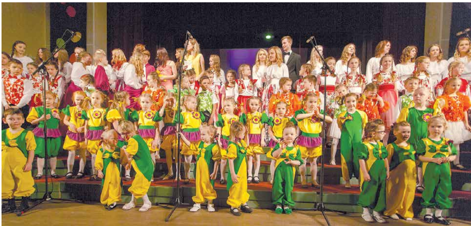
„Mikaušu” 35 gadu jubilejas koncerts.