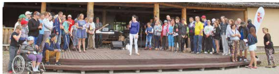
Viens no Lieltvārdes novada pagājušā gada labajiem darbiem – jau trešo reizi noritēja nometne IE[SPE]JA cilvēkiem ar fiziskās un intelektuālās attīstības traucējumiem.

12. Jau divdesmito gadu sadarbībā ar Jumpravas pagasta uzņēmējiem, sociālā darba speciālisti Jumpravas pagasta apzinātajiem vientuļajiem