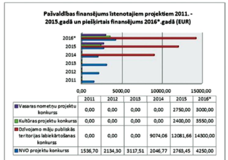
* Projektu konkursu summas Lielvārdes novada pašvaldības 2016.gada apstiprinātajā budžetā

• Lielvārdes novada kultūras iestāžu reorganizācijas plānu.