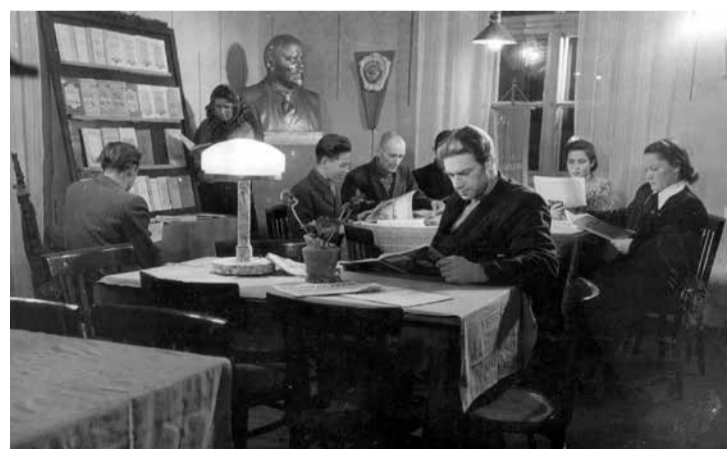
Ciema bibliotēkas lasītava 1953. gadā.

Gatavojoties lielajam notikumam, Lielvārdes pilsētas bibliotēka un Lāčplēša bibliotēka pēta un apkopo ziņas par bibliotēkas seno un neseno vēsturi. Bibliotēkas aicina ikvienu, kuram ir kādas atmiņas vai fotogrāfijas ar bibliotēku ēkām, pasākumiem bibliotēkās, bibliotēkārēm, un tml., atsaukties un atnest jebkādu, arī šķietami