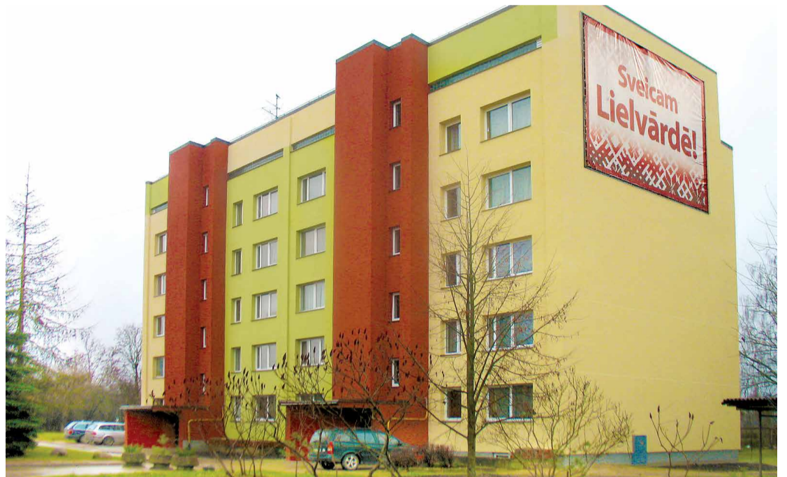
Lāčplēša ielas 23A ēka Lielvārdē, kuru tās iedzīvotāji 2012. gadā nosiltināja, izmantojot Eiropas Savienības līdzfinansējumu.

vadu sakārtošana kāpņu telpās dos vaļu radoši izpausties, pašiem izdalojot savas kāpņu telpas sienas. Un būsīm mājās nevis tikai ieejot savā dzīvokli, bet jau sperot soli pār mājas ārdurvu sliekšni.