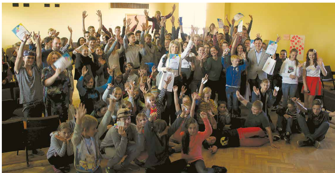
„Karjeras nedēļa” Jumpravas vidusskolā.