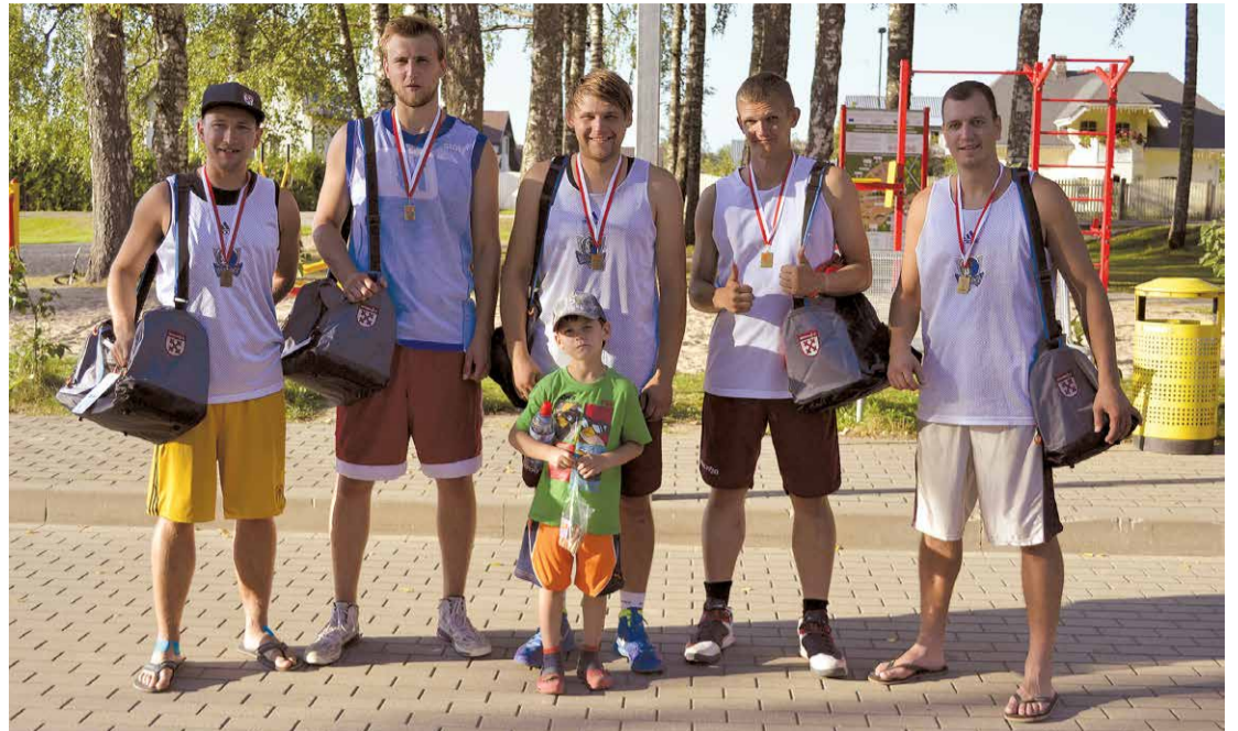
Ielu basketbols Lielvārdes novadā bija lielā cieņā, par to liecināja āra laukumu noslogojums vasaras mēnešos. Sacensībās "Streetbola vasara" noskaidroja labākās komandas visas vasaras garumā, un tikai fināla posmā sev uzvarētāju godu nodrošināja komanda "Kumelji".