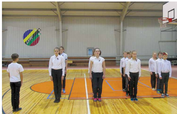
Lāčplēša dienas pasākumā Lēdmanes pamatskolā skolēni demonstrē prasmes ierindas soļošanā.