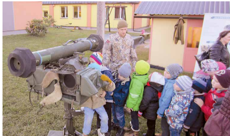
Karjeras nedēļas pasākums VPIL „Zvaniņš”.