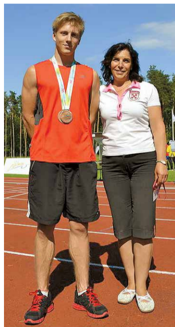
Lielvārdes novads ar augstiem panākumiem tika pārstāvēts Latvijas Jaunatnes vasaras olimpiādē.