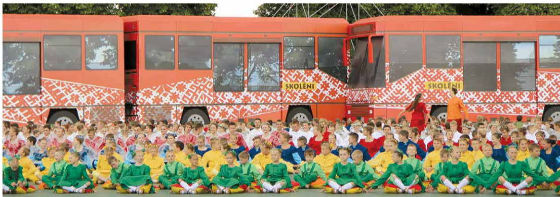
XI Latvijas skolu jaunatnes dziesmu un deju svētki, tautas deju lieluzvedums "Līdz varavīksnei tikt", deja "Upītes malā".