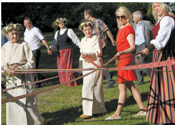
Lielvārde uzņem pašvaldību izpilddirektorus no vairāk kā 70 Latvijas pašvaldībām.