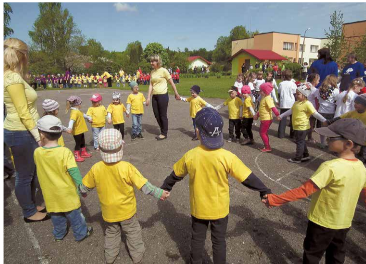
Jau trešo gadu VPIL „Pūt, vējiņi” notiek „Mazie dziesmu un deju svētki”.

• 2015. gads Lielvārdes VPIL „Pūt vējiņi” bija pasākumiem bagāts – 30 gadu jubilejas gads. Īpaši veiksmīgi pasākumi, kuros lielu atbal-