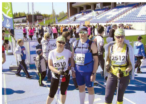
Lielvārdes novada sportisti ar labiem sasniegumiem piedalījušies dažādās sacensībās, bet ļoti labi sasniegumi ir bijuši Lēdmanes sportistiem skriešanas un nūjošanas sacensībās, un Lielvārdes sportistiem svarcelšanas sacensībās visa gada garumā.

Turpinājām iesāktās tradīcijas. Septembrī Jumpravā notika olimpiskās spēles 2015, bet vasarā, novada svētku laikā, sportojām Aktivās atpūtas dienā.