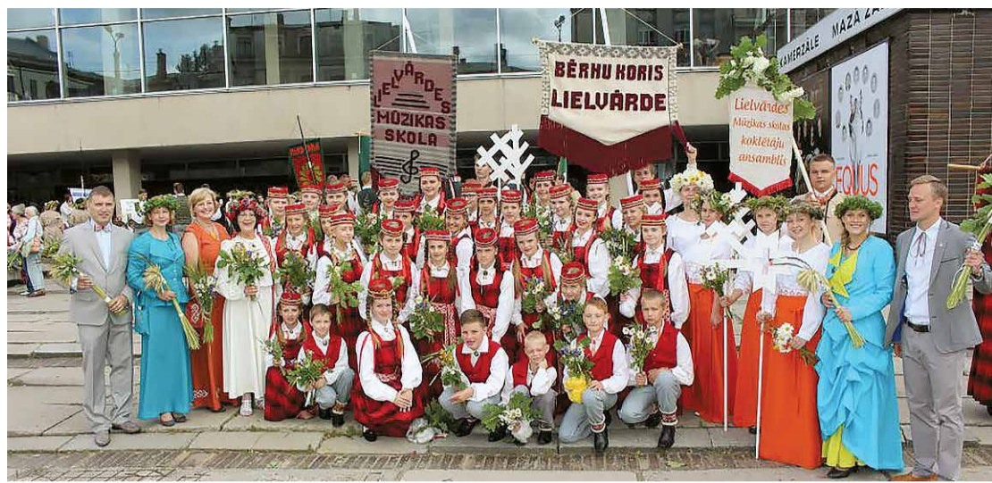
Lielvārdes Mūzikas skola piedalās Latvijas Skolu jaunatnes Dziesmu un deju svētkos.