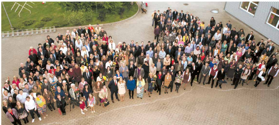
Edgara Kauliņa Lielvārdes vidusskolas 70 gadu salidojums.