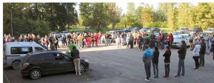
Tiek dotas norādes pirms auto-foto orientēšanās sacensību „Lielvārdes josta” sākšanās.

18A (grāmatnīcas „Jumava” telpās). Ja tiks saņemts Lielvārdes novada domes atbalsts, tad ar izvēlēto pretendentu tiks slēgts telpu nomas līgums uz trim gadiem. ✘