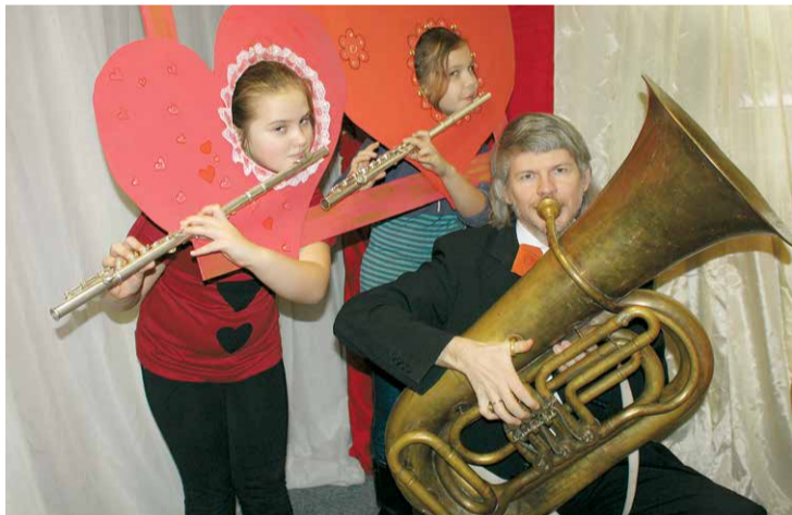
Jumpravas Mūzikas un mākslas skola atzīmē „Mīlestības nedēļu”.