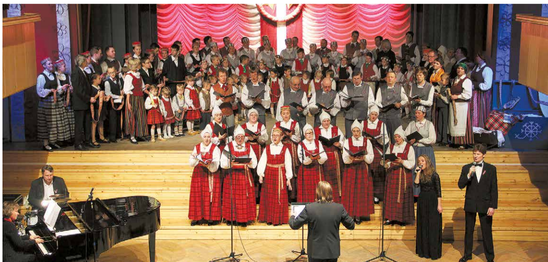
Latvijas valsts svētku koncerts Jumpravas kultūras namā. Uz skatuves visi koncerta dalībnieki.