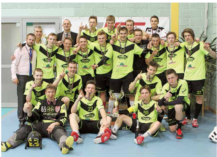
Lielvārdes novada sporta centra jauniešu florbola komanda izcīnīja godalgotas vietas visās vecuma grupās Latvijas jauniešu florbola čempionātā. (U16-3.vieta, U10, U12, U14 - 2.vietu un U18 -1.vieta). Vīriešu virslīgas un veterānu florbola komandas sezonu noslēdza augstajā 4.vietā.

Turpinājām iesāktās tradīcijas. Septembrī Jumpravā notika olimpiskās spēles 2015, bet vasarā, novada svētku laikā, sportojām Aktivās atpūtas dienā.