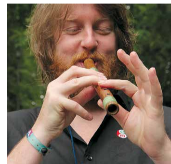
Starptautiskā folkloras festivāla "Baltica 2015" ieskandināšanas pasākums Lielvārdē.