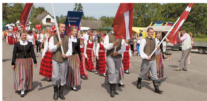
Svētku gājiens Lielvārdes novada svētkos.