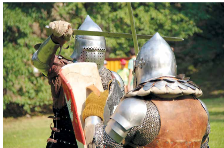
Seno cīņu paraugdemonstrējumi Lielvārdes pils svētkos.

10. decembrī noslēdzās Lielvārdes novada pašvaldības organizētā telpu nomas atlase „Telpu noma Lielvārdes novada pašvaldības Tūrisma informācijas centra vajadzībām”. Kopumā no iesnieg-