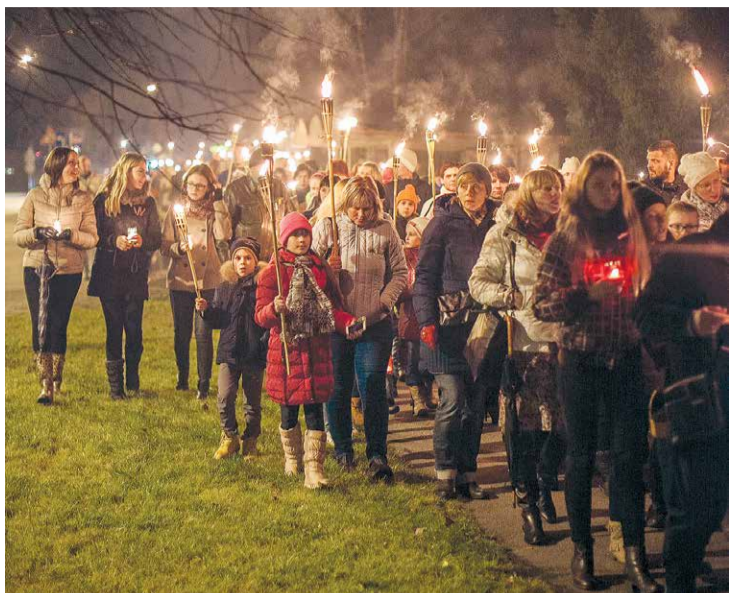
Lāčplēša dienas lāpu gājiens Lielvārdē.