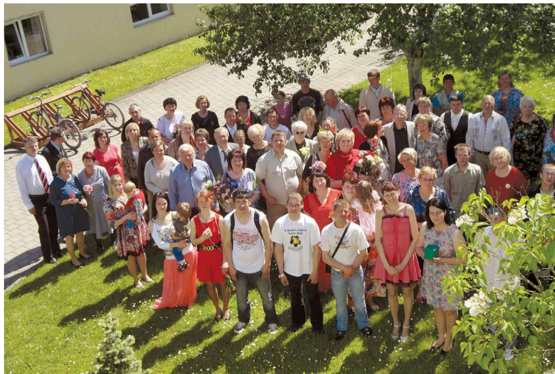
Jumpravas speciālās internātpamatskolas 40 gadu salidojums.