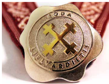
„GODA LIELVĀRDIETIS” goda zīme.