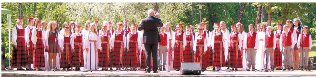
Rembates parka svētki un XI Latvijas skolu jaunatnes dziesmu un deju svētku ieskandināšanas lielkoncerts.