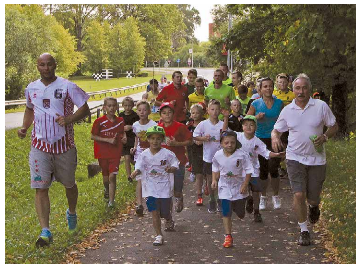
Mācību gads Lielvārdes novada sporta centrā šogad iesākās ar izglītojamo, vecāku un treneru skrējieni.