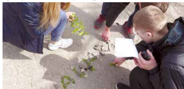
No dabas materiāliem top vārds „Award”.

Jauniešiem vasarā jādodas piedzīvojumu ceļojumā, bet pirms tam jāgatavojas treniņnodarbībās. Šogad apmācības divas dienas norisinājās Lielvārdes pamatskolā, kur ir lielākā un aktīvākā „Award” grupa Latvijā. Mugursomām, pozitīvu noskaņojumu un vēlmi darboties bruņojušies, 22 Lielvārdes pamatskolas un divi Taurupes „Award” dalībnieki mācījās darboties ar kompasu un karti, sakārtot ceļasomu, sniegt pirmo palīdzību, saplānot maršrutu, iekurt ugunsķurru un sastādīt pilnvērtīgu ēdienkarti. Izmēģinājuma ceļojumā pārbaudījām prasmi darboties komandā. Lai cits citu iepazītu, komandas veidoša-