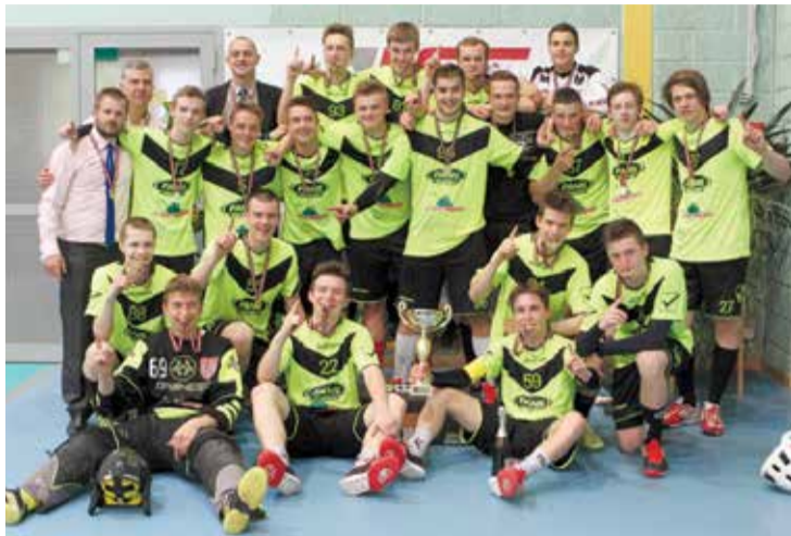
Latvijas čempioni U18 vecuma grupā – komanda „Lielvārde/COFFE MASTER/FANS”.