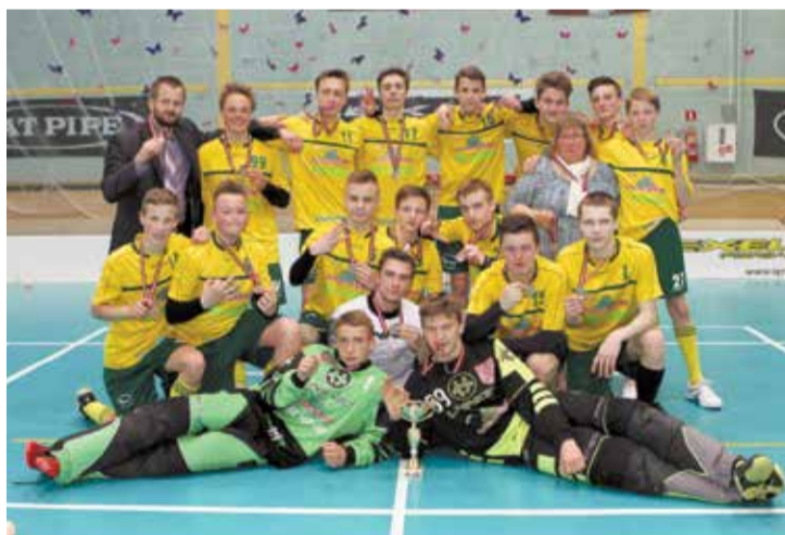
U16 florbola komanda – Latvijas čempionāta bronzas laureāti.

Pirmās Starptautiskās jaunatnes Olimpiskās dienas sarīkoja 1987.gadā par godu Nīderlandes Olimpiskās komitejas 75.gadu jubilejai, un tajās piedalījās astoņsimts 12 līdz 17 gadus jauni sportisti no sešām Eiropas valstīm. Sākot ar 1991.gadu Eiropas Jaunatnes olimpiāde vasaras sporta veidos notiek katru otro gadu, bet no 1993.gada notiek Eiropas jaunatnes olimpiāde ziemas sporta veidos. Gan sporta veidu klāsta, gan ceremoniju ziņā sacensības līdzinās Olimpiskajām spēlēm. Šovasar Eiropas Jaunatnes olimpiāde notiks Gruzijas galvaspilsētā Tbilisi.