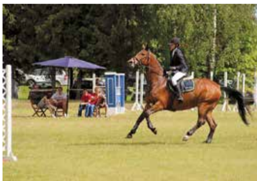
Jāšanas sports ir Latvijā tradicionāls sporta veids, kaut gan pēdējos gados tā popularitāte mazinājusies. Tomēr „Lāčplēša kauss” Lielvārdē pierādīja, ka entuziastu šim visnotaļ elitārajam sporta veidam netrūkst – tātad tam ir nākotne Latvijā.

nās pildīt seglos sēdētāja gribu un tad, kas pārbaudījums bija veiksmīgi paveikts, zirgs saņēma pateicības vārdus un glāstus. ❄