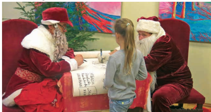
Omuliģie salaveči pierakstīja, kādas dāvanas bērni vēlas saņemt svētkos.