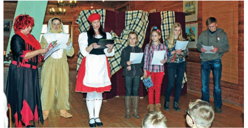
Dzejoļu konkursa „Krustceles” noslēguma pasākumā.

Andreja Pumpura Lielvārdes muzeja kolektīvs