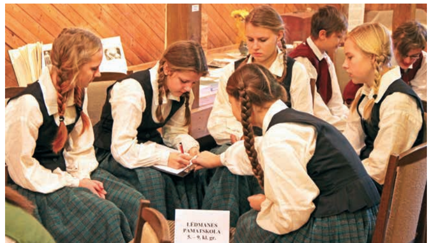
Tautasdziesmu dziedāšanas sacensības „LAKSTĪGALA” Andreja Pumpura Lielvārdes muzejā.

Mēs varam būt lepni par mūsu skolēniem un skolotājiem, kas katru dienu ar savu darbu pierāda, ka esam zinoši, erudīti, veikli un atraktīvi, ka godam nesam Lielvārdes novada vārdu Latvijā. Paldies visiem pedagogiem par ieguldījumu darbā ar jauniešiem, atstīstot viņu dzīvesprasmes un motivējot sasniegt aizvien augstākus rezultātus! ❖