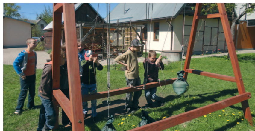
Izziņas un eksperimentu centrā „Lielvārde”.