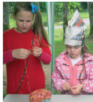
Radošās darbnīcas.