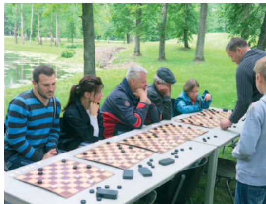
Dambretes turnīrs Rembates parka svētkos.