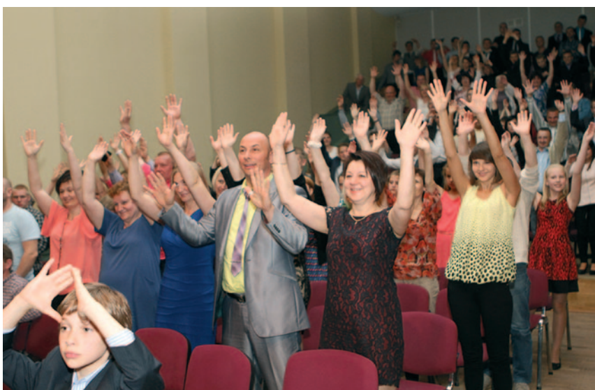
Aktīvie „Sporta laureāta” līdzjutēji.