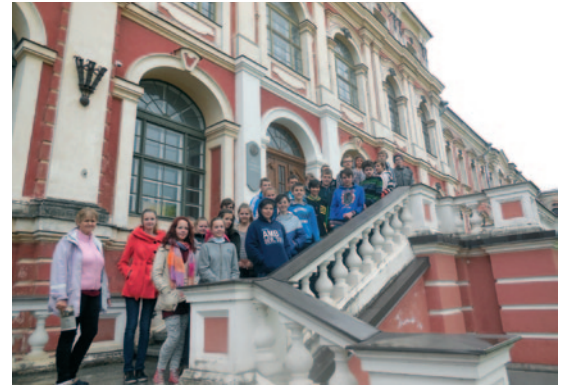
Pie Jelgavas pils.

Lai visiem saulaina vasara un daudz piedzīvojumu, septembrī atkal gaidīsim visus skolā! ❖