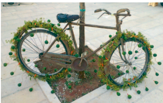
Indras un Daces veidotā kompozīcija ar veco velosipēdu.

Itāļiem mūsu darbs ar Pradas rokassomiņu ļoti pati-