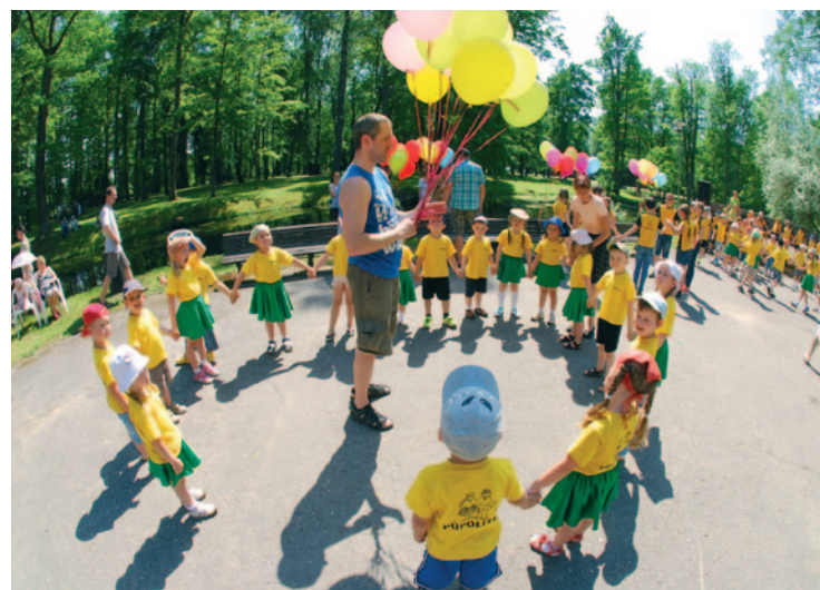
Katrs balons aiznesīs sev līdzīgu kādu mazu sapni.

Lai mēs paliktu pasaules līmenī, mums ļoti daudz jā-mācās, jābrauc uz semināriem, jādomā netradicionāli, jo tu vari pārsteigt kādu, tikai izejot no pierastajiem rāmjiem.” ❀