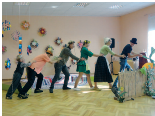
Teātra pulciņa izrāde „Rācenis”.

Visi skolas skolēni piedalījās matemātikas pasākumā „Skaitļu valstībā”, kurā katrai klasei bija iespēja parādīt savu atjautību un erudīciju matemātikas uzdevumu labirintos.