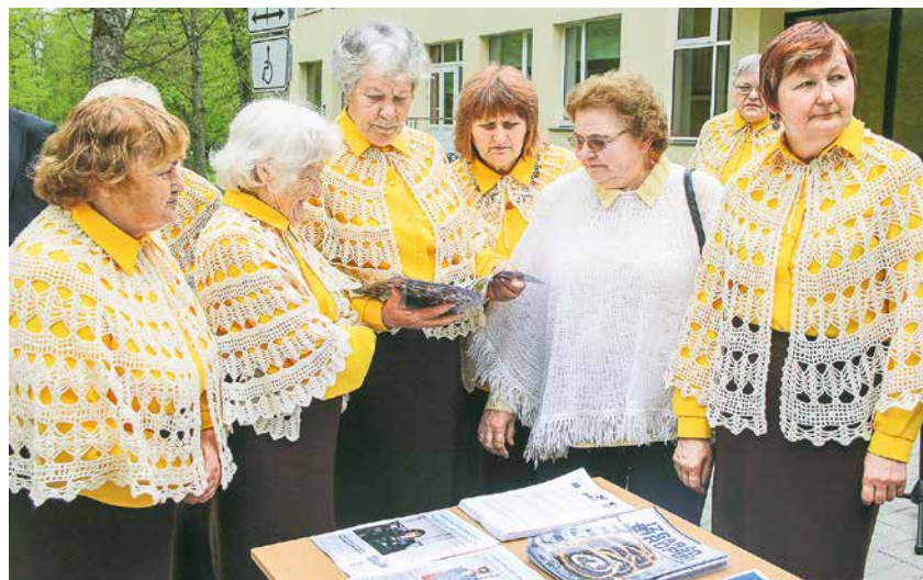
Senioru koris „Kamene”.

Starp informācijas galdā izliktajiem informatīvajiem materiāliem lielāko piekrišanu izpelnījās receptu grāmata „Izgaršo Eiropu”. ❖