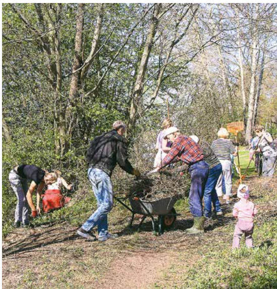
Opernieku, Baņutas un Daugavas ielas iedzīvotāji sakopa atpūtas vietu pie Daugavas.