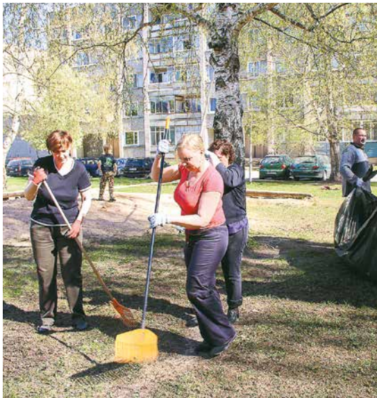
Avotu ielas iedzīvotāji sakopa bērnu rotaļu laukumu.