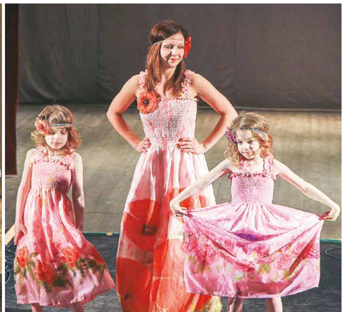
Lielvārde var! modes skate „Gaismu skaņa... spīdi, staro, uzdriksies”.