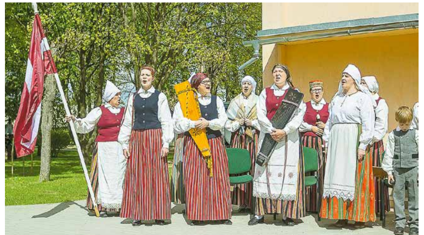
Folkloras kopa „Liepu laipa” uzstājas Kretingā.

Paldies Lielvārdes novada pašvaldībai par atbalstu braucienam! ❖