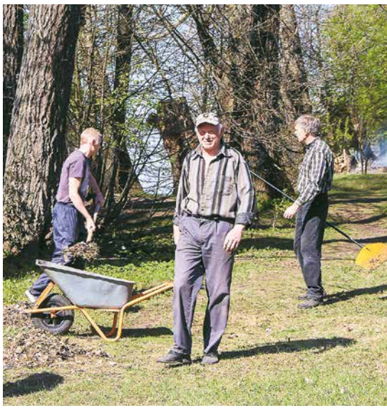
Daugavmalas iedzīvotāji pavasara talkā.