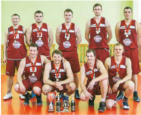
«Lielvārde/bacca» basketbolisti izcīnīja gan čempionu kausu un zelta medaļas, gan arī tiesības nākamajā sezonā spēlēt Ogres novada čempionāta 1. līgā.