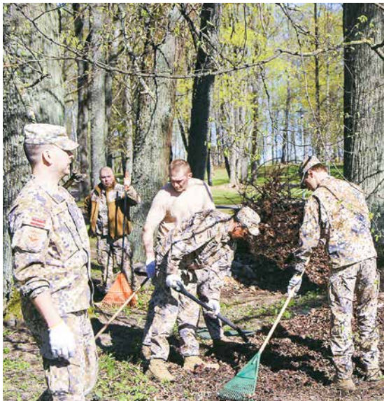
NBS Gaisa spēku karavīri centīgi vāca lapu kaudzes Rembates parkā.