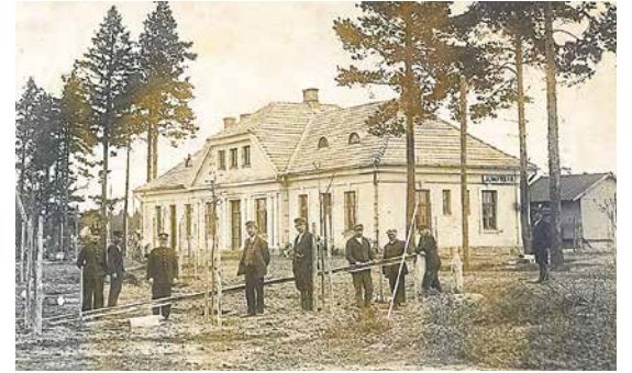
Jumpravas dzelzceļa stacija (1920–1940 gadi).