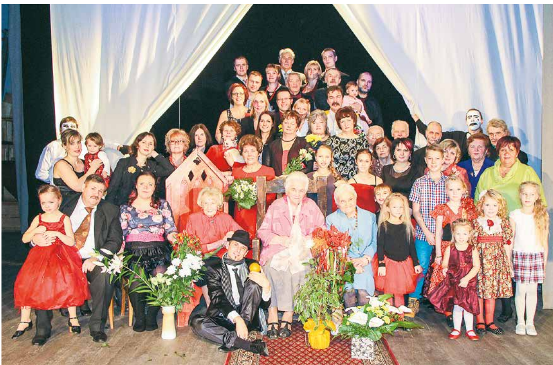
Lielvārdes tautas teātris jubilejas pasākumā.