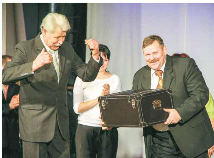
Dāvana no kultūras nama „Lielvārde” – kaste rekvizītiem.