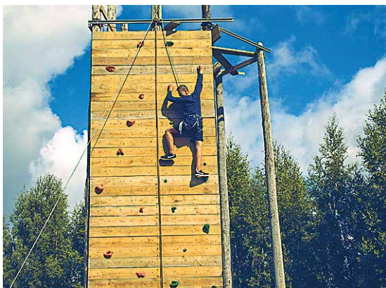
Grūtā rūpnieciskā alpinisma sienas ieņemšana.