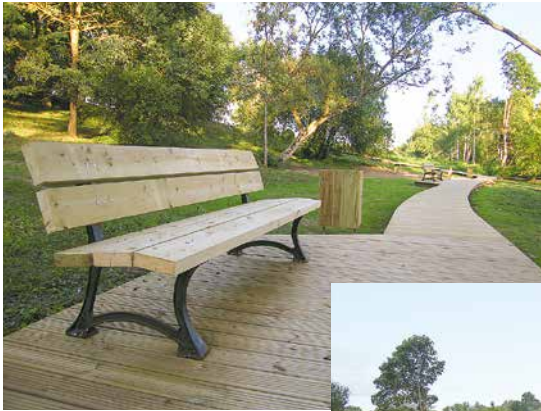
▲ Gar taku novietoti soliņi atpūtai un Daugavas skata baudīšanai.

Interese par paveikto ir arī makšķerniekiem un tūristiem, jo takai pieguļošā laipa ir aprīkota ar vietām laivu nostiprināšanai, no laipas var arī makšķerēt.