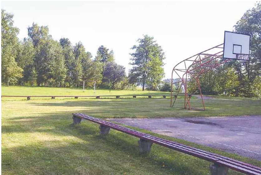
Kaibalas sporta laukums pēc atjaunošanas.

Aicinu visus iedzīvotājus aktīvi nodarboties ar sportu, ko tagad var darīt arī Kaibalā. Šobrīd Kaibalas skolas sporta laukumā var spēlēt futbolu, basketbolu un volejbolu.