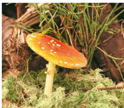
Izstādi grezno košā mušmire.