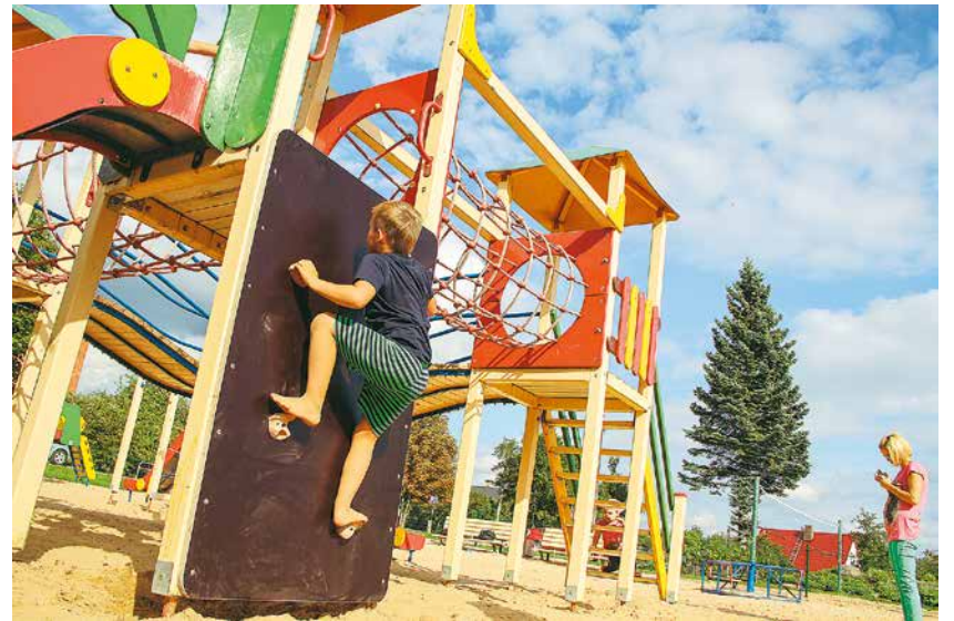
Rotaļu laukums Spīdolas ielā.

Lielvārdes novada pašvaldības, Labklājības ministrijas un Bērnu un ģimenes lietu ministrijas sadarbībā īstenotā projekta „Bērnu rotaļu un atpūtas laukuma izveide Spīdolas daudzdzīvokļu māju masīvā” rezultātā tapušais laukums joprojām labākais Lielvārdes novadā. Te šogad atjaunota alpinisma siena, salabots šūpojošais zirdziņš, nomainīti koka kāpsliņi un tītiņš, nostiprinātas metāla konstrukcijas, kā arī atjaunots krāsojums. Smilšu segumu rotaļu laukumā atjauno katru gadu.