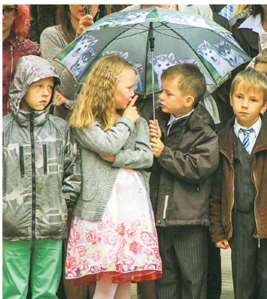
1. septembris Edgara Kauliņa Lielvārdes vidusskolā.

Jumpravas vidusskolā šīnī mācību gadā ir viena pirmā klase ar 19 skolēniem. Te atvērta jauna vidusskolas programma – tālmācība, kurā nav vecuma ierobežojuma, skola aicina tajā mācīties cilvēkus neatkarīgi no viņu dzīvesvietas. Katrs var mācīties sev ērtā laikā, skolā kārtot tikai obligātos pārbaudījumus. Mācīšanos vidusskolēns organizē patstāvīgi.