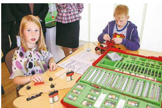
Tūlīt iedegsies lampiņa un eksperiments būs izdevies!