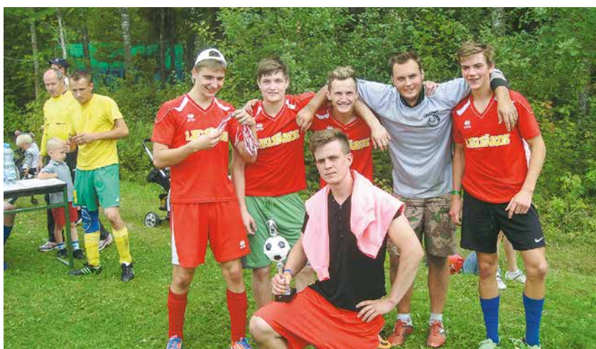
Lielvārdes komanda – Avotu kausa ieguvēji.