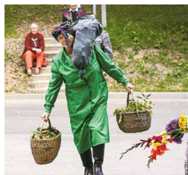
Skatītāji ar sajūsmu vēroja sēņošanas ainiņas no filmas “Tās dullās Paulīnes dēļ”.