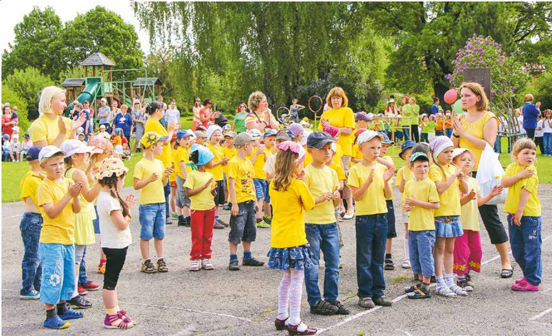
Svētkos bērnu dārzā „Pūt vējiņi” Lielvārdē.

Diemžēl šogad netika izmantota Vecāku padomes ierosinātā ideja ar peldbaseina rekonstrukcijas ideju piedalīties PPP biedrības „Zied Zeme” izsludinātajā projektu konkursā, kurā pašvaldībām iespējams iegūt finansējumu 75% apmērā no projekta attiecināmajām izmaksām. Vecāku padome ir apņēmības pilna meklēt jaunas finansējuma gūšanas iespējas, būt lietas