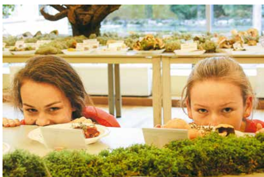
Tik daudz sēņu, ka tajās var pat paslēpties.

Paldies visiem, kas ar sēņu izstādēm jau 10 gadus ienesuši meža savdabību mūsu ikdienā un papildinājuši zināšanas par tā bagātībām un noslēpumiem, ļāvuši mums priecāties par dabas skaistumu un dāsnumu!