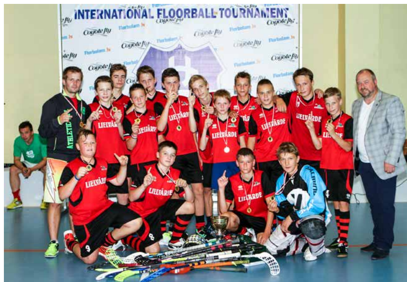
Pirmie «Unihoc Riga Cup» ieguvēji – U-14 vecuma grupas komandas «Lielvārde» florbolisti.