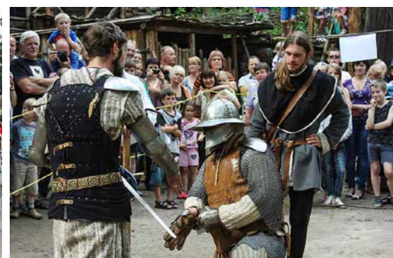
Viduslaiku cīņas.