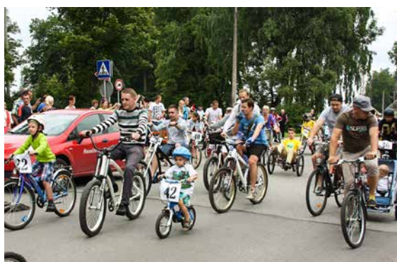
Mopēdu un velosipēdu parāde.