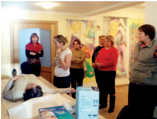
Mācās guļošu klientu pozicionēšanu, lai guļot vienā pozā nerastos izgulējumi.

2013. gada 18. janvārī Mobilās brigādes speciālisti uzsāka aprūpētāju apmācību. Sākotnēji bija plānots apmācīt 2 aprūpētājus, bet, ņemot vērā projektā paredzētos materiālos resursus un Mobilās brigādes klientu interesi, bija iespēja lūgt NVA apstiprināt projekta grozījumus un iekļaut aprūpētāju apmācībā 10 klientus.