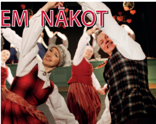
Vidējās paaudzes deju kolektīvs "Vēji" dejo tautas deju "Ai, tēvu zeme".