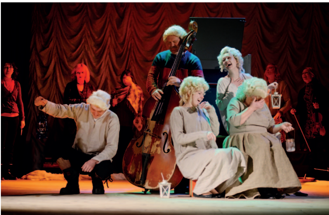
Ainas no izrādes „Sprīdītis”.