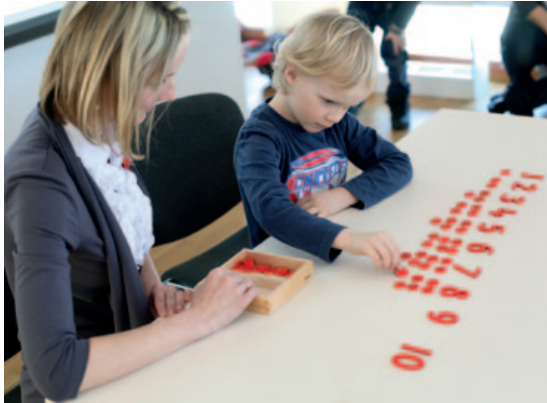
Darbojoties ar attīstošajiem Montessori materiāliem.