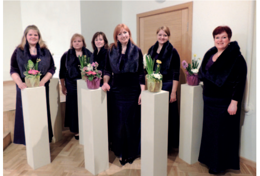
Lēdmanes dāmu vokālais ansamblis „Stari”.

Uz vokālo ansambļu 2. kārtu, kas notiks jau 23. martā Ogres KC, tika izvērtēti 9 (puse no startējošiem skatē) kolektīvi: Ogres KC vokālā grupa „Anima Solla” (49 punkti), Lēdmanes t/n sieviešu v/a „Stari” (43,66), Tomes t/n sieviešu vokālais ansamblis (42,33), Ikšķiles sieviešu v/a „Nona” (41,33), Madlienas k/n senioru jauktais v/a „Tik un tā” (40,66), Ogresgala t/n jauktais v/a „Saime” (40,33), Suntažu k/n sieviešu v/a „Svīre” (40,00), Ikšķiles t/n jauktais v/a „Grams” (40,00), un Birzgales t/n jauktais v/a „Tikai tā” (39,33) Dziedāšana paceļ augstāk par ikdienas darbiem un steigas, liekot aizmirst par problēmām, kad tās uzrodas neaicinātas. Esot mēģinājumā, tās kaut kur izplēn, izkūst dziesmās. Dziedam, jo tas ļoti patīk! Es laikam nevarētu nedziedāt, man tas ir vajadzīgs kā ūdens, kā gaiss... Domāju, tā jūtas katrā no mums. Un, ja vēl spējam raisīt klausītājos šīs sajūtas un redzēt viņu mirdzošās acis un smaidošās sejas, ko vairāk var vēlēties?! Ansambli dziedam sešas kārtas un visas esam soproņā balsi īpašnieces. Tādēļ mēģinām iezīties no šīs situācijas, katrā pa kārtai dziedot alta partiju. Ļoti priecātos, ja mums pievienotos kāds labs altīņš. Mēģināt sanākam divas