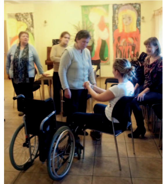
Aprūpētāji mācās, kā pareizi un netraumējot sevi, pārvietot pacientu no gultas uz ratiņkrēslu vai poda krēslu.

Aprūpētāju apmācību laikā tiek analizēta sociālās aprūpes sistēma Latvijā un aprūpētāja loma sociālās aprūpes sistēmā, kā arī runāts par vietējo kopienu – aprūpes mājās pakalpojuma organizāciju Lielvārdes novadā. Svarīgi bija runāt arī par aprūpētāja personību un aprūpes procesu, kādi ir profesijas izvēles iemesli un kritēriji, jo aprūpētāja profesija prasa daudz emocionālās atdeves un pakļauta izdegšanas riskam. Tiek analizētas aprūpes procesa īpatnības personām ar funkcionāliem traucējumiem (redzes, dzirdes, kustību, garīgiem traucējumiem) un bērniem ar īpašām vajadzībām, kā arī sniegts ieskaits paliatīvajā aprūpē. Apmācības kursa ietvaros aprūpētāji iegūst zināšanas arī par gerontoloģiju, biežākām veco ļaužu aprūpes problēmām, ģimenes nozīmi vecu cilvēku aprūpē, saskarsmes īpatnībām, slimu un vecu cilvēku kopšanu, klienta pašaprūpes spēju veicināšanu un atbalstīšanu, aprūpes līdzekļu izmantošanu, aprūpes metodēm, paņēmieniem personām ar pārvietošanās grūtībām, vides pielāgošanu, tehnisko palīglikmju izmantošanu u.c. Apmācību noslēgumā ir paredzētas praktiskās nodarbības klientu dzīves vietā. Aprūpētāju apmācība noslēgsies 2013. gada 22. martā.