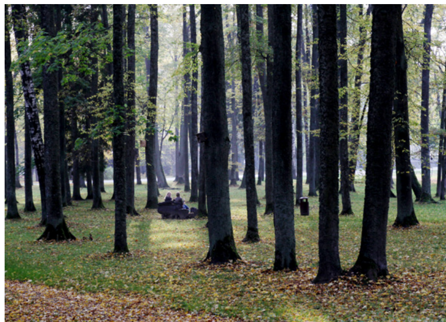
Rembates parks.

arborists (kokkopis) veica esošo koku novērtēšanu parka centrālajā daļā un virzienā uz Lielvārdes dzelzceļa staciju. Rembates parks ir īpaši aizsargājama dabas teritorija – aizsargājams dendroloģiskais stādījums, tāpēc, saskaņā ar spēkā esošiem normatīvajiem aktiem, novērtējumu no-