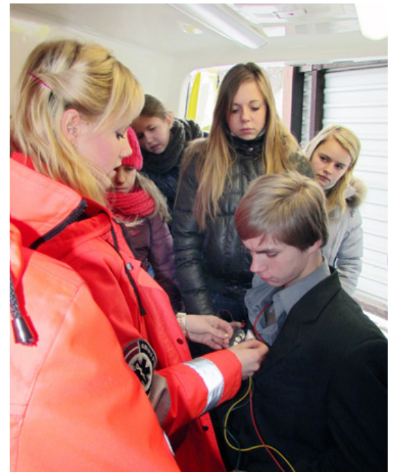
Jaunieši ēno Neatliekamās medicīniskās palīdzības dienestā.

„Šī gada 13. februārī apmeklēju Latvijas Nacionālo Vēstures muzeju, ēnojot muzeja numismātikas departamenta vēsturnieces. Ar šo nozari nekad agrāk nebiju saskārusies, tomēr laipno muzeja gidu pavadībā sapratu, ka numismātika ir nozare, kas pēta naudu un tās vēsturi. Iejūtoties vēsturnieces darbā, tiku iepazīstināta ar visu plašā muzeja daudzveidīgo ekspozīciju, ceļojot laikā no primitīvām latviešu senču apmetnēm līdz pat mūsdienām. Tā kā muzeja telpas atrodas Rīgas pili, varēju iepazīt arī pašu pili, aplūkot tās plašumus, biezos mūrus un senās velves. Vēlāk tiku iepazīstināta ar muzeja aizkulīšiem un reālo vēsturnieka ikdienu. Skatam pavērās milzīga kartotēka, tūkstošiem ekspozīcijās neizliktu priekšmetu un īpašu dārgumu. Vieni no atmiņā paliekošākajiem priekšmetiem, kurus varēju aplūkot, bija Triju Zvaigžņu ordenis un vairākus tūkstošus gadu sena romiešu monēta. Numismāta ikdienu ir ekskursiju vadīšana, naudaszīmju reģistrēšana un informācijas vākšana. Vēsturnieka