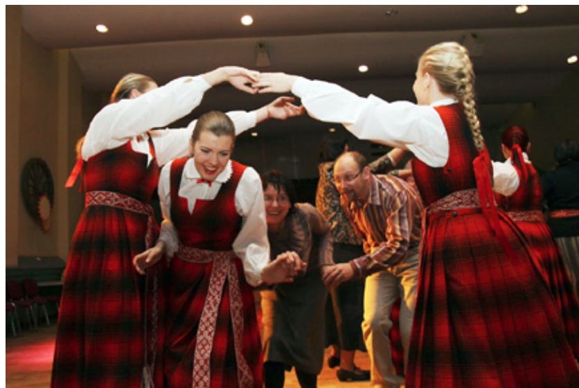
Lielvārdes jostas rakstu izdejošana „Gaismas Dārzā”.

A. N.: Jā, tas ir rets gadījums, ka pēc 23 gadiem atceras kādreiz doto solījumu. Būs liels prieks kopā ar lielvārdiešiem izjust mūsu tautas ritmu un jostas rakstu skaistumu.