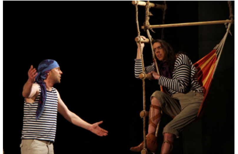
Aina no izrādes „Santa Krusa”.