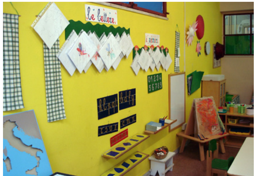
Montessori bērnudārzs Itālijā.