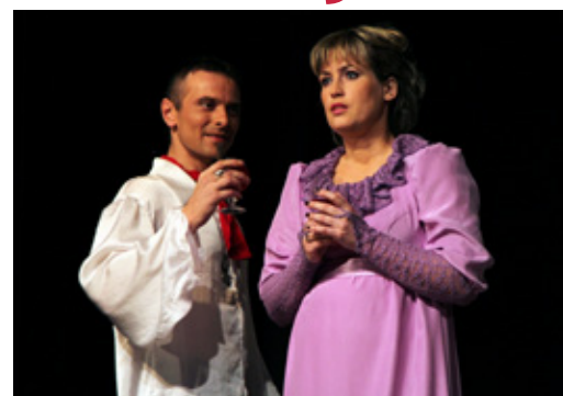
Vairāk par jauniestudējumu lasiet 6. lpp.

9. februārī kultūras namā „Lielvārde” notika Lielvārdes Tautas teātra iestudētās lugas „Santa Krusa” pirmizrāde. Ar šo iestudējumu faktiski sākusies Lielvārdes Tautas teātra 140. jubilejas gada atzīmēšana.