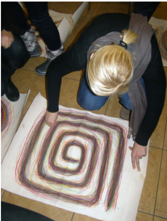
Semināra dalībnieki ne tikai klausījās, bet arī zīmēja, veidoja no plastilīna, rakstīja un aktīvi kustējās.