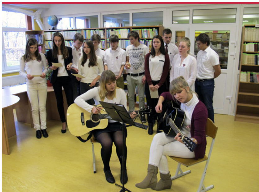
Mums dzied patriotisko dziesmu konkursa 3. vietas ieguvēji - 11.a klase.