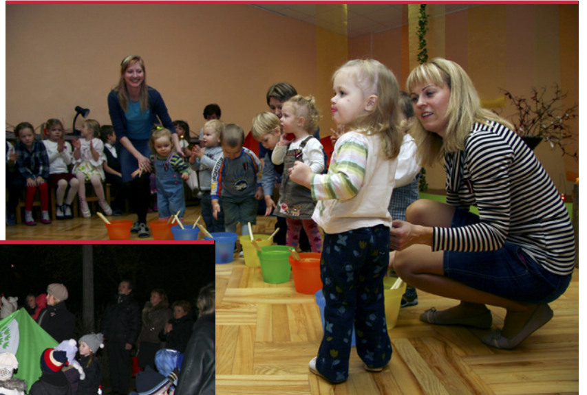
Svētkiem gatavojas paši mazākie.