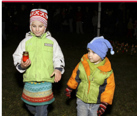
Silti mirdz svecīte mazāko svētku gājiena dalībnieku rokās.