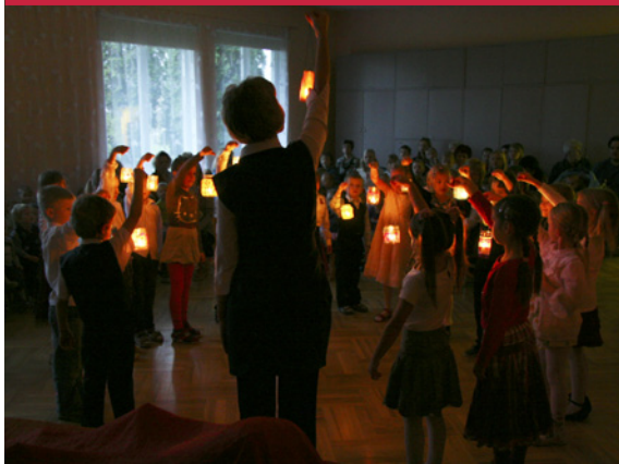
„Lukturišu svētki” sākās bērnudārza zālē.

Rudens vistumšākajā laikā, kad viss apkārt ir tumšs, drūms un pelēks, nolēmām ienest gaismu un prieku. Sakopām savu bērnudārzu, tā apkārtni, pagatavojām katram bērnam lukturīti, kur ielikt svečīti un nolēmām svinēt „Lukturišu svētkus”. Bērni kopā ar vecākiem izgaismoja savu mīlo pagastu, ejot lukturīšu gājienā apkārt bērnudārzam, sasildot katra svētku dalībnieka sirdi un arī apkārtējo pagasta namu iedzīvotāju acis un dvēseles.