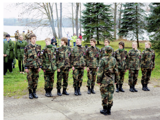
Ierindā - Jumpravas 9. klases komanda – 3. vietas ieguvēji Viru spēlēs.