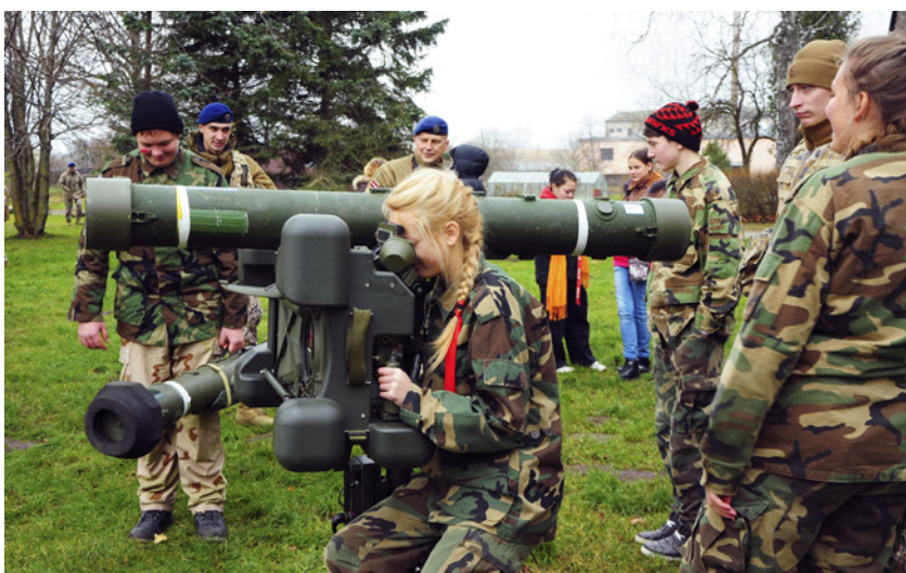
Jauniešiem bija iespēja kārtīgi apskatīt mūsu bruņotajos spēkos izmantotos ieročus.

divpadsmito reizi pēc kārtas svinēja Lāčplēša dienu.