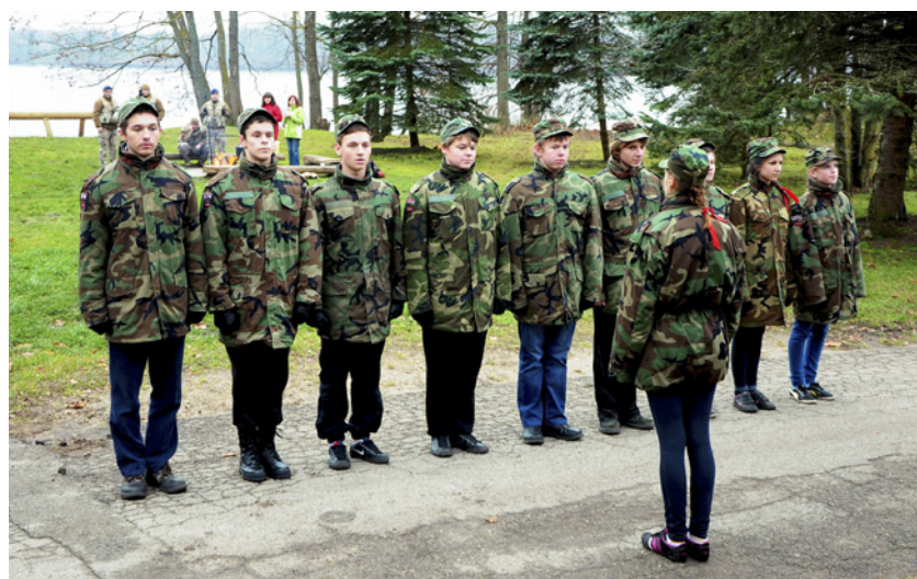
Sacensību uzvarētāji kopvērtējumā – Lielvārdes pamatskolas 9. b klase – sacensībām bija gatavojušies ļoti nopietni.