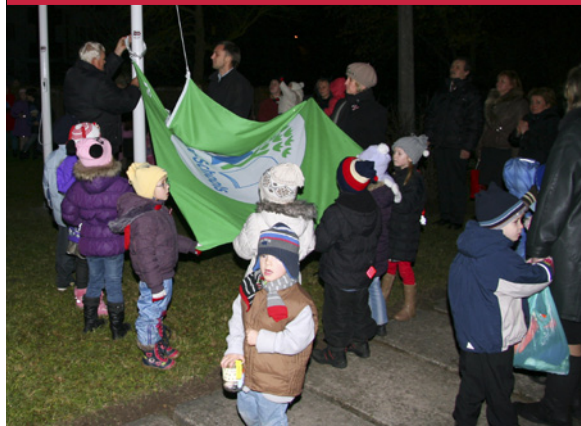
Jaunā bērnudārzam „Zvaniņš” piešķirtā zaļā Eko skolas karoga uzvilšana.