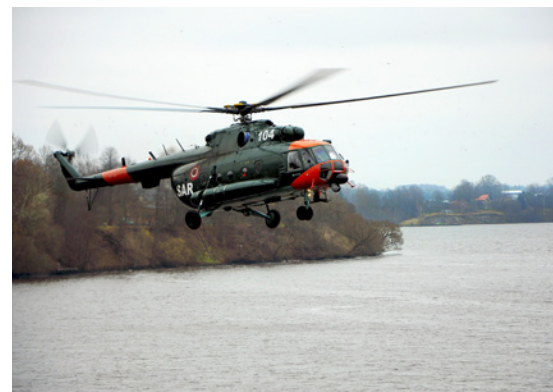
Glābšanas operāciju paraugdemonstrējumi ar helikopteri MI – 17.