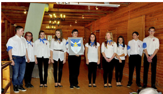
Lēdmanieši aizstāv savu Lāčplēša ordeņa ideju, viņu sniegums tiek novērtēts ar Diplomu par veiksmīgāko ordeņa risinājumu.