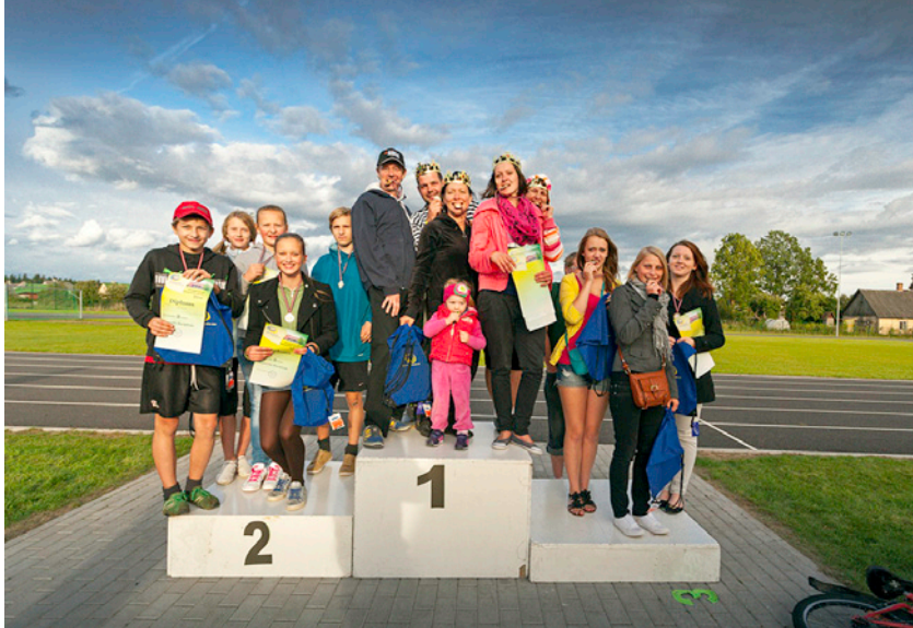
Komandu sacensību uzvarētāji – 1. vietā komanda „Saimes stripainie karaļi”, 2. vietā „Bērnu deju kolektīvs „Ritupīte” apakšgrupa „Lielie”, 3. vietā komanda „Lāčplēši”.