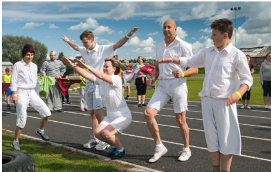
Uz starta komandas „Ritupītes” apakšgrupa „Senči”.