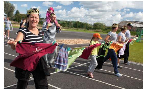
Komanda „Saimes stripainie karaļi”.