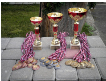
Kausi un medaļas sagatavoti uzvarētājiem.

Tiek apspriesti sacensību interesantākie mirkli.