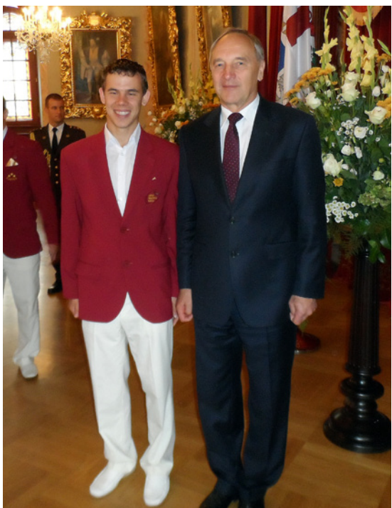
Edgars Kļaviņš pieņemšanā pie valsts prezidenta Andra Bērziņa.