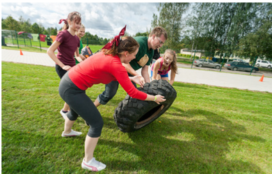
Stafete „Riepu velšana”.