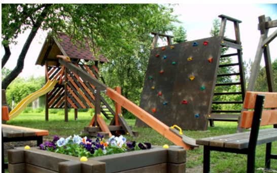
Jaunais rotaļu laukums „Krastmalu” pagalmā.

Minētie darbi tiek veikti, lai uzlabotu ēkas siltumnoturību. Lēmums par mājas renovāciju tika pieņemts dzīvokļu īpašnieku kopsapulcē. Veicot daudzdzīvokļu dzīvojamās mājas siltināšanu, būtiski samazināsies apkures izmaksas. Tai pašā laikā tiks uzlabots mājas vizuālais izskats, kā arī palielināsies dzīvokļu vērtība.