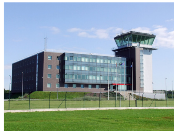
2009. gada martā aviācijas bāzē Lielvārdē tika atklāta Gaisa spēku Operāciju centra ēka.

Aviācijas bāzes attīstība ir nozīmīgākais bruņoto spēku ilgtermiņa projekts. Tā ietvaros ir paredzēts izveidot starptautiskajiem standartiem un nacionālajām pra-