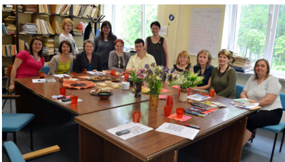
Angļu valodas nodarbībā kultūras namā „Lielvārde”.

Veiksmīgi noslēdzies vēl viens mācību gads Lielvārdes pieaugušo angļu valodas grupām. Kā jau esam pieraduši, septembrī mācības uzsāka krietni liels pulks gribētāju (iesācēju grupā - 12, grupā ar priekšzināšanām - 10), bet līdz gada beigām cītīgi strādāja seši cilvēki katrā grupā, papildus izveidojās viena neliela grupiņa Andreja Pumpura Lielvārdes muzejā. Uzreiz jāsaprot, ka skolēnu „profils” gadu gaitā krietni izmainījies. Ja senāk sestdienas nodarbības bija pievilcīgas cilvēkiem, kas draugu kompānijā gribēja nedaudz pamācīties angļu valodu, tagad tās apmeklē cilvēki spēka gados, kuriem angļu valoda vajadzīga darbam vai ar darbu saistītai ceļošanai. Protams, draugu kompānijas netrūkst, bet tā izveidojusies, kopīgi strādājot un tiecoties pēc viena mērķa.