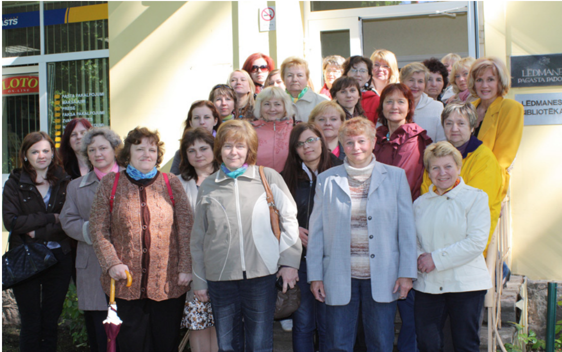
Ogres reģiona bibliotekāri pirms semināra Lēdmanē.

Šī diena Lēdmanē pierādīja, ka nav nozīmes, cik liels vai mazs ir pagasts, svarīgi – kādi cilvēki tajā dzīvo, ko viņi grib un ir gatavi viens otra un sava pagasta labā darīt, cik sirds siltuma dāvināt saviem ciemiņiem.