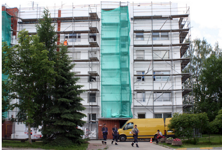
Dzīvojamā māja Lāčplēša ielā 23a, Lielvārdē.

Minētie darbi tiek veikti, lai uzlabotu ēkas siltumnoturību. Lēmums par mājas renovāciju tika pieņemts dzīvokļu īpašnieku kopsapulcē. Veicot daudzdzīvokļu dzīvojamās mājas siltināšanu, būtiski samazināsies apkures izmaksas. Tai pašā laikā tiks uzlabots mājas vizuālais izskats, kā arī palielināsies dzīvokļu vērtība.