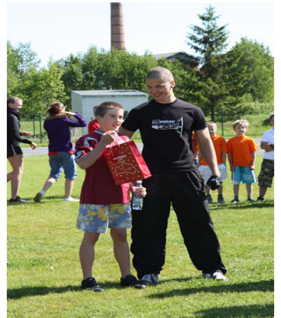
Balvas saņem centīgākie.

Pēc spēku samērošanas ir labi dalīties pieredzē.