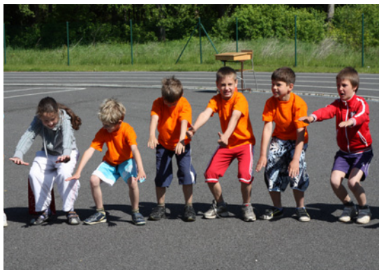
Mūsu komanda grib uzvarēt!