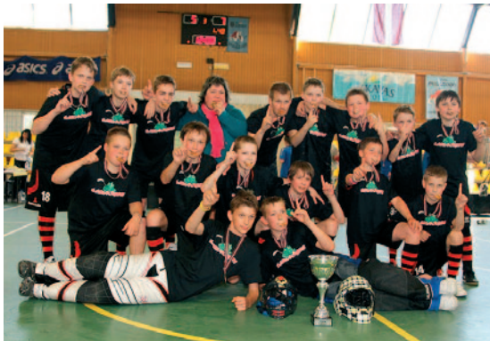
ZU-12 puīši – Latvijas čempioni savā vecuma grupā.