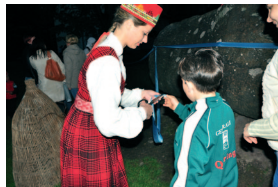
Zilās cerību lentas gabaliņš – ikvienam sava sapņa piepildījuma alkstošajam.

Klausoties mīlas dzejā, Māriņas Zaļkalniņas melodiskajā gītārspēlē un vokālā ansambļa „Akcents” meiteņu dzidrajās balsīs, radās gandrīz maģiska apjaušana, ka sapņa piepildījums ir tepat līdzās, gandrīz ar roku aizsniedzams, vajag tikai pavisam nedaudz... Un debesīs kopīgi laistie zīlie lampioni apliecināja – viss notiks, viss būs labi, kamēr vien ticēsim un sapņosim.