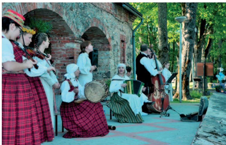
Pasākuma ieskandināja folkloras kopas „Liepu laipa” dzīvespriecīgais priekšnesums.

„Pats zilais zirgs jau ir zils brīnumš, un, kas ar viņu jā, – redz zilus brīnumus. Parasti gan viņš laižot sev tuvumā un atļaujot ar sevi jāt tikai dzejniekiem, bet ja jums ir saujiņa zilu auzu ... Vai jums ir saujiņa zilu auzu?” (Imants Ziedonis)