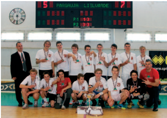
ZU-16 puīši – bronzas medaļu ieguvēji.