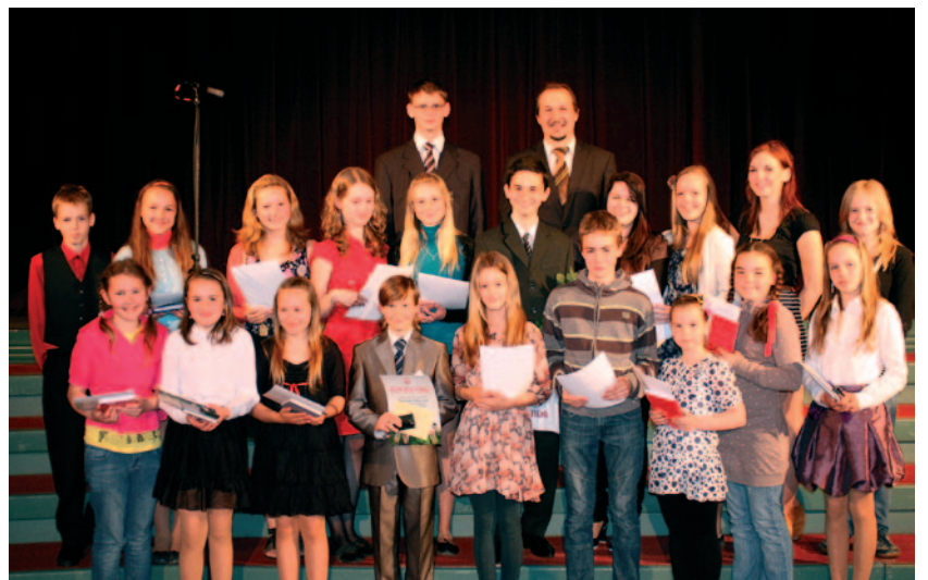
Olimpiāžu un konkursu uzvarētāji no Lielvārdes pamatskolas.