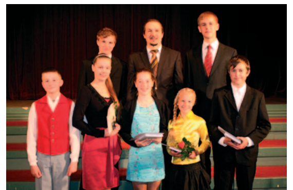
Lielvārdes Mūzikas skolas audzēkņi ar domes priekšsēdētāju.