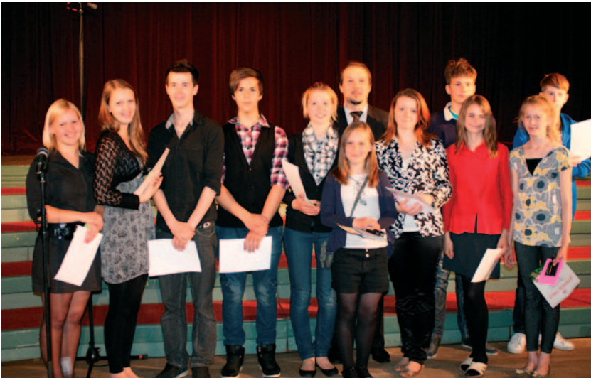
Jumpravas vidusskolas olimpiāžu un konkursu uzvarētāji ar domes priekšsēdētāju.