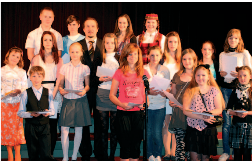
Lielvārdes Edgara Kauliņa vidusskolas labākie.

PAR SARŪPĒTĀJĀM BALVĀM PEDAGOGIEM UN SKOLĒNIEM PALDIES