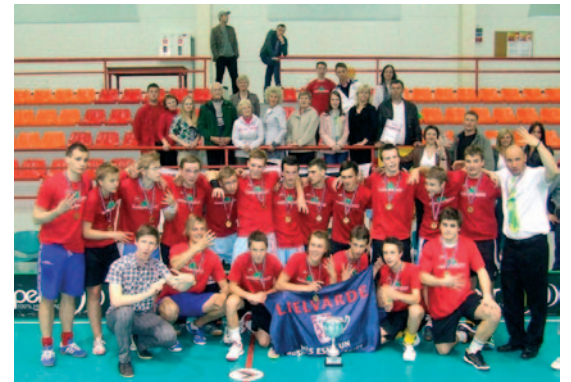
ZU-18 puīši – Latvijas čempioni ceturto gadu pēc kārtas.

2011./2012. gada sezona bijusi veiksmīga mūsu mazajiem florbolistiem.