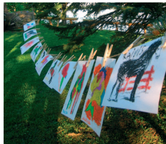
Uzzīmētie sapņu zirgi.