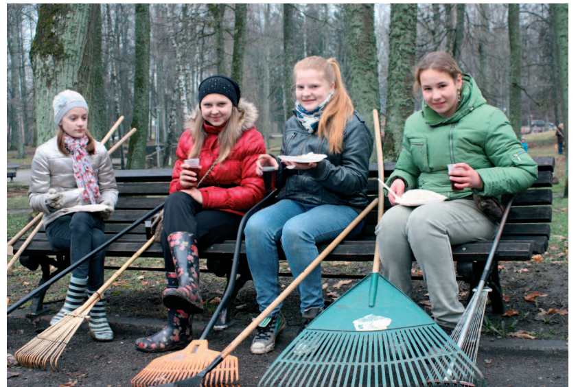
Lielvārdes pamatskolas skolēni pēc padarītā darba pelnījuši gardas pusdienas.

Lielvārdē Lielās talkas darbi sākās jau piektdien, kad talkā devās Lielvārdes E. Kauliņa vidusskolas un Lielvārdes pamatskolas skolēni un pedagogi. Tradicionālo gardo talkas biežputru bija pagatavojušas Lielvārdes pamatskolas pavāres. Gan pašvaldības darbiniekiem, gan pavārēm bija liels prieks, ka tā tika notiesāta ar lielisku apetīti.