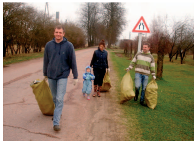
Biedrība „Dzelmju attīstībai” devusies talkā.

Tikmēr Jumpravā Svētā Jāņa ev. lut. baznīcas draudze un Jumpravas jauktais koris sakopa baznīcas apkārtni, Dzelmju iedzīvotāji tīrīja Daugavas krastu, biedrība „Dzelmju attīstībai” strādāja Dzelmju ciema teritorijā un baznīcas apkārtnē, SIA „Māris & Co” darbinieki kopa Dzelmju teritoriju, kā arī stāvlaukumu pie Daugavas, Latvijas Sarkanā Krusta Jumpravas nodaļa talkoja Jumpravas parka sporta laukumā un ap diķi, Vidus un Dzelzceļa ielā, kā arī tīrīja estrādes meža ceļus, Jumpravas speciālā internātpamatskola tīrīja ceļmalas no Lēdmanes–Krapes ceļa sazarojuma līdz Jumpravas centram, Jumpravas vidusskola strādāja skolas apkārtnē un sakopa ceļmalu no Dzelmēm līdz Jumpravai.