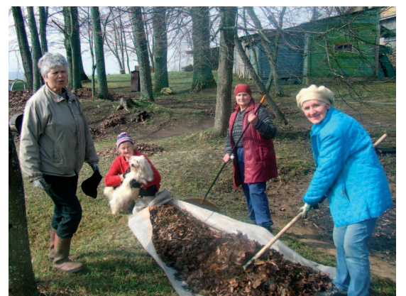
Lielvārdes latviešu biedrība sakopa atpūtas zonu pie Daugavas. Beatas Kempeles foto, vairāk foto – www.lielvarde.lv