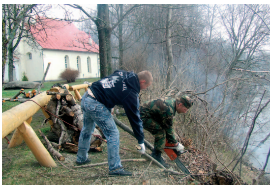
Pēc zemessargu un NBS Gaisa spēku talkošanas skats uz Daugavu no muzeja pagalma būs daudz iespaidīgāks.

Latvijas Administratīvo pārkāpumu kodeksa 179. pants nosaka, ka fiziskām personām par kūlas dedzināšanu var tikt uzlikts no 200 līdz 500 latu liels naudas sods, vainīgajai personai var tikt piemērots līdz 15 diennaktīm ilgs administratīvais arests.