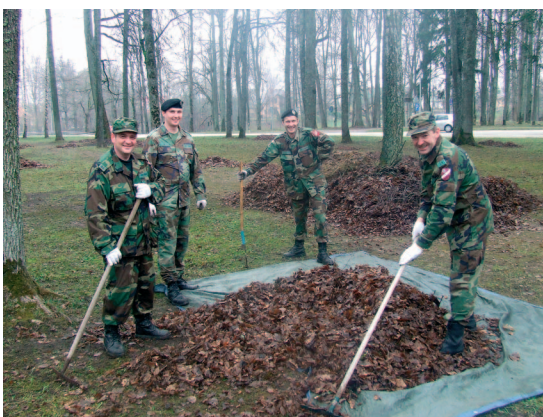
Zemessardzes 54. bataljona lielvārdieši talkā Rembates parkā.