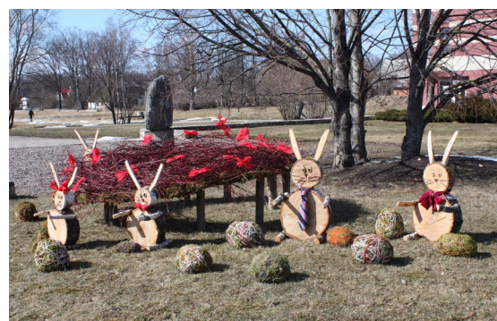
Zaķu ģimene Lielvārdes centra laukumā.