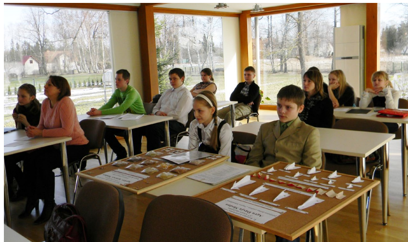
Jaunie pētnieki uzmanīgi klausās priekšlasījumus.

Lielvārdes vidusskolas ķīmijas skolotāja, jauno dabas pētnieku kluba vadītāja