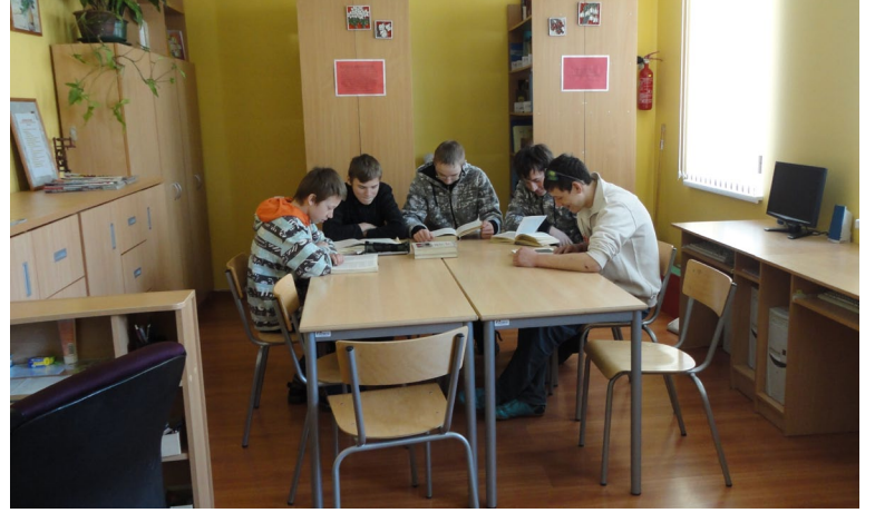
Bērni pēc stundām labprāt apmeklē Jumpravas bibliotēku.

Medicīniskā aprūpe ir par brīvu, tiek apzināts katra izglītojamā veselības stāvoklis. Skolotāji ņem vērā ģimenes ārstu norādījumus un skolas ārstes ieteikumus. Katru gadu skolēni tiek vesti uz pārbaudi pie zobārsta, reizi