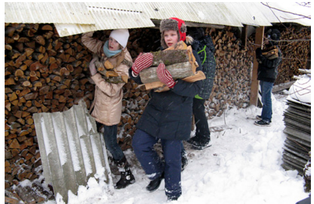
Labdarības nedēļā skolēni nesa un skaldīja malku, šķūrēja sniegu.

Sekoja Jumpravas skolēnu labie darbi otrdien, trešdien un ceturtdien, kad pēc mācībām skolēni devās pie vientuļiem Jumpravas pagasta iedzīvotājiem un palīdzēja dažādos saimnieciskos darbos: skolēni nesa un skaldīja malku, šķūrēja sniegu, tīrīja pagalmus un palīdzēja ļaudīm citos smagos darbos, kurus viņiem vieniem būtu krietni grūtāk vai pat neiespējami paveikt. Darbos tiešā veidā iesaistījās apmēram 50 skolēni. Paralēli labajiem darbiem skolēni sanesa pārtikas