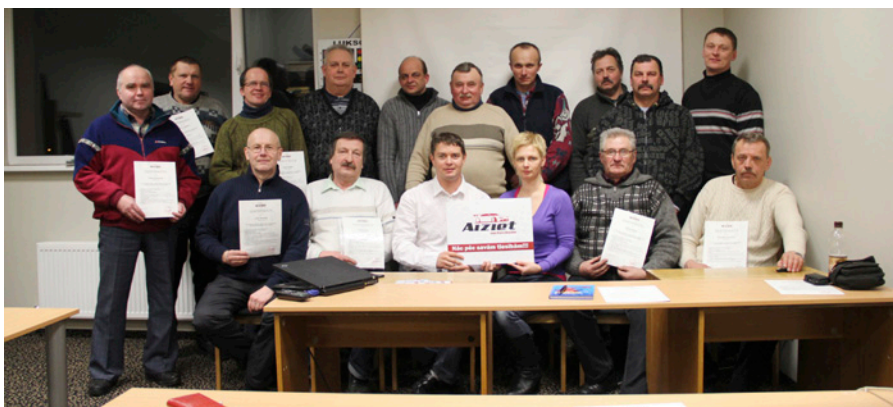
Pirmais izlaidums SIA «Zīgy» Autoskolā.

Bet viņš spēle palikusi kā nerealizēts sapnis. Tomēr noteikti devusi rādījumu, jo spēlēšanai 6 līdz 10 stundas dienā nepieciešama liela izturība un gribasspēks.