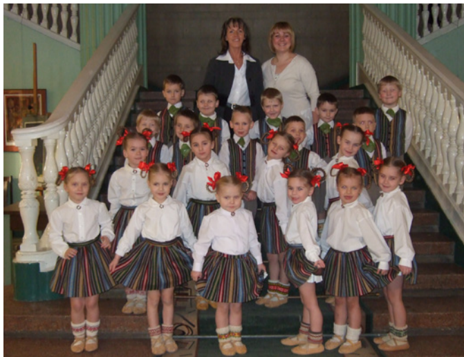
«Pūpoliša» piecgadīgo grupa VEF kultūras pilī.