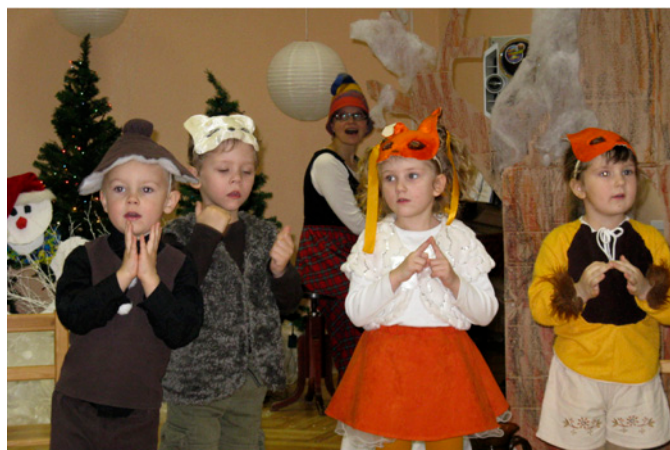
Grupiņas «Saulspuķes» bērni priecē skatītājus ar izrādi «Kraukšķītis».

Semināra noslēgumā viesiem bija iespēja iegriezties katrā grupiņā, lai redzētu, kā klājas jumpraviešu mazuļiem bērnodārzā.