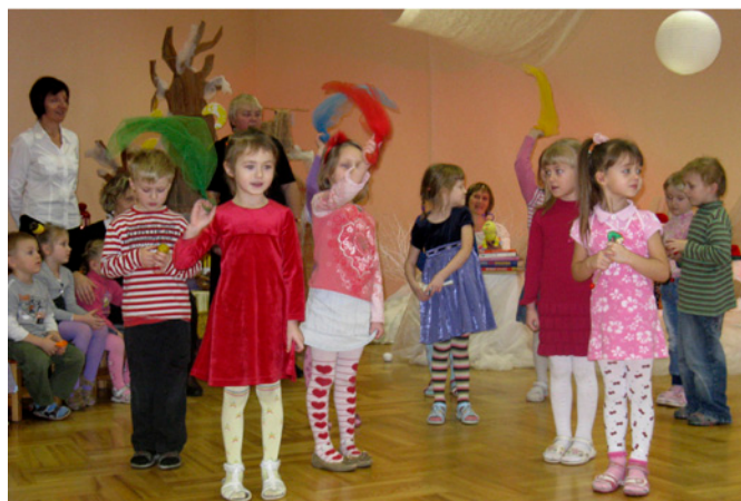
Dramaturģijas rotaļa ar lakatiem «Sauls, sals un vējš».