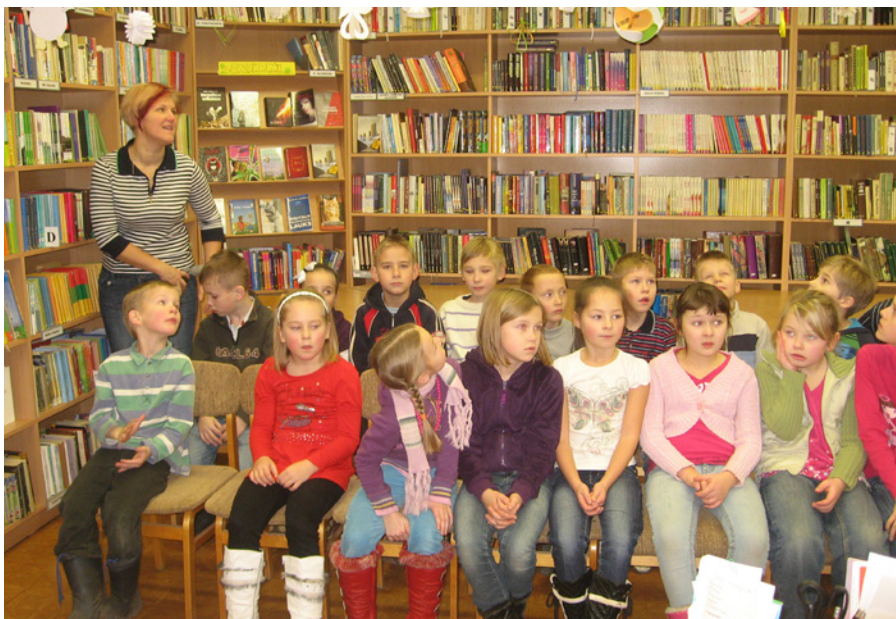
E. Kauliņa Lielvārdes vidusskolas 2.b klase Bērnu žūrijas noslēguma pasākumā bibliotēkā.