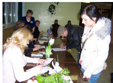
Tautas nobalsošana Lēdmanē.