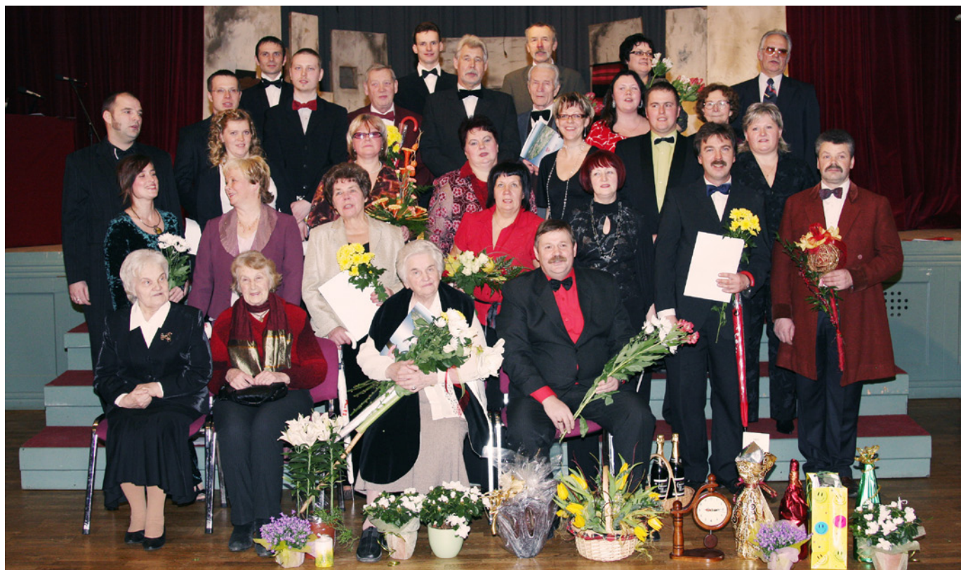
Lielvārdes Tautas teātris jau trešo reizi aicina skatītājus uz festivālu «Pie mums martā».

Tiksīmes martā! Būs ko skatīties, būs ko atcerēties un pārdomāt. ❖