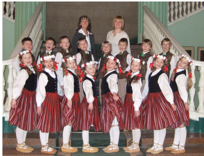
«Pūpoliša» 3.—4. klašu grupa.