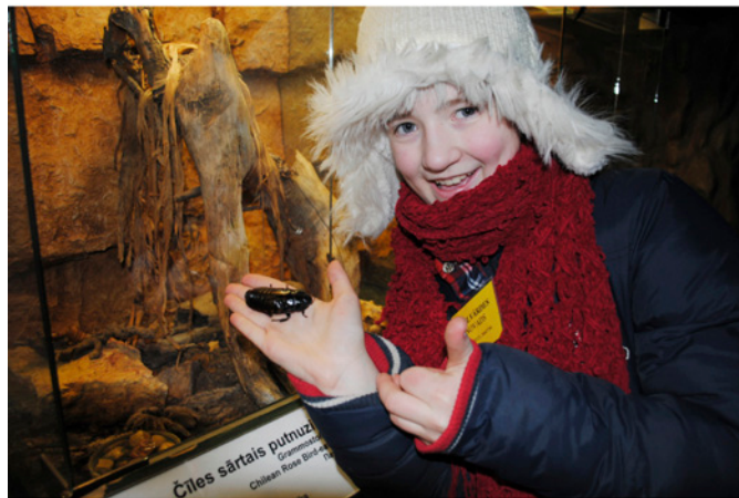
Zoodārzā bija atļauts paturēt rokā milzu prusaku, un leva nenobijās.

Kauliņa Lielvārdes vidusskolas un Lielvārdes pamatskolas, kas piedalījās ekskursijā, joprojām ir pozitīvu emociju pārņemti, daļas savā priekā ar klasesbiedriem un skolotājiem, rādot Saules muzejā izkrāsotās saulītes, stāstot par piedzīvoto Rīgas Zooloģiskajā dārzā. Daudzi skolēni lepojas ar to, ka projekta ietvaros Lielvārdes novada bērni tika filmēti Latvijas televīzijas ziņu raidījumam.