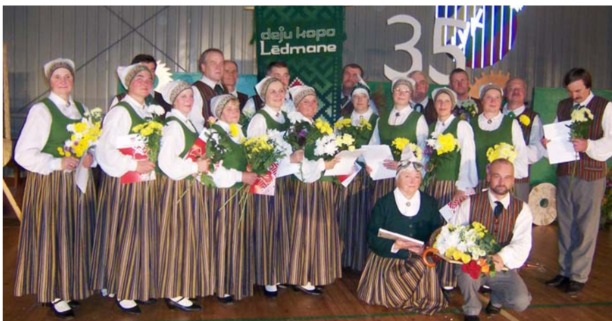
Senioru deju kopa «Lēdmane» pēc sava 35 gadu jubilejas koncerta.

Gandrīz divu stundu garumā ilgušais koncerts paskrēja kā viens mirklis, jo dejotāju spriganums, veiklība, skaistie deju raksti skatītājus turēja savā varā. Tik tiešām, bija ko redzēt un baudīt. Neticami, ka seniori