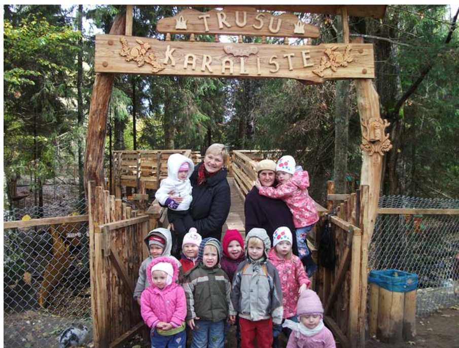
Paši mazākie Lēdmanes Trušu karalisti.