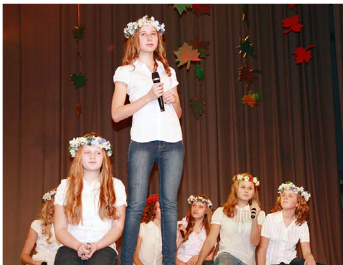
Vokālās studijas «Mikauši» priekšnesums.