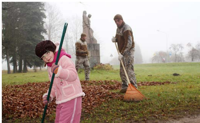
Talkā pie 1905. gada pieminekļa Lielvārdē.

Tas ir labas prakses piemērs, kuram varētu sekot arī mūsu Lielvārdes novada uzņēmumi, ņemot savā šefībā kādu noteiktu novada objektu. ❖