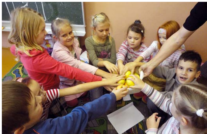
«Skolas auglis» Lielvārdes pamatskolā.

Lielvārdes novada pašvaldības Projektu un attīstības nodaļa