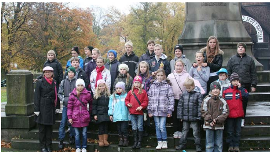
«Rītupītes» kolektīvs pie «Skansen» dabas parka.

Stokholmā mums bija brīvs laiks, lai apmeklētu muzejus pēc savām interesēm. Salīdzinot ar marta mēnesi, kad pirmo reizi bijām Stokholmā, laiks bija silts un koku lapas bija pašā