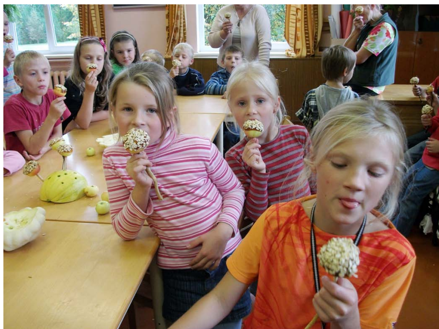
2. klases cienasts — gardie cukurāboli.