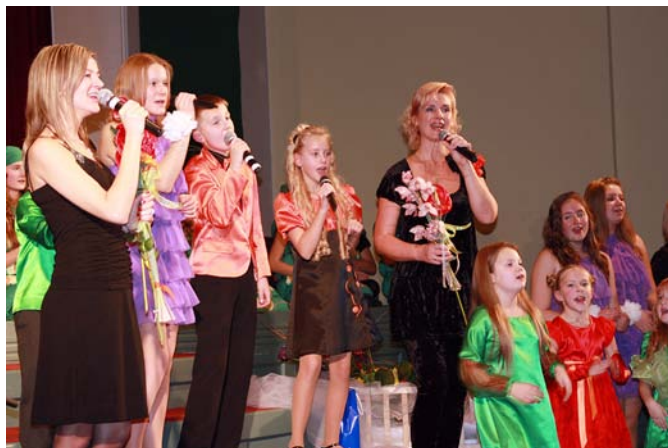
Dziesma «Dzīvo tūlīt» vieno visus koncerta dalībniekus.