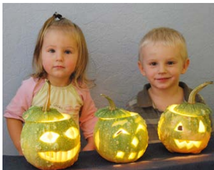
Māmiņu klubīņā bērniem par prieku māmiņas izgrebušas Halovīna ķirbjus.

Māmiņu klubīņš tiek katru pirmienu plkst. 10.00.