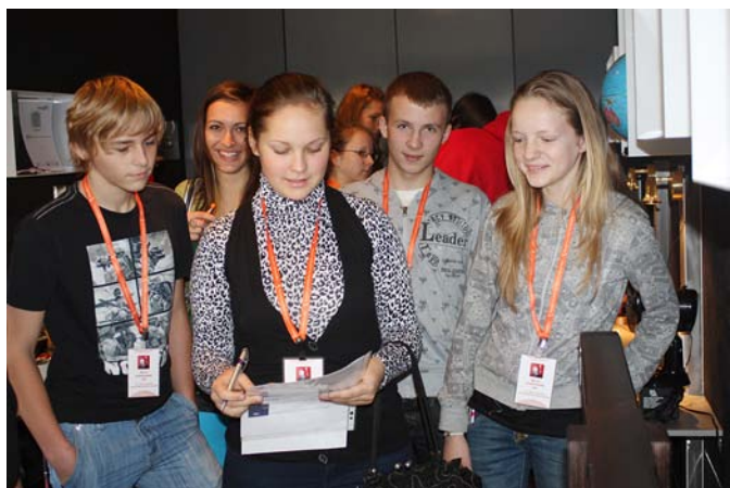
Uzdevumi komandām sagatavoti arī «Inovāciju busiņā».