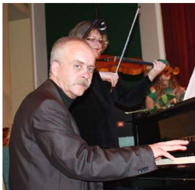
Pie klavierēm komponists Modris Krūmiņš.

Ir ļoti patīkami redzēt radošu un talantīgu cilvēku, kurš saglabājis savu vienkāršību, pret sevi izturas nedaudz ironiski, bet pret dzīvi — filozofiski.