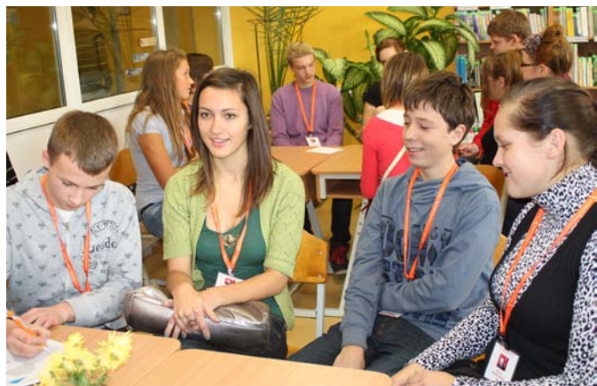
Apvienotā komanda iepazīstas un gatavojas darbam.

«Bioloģijas laboratorijā» skolēni krāsoja un mikroskopā mērija savas personīgās šūnas, ar sensoru palīdzību noteica, kas kopīgs cilvēkam un raugam.