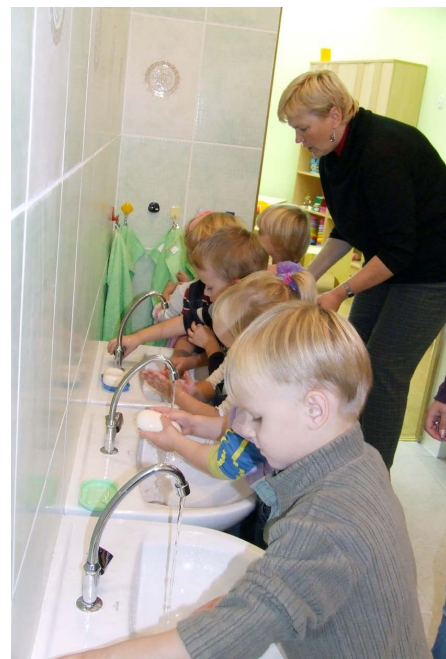
Jāmazgā rokas pirms pusdienām! Ar prieku!

Aicinām vecākus, kuru bērniem ir grūtības iejusties grupās ar lielu bērnu skaitu, izvērtēt iespēju bērnam izglītoties Kaibalā.» ❖