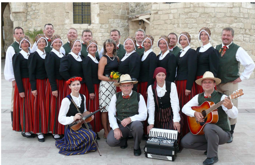
«Vēji» un kapela «Klabada».

Šogad festivālā piedalījās 12 grupas: no Slovākijas, Slovēnijas, Horvātijas, Ungārijas, Ukrainas, Kipras armēņu kolektīvs, Grieķijas, vairākas grupas no Kipras. Mēs, deju kolektīvs «Vēji», šo dienviņu valstu grupā bijām kā atsvaidinošā vēja dvesma, kas ar savu stāju un raito dejas soli godam pārstāvēja