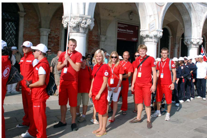
Sacensību atklāšanas parādē Venēcijā.

Nākamgad sacensības notiks Īrijā, kurās noteikti atkal pārstāvēsim Latviju. ❖