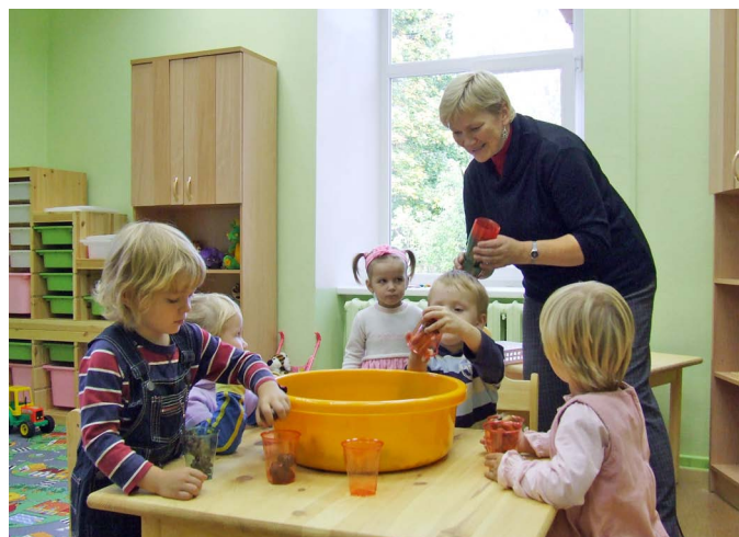
Kastaņi un zīles — lieliski materiāli radošam darbam.