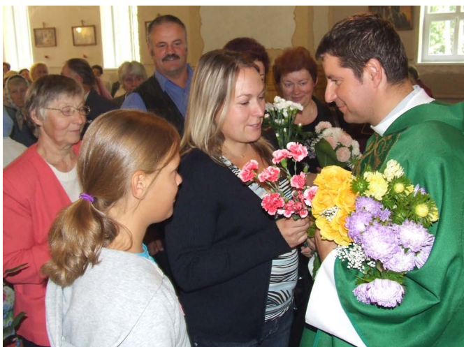
Lielvārdiešu pateicība un ziedi savam priesterim.

Priesteri, lai mūsu dotā ceļamaize un labie ceļā vārdi stiprina Jūs tālākajā kalpošanas ceļā. Paldies par pašai dziedzību, nesavtīgo kalpošanu un cilvēkiem dāvāto sirds siltumu!