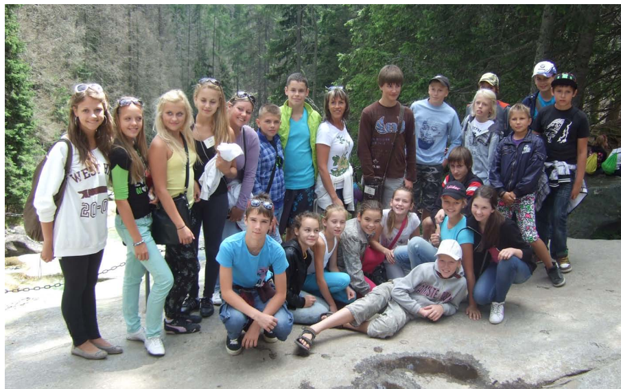
«Pūpolītis» Augstajos Tattros.

10. augustā sešos no rīta devāmies tālajā ceļā cauri Lietuvai uz Poliju, kur Krakovā bija mūsu pirmās naktsmājas. Nākamajā rītā devāmies uz Slovākiju. Augstie Tatri pārsteidza mūs ar savu varenumu. Lai