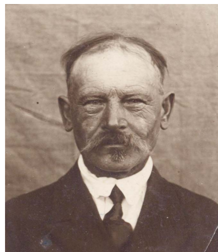
Jānis Jundass (1869—1956) 20. gadsimta 20.—30. gados.