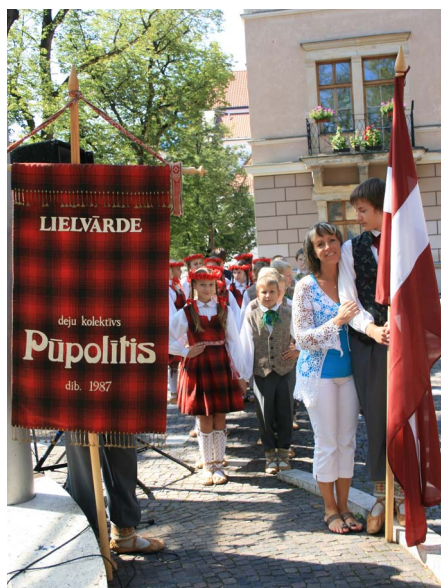
Levočā — gatavojoties festivāla atklāšanas gājienam.

Ja arī Tu gribi padarīt savu dzīvi interesantāku, nāc dejojot «Pūpolīti!» ❖