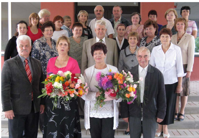
Jumpravas vidusskolas skolotāji un tehniekie darbinieki 1. septembrī.