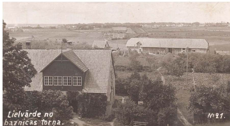
Kraujas 20. gadsimta 20. gadu beigās.

pārstāv kungu, kurš dzīvojis aiz baznīcas jaunuzceltajā Lielvārdes pilī, nelamās, ka nepilda savu pienākumu pret kungu kā nākas... Cilvēki nāca iekšā, ārā. Teikšu godīgi — tas laiks man nepatika, jo nebija cilvēka, kas mani patiesi mīlētu, kuram es būtu patvērums.