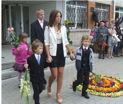
Lielvārdes vidusskolas 12. klases skolēni ievēd pirmklasniekus.