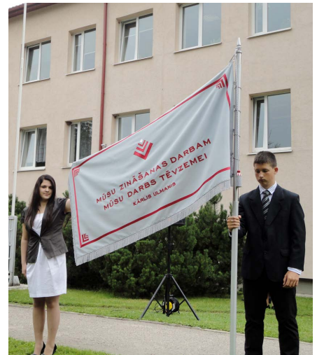
Jaunais Lielvārdes pamatskolas karogs.

Arī lēdmanieši precīgi par nosiltināto skolu, sporta halli un atjaunoto divslīpu jumtu. Pateicoties sadarbībai ar LAF, skolotāju