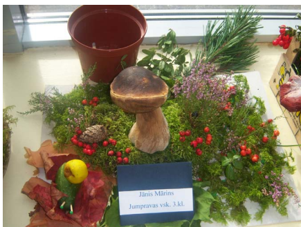
Jāņa Mārīna, Jumpravas vidusskolas 3. klases skolnieka, kompozīcija (2010). Spainīti apmeklētāji meta zīles, tā balsojot par sev tikamo veidojumu.

«8. SĒŅU IZSTĀDE – 2011» Lielvārdes kultūras namā aicina apmeklētājus no 11. līdz 13. septembrim.