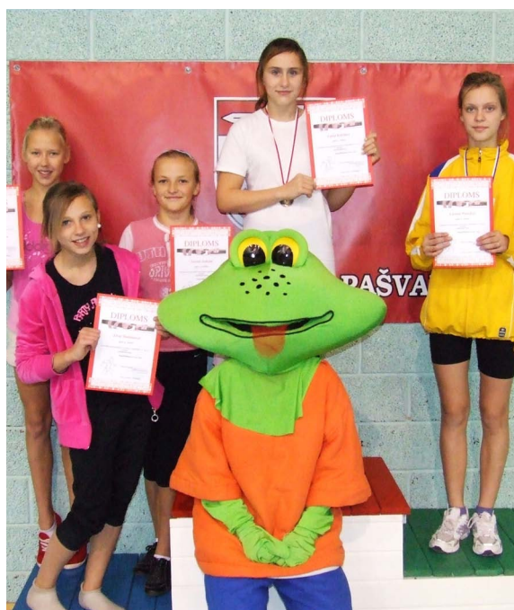
Lielvārdes novada atklāto sacensību vieglatlētiku «Lielvārde-2010» uzvarētājas.

Informācija par nodarbību laikiem Lielvārdes novada sporta centrā, tālr. 29180320.