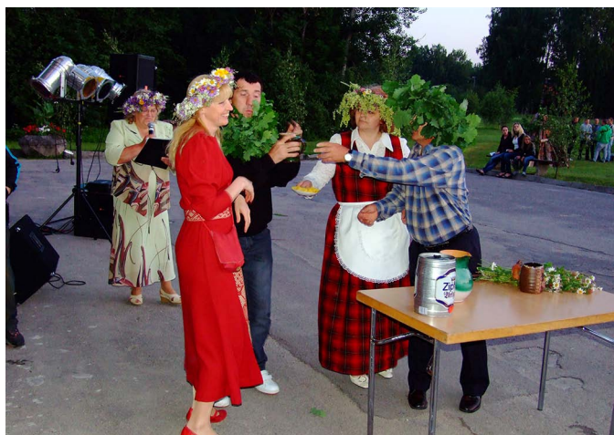
Lai sagaidītu saullēktu, lēdmaniešiem jāstiprinās ar sieru un alu.

Šajā vakarā līgotājus priecēja Lēdmanes amatieru teātris ar nelielu uzvedumu no Dreslera pantīņiem «Sprukstiņa līgosvētki» un Dāmu deju kopa. Saulei pazūdot aiz apvāršņa, tiek iedegta Jāņuguns, kas dega līdz rītam. Latvisko tradīciju kopšanā, īpaši deju soļu iemaņā, lai piesaistītu visus līgotājus, pie mums viesojās Ogres danču kluba pārstāvji. Prieks, ka šos deju soļus iemēģināja ļoti daudzi jaunieši un bērni. Visas nakts garumā spēlēja grupa «Vīzija» un izturīgākie līgotāji sagaidīja burvīgu saullēktu. ❖