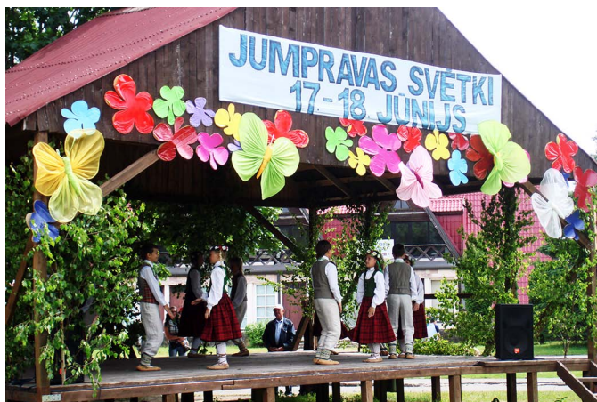
Svētku koncertā Jumpravā uzstājas «Ritupīte».