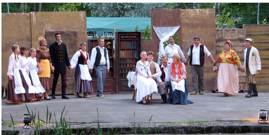
Rūdolfa Blaumaņa dziesmu spēle «Trīnes grēki» Līgo dienā Spīdaldas salīnā.