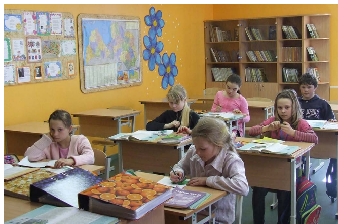
Kaibalas skolas mājīgās klases ir arī moderni aprīkotas.

Zālē ieklāts oša parkets, bet aiz skatuves atrodas ērtas garderobes un dušas telpas ar apsildāmu grīdu. Turklāt visas sanitārās telpas ir piemērotas bērniem ar īpašām vajadzībām. Skolā ir arī pacelājs, ar kura palīdzību pa trepēm var uzbraukt invalīdu ratiņos.