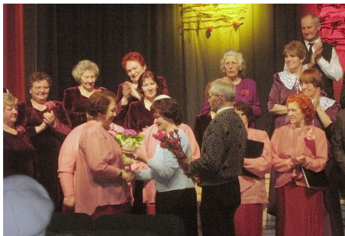
1. aprīļa sarīkojuma noslēgums Jumpravā.