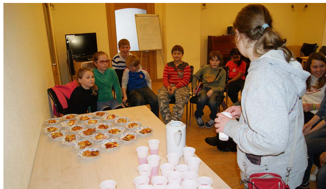
Bērni paši iemācījušies pagatavot kādu gardumu un saklāt galdu.

Paldies Dienas centra darbinieclēm un «Award» brīvprātīgo kustības dalībnieclēm no Edgara Kauliņa Lielvārdes vidusskolas, kuras ir atsāucīgas, palīdzot projekta veiksmīgā īstenošanā. ❖