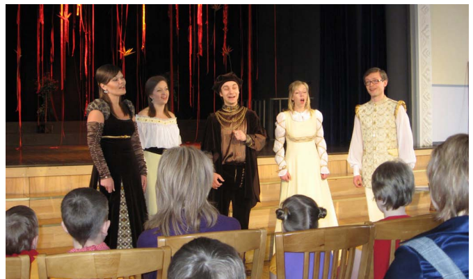
Konkursā uzstājas Jumpravas kultūras nama ansamblis «Modus Vivendi».