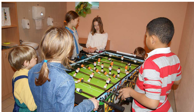
Galda futbols ir viena no bērnu populārākajām spēlēm.

Nodarbībās, kas notiek otrdienās un trešdienās no plkst. 16.00 līdz 18.00 piedalās pat līdz 28 bērniem. Tāpēc darbiņi tiek dalīti un bieži ir