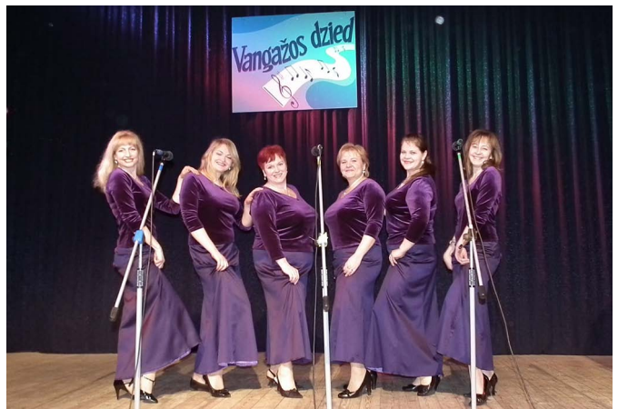
Lēdmanes sieviešu vokālais ansamblis «Stari».