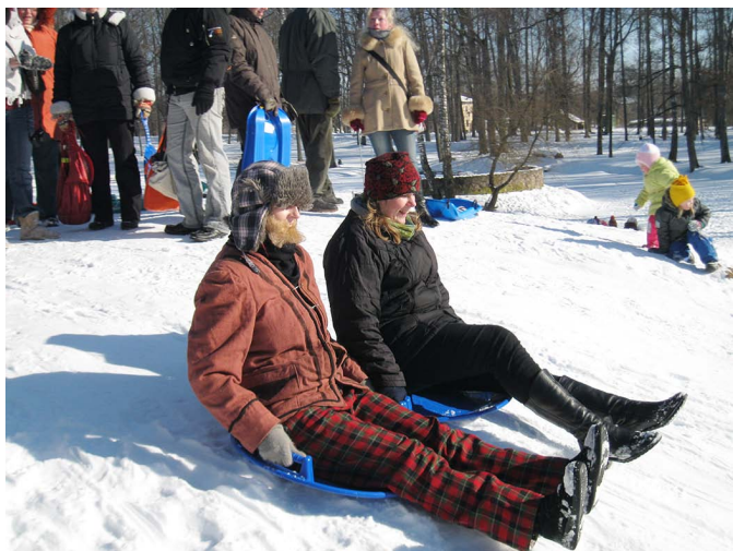
Jautrais Meteņu nobrauciens.

modināmas. Tāda ir arī Meteņa diena, kas iezīmē gaismas uzvaru pār tumsu un ir svinama kā jautri svētki ar rotaļām, dziesmām, vizināšanos no kalniņa un ragavu apmešanos.