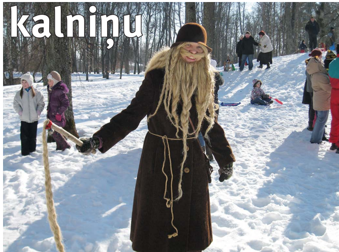
Visu lietu kārtību uzmana pats Meteņtēvs.

Mūsu senču laika ritumu iezīmēja gadskārtēji svētki. Lielākos no tiem — Ziemassvētkus un Jāņus noteica saules ceļa pagriezienu punkti. Tos svētiņam joprojām, bet mazākās svinamās dienas bieži ir pagaisušas un no jauna