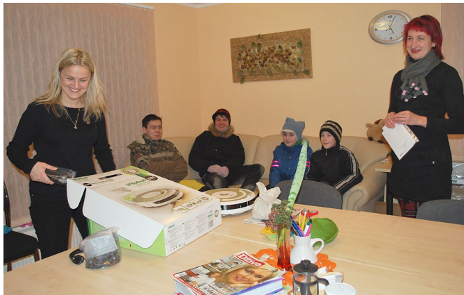
Prieks apskatīt jauno iRobotu — puteklusūcēju.

Esam priecīgi, ka esam laimējuši iRobotu un pateicamies visiem balsotājiem un tiem, kas atbalstīja mūsu piedalīšanos iRobota vēstulju konkursā.