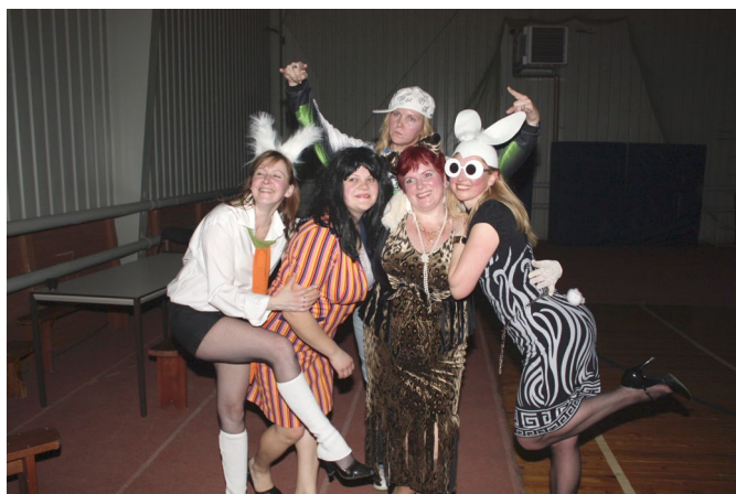
Ar Lēdmanes zaķiem karnevālā.