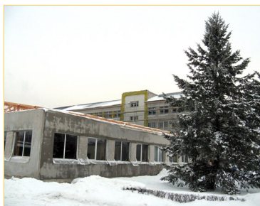
Siltināšanas darbi Jumpravas vidusskolā.

Neskatoties uz sniegotu ziemu, turpinās energoefektivitātes paaugstināšanas darbi 3 novada skolās — tiek izbūvētas divslīpju jumtu konstrukcijas Jumpravas vidusskolā un Lēdmanes pamatskolā. Ar būvfirmu PS «RBSSKALS Būvsaibiedrība & STARBAG» noslēgta vienošanās par termiņa pagarinājumu. Siltināšanas darbi jāpabeidz līdz š.g. 18. jūnijam.