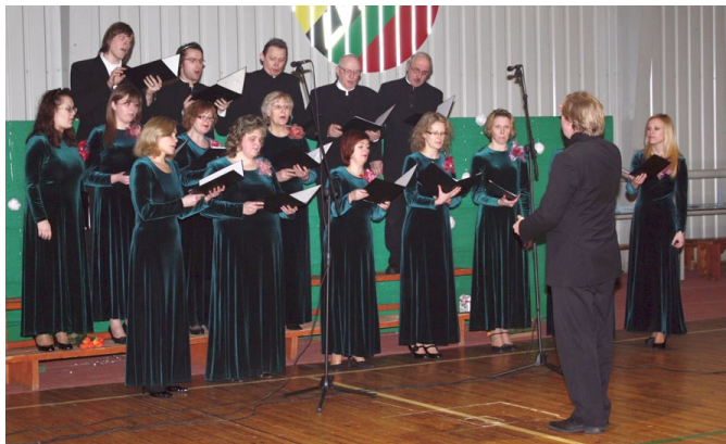
Uzstājas Jumpravas jauktais koris.