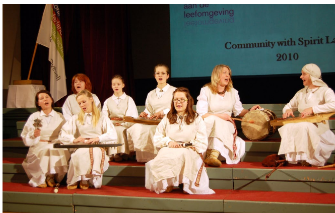
Ar skanīgu dziedāšanu visus iepriecināja Jumpravas folkloras draugu kopa «Liepu laipa».