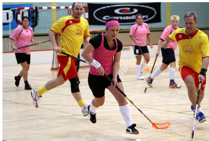
«Smilšukastes» cīņā ar «Cielaviņas armiju».

8. janvārī Lielvārdē norisinājās kārtējais florbola vecmeistaru posms, kurā teicami nospēlēja arī mūsu «Smilšukastes». Četrās spēlēs — četras uzvaras! Malači! Šobrīd komanda «Smilšukastes» pakāpusies uz 3. vietu čempionāta tabulā.