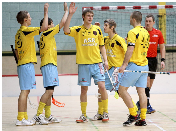
Lielvārdieši virslīgas spēlē ar «Telms/Energokomplekss» (Irlava), kurā ar 17:6 uzvarēja mūsējie.

Smaga uzvara ar rezultātu 3:4 tika izcīnīta Līgatnē, kur komandu «Līgatne/Latgranula» izdevās uzvarēt tikai pagarinājumā. Mājās jāspēlē vairs tikai 2 spēles — ar komandu «Talsi/Triobet» un «Lekrings». Izbrau-