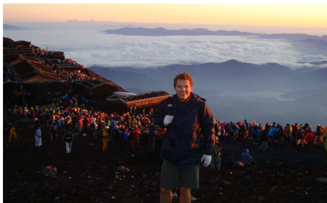
Saullēkts Fudži kalna virsotnē 2010. gada augustā.