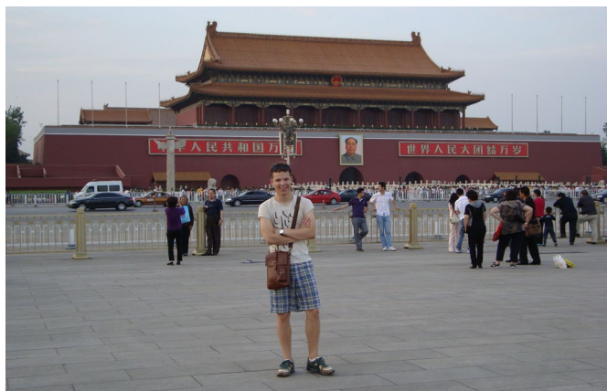
Pie Aizliegtās pilsētas Pekinā 2009. gada maijā.