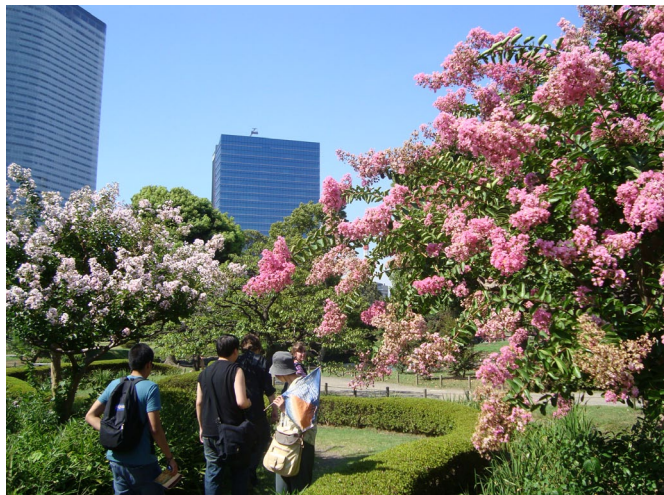
Tokijā ir daudz parku, tie ir kā oāzes starp debesskrāpjiem.