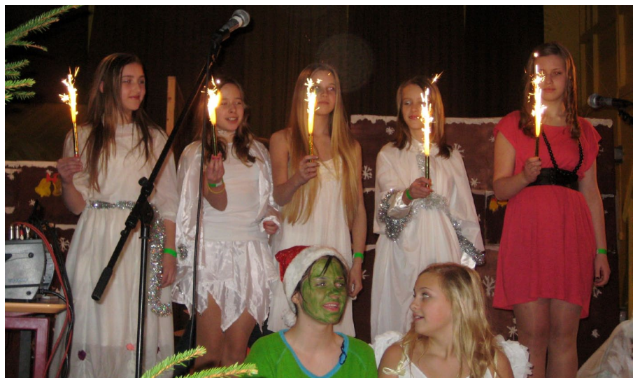
Ziemassvētku pasākumā «Rūķu dāvanas».

Kāds bija laiks no vieniem Ziemassvētkiem līdz otriem? To redzējam skolotājas Litas Lipskas foto ieskatā «Skolas dzīve gada laikā» — bagāts notikumiem, interesants, piepildīts, patriotisks, dziedošs, jautrs, sportisks, teatrāls, radošs. ❖