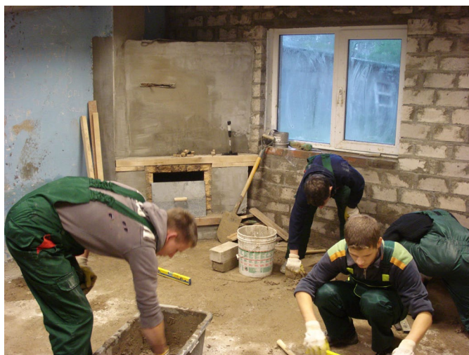
Jaunie remontstrādnieki apgūst būvdarbu pamatiemaņas.