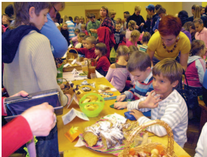
Mārtiņdienas tirdziņā 1.—4. klašu skolēni un viņu vecāki piedāvāja pašu gatavotus naškus.

10. novembra pēcpusdienā norisinājās 10.—12. klašu konkurss «Virtuālā ekskursija Latvijā». Izmantojot modernās tehnoloģijas, vidusskolēni aicināja žūrijas komisiju un skolas biedrus virtuālā ekskursijā pa skaistākajām Latvijas un Lielvārdes vietām. 1. vieta piešķirta 12.a klasei, kuru priekšnesums bija emocionāls iestudējums ar lepnumu par savu zemi un tās cilvēkiem.