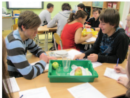
Laboratorijas darbs bioloģijā 12b. klasē.

Lielvārdes vidusskolā noslēdzies projekts «Kvalitatīvai dabaszinību apguvei atbilstošas materiālu bāzes nodrošināšana Edgara Kauļiņa Lielvārdes vidusskolā». Iegādāti pēdējie ķīmijas reaģenti un laboratorijas trauki gan ķīmijai, gan fizikai. Kopumā izveidotas četras modernas dabaszinību klases, nodrošināta materiāli tehniskā bāze, iegādāti mēbeļu komplekti un mācību aprīkojums. Skolēni, pedagogi un vecāki var būt gandarīti par mērķtiecīgu līdzekļu ieguldīšanu no ES ERAF (Eiropas Reģionālās Attīstības Fonds), valsts dotācijas un Lielvārdes pašvaldības finansālajiem līdzekļiem, par sakārtotas un mācīties stimulējošas vides radīšanu Lielvārdes vidusskolā. Projekts ir sasniegjis savu mērķi un skolēniem ir palielinājusies interese par eksaktajām zinātnēm, kas savukārt Latvijai nozīmēs kvalitatīvi izglītotus nākamās profesionāļus tehnoloģiju attīstības un inovāciju jomā. Projekts tika realizēts laikā no 11.05.2009 līdz 30.11.2010.