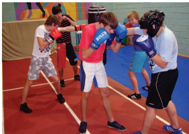
Boksa nodarbība Lielvārdes sporta centrā.

Nav jābaidās tiem, kuriem šo boksa pamatu pagaidām nav, katrs jaunpienācējs tiks mācīts, «sākot no ābece». Tāpat atkal par nodarbībām var interesēties pieaugušie, kuri tika noraidīti sākumā boksa maisu trūkuma dēļ. Nākotnē, ja būs pietiekams audzēkņu skaits, varētu domāt par dažādu vecuma grupu trenēšanu atsevišķi. Pie tam grupu varētu izveidot arī no 12—13 gadus veciem skolēniem, kuru nodarbību pamatā būtu fiziskā attīstība ar boksa elementiem un spēles. Tomēr jāsaprata, ka viss būs atkarīgs no pieprasījuma.