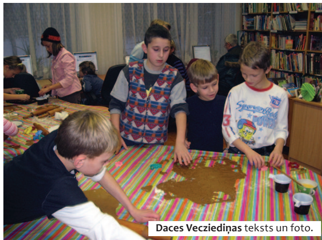
Daces Vecziediņas teksts un foto.