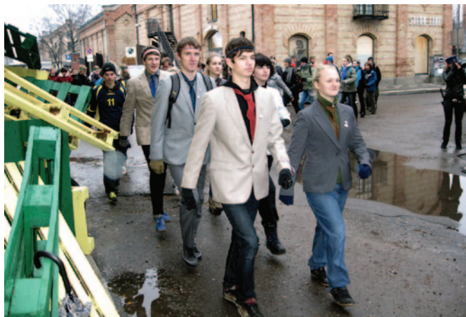
Lielvārdes vidusskolas 12.a klases komanda «Drošsirži» spēles «Rīgas hronikas» ierindas skatē 11. novembrī Rīgā.

11. novembris — Lāčplēša diena — bija saspringta devīto un divpadsmito klašu skolēniem. Devīto klašu skolēni piedalījās A. Pumpura Lielvārdes muzeja organizētajā Lāčplēša dienas pasākumā. Paldies muzeja darbiniekiem, NBS virsniekiem un karavīriem par aizraujošo un patriotisko pasākumu!