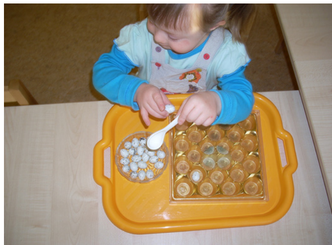
Vingrinām rociņas Montesori nodarbībā.