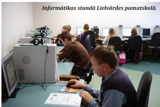
Informātikas stundā Lielvārdes pamatskolā.