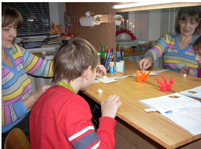
Nodarbības ar logopēdu palīdz raisīt valodu.