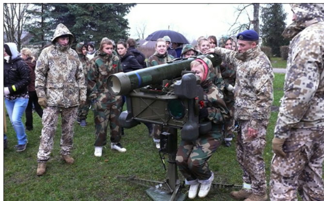
Iepazīšanās ar NBS ieročiem.