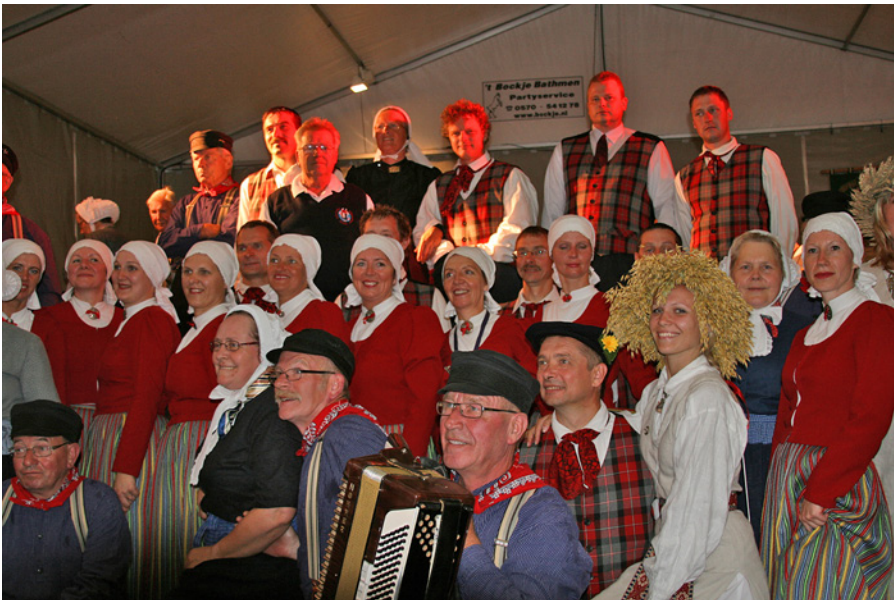
Jumpravas vidējās paaudzes deju kolektīvs «Saime» kopā ar draugiem Holandē.

Bet piektdiena mums atkal bija darba diena. Saposāmieš savos glītajos tautas tērpos un braucām uzstāties uz brīnišķīgo brīvdabas muzeju netālu no Oldenzāles, ar senatnīgām ēkām, skaistu parku un ziedu izstādi. Laiks bija brīnišķīgs un brīvā dabā