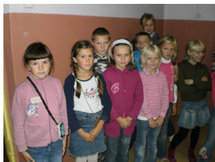
Jaunāko klašu skolēni gaida apbalvošanu.

Vēl tikai mirklis Dzejas mežā. Šoreiz tieši Raiņa dzimšanas dienā — 11. septembrī Rīgā, Nacionālajā teātrī, kur sarīkots 1. Lasišanas kongress bērniem. Vēl skaistais mirklis ar tikko izdoto Raiņa grāmatu Dzejoļi bērniem . Vēl pēdējais mirklis Dzejas dienu mežā un dzejas pasaulē... ❖