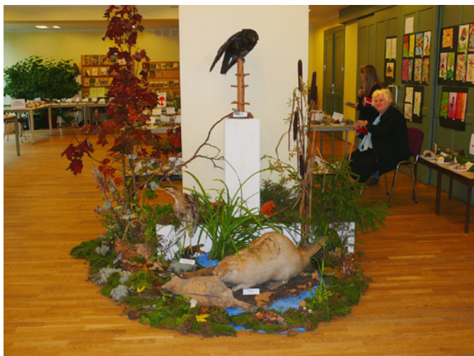
Izstādes centrā lielais dumpis negrib skatīties, kā bebrš grauž koku, bet krauklis kramšņina koka galotnē.