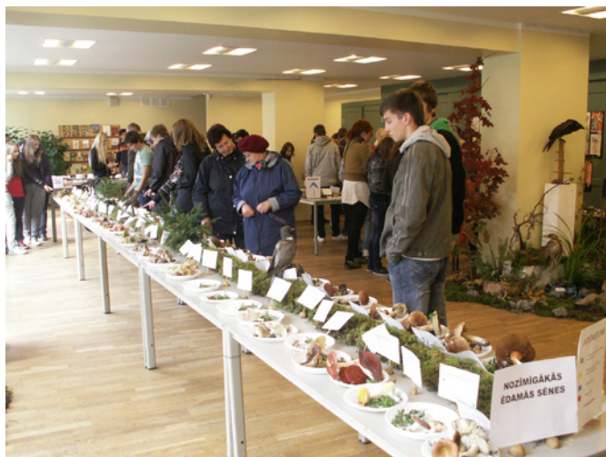
Apmeklētāji meklē pazīstamās sēnes, bet priecājas arī par sēņu pasaules daudzveidību.