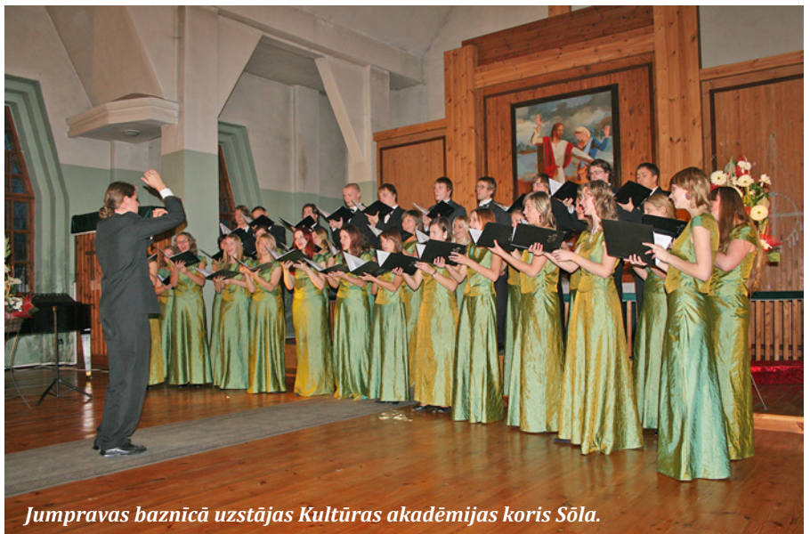
Jumpravas baznīcā uzstājas Kultūras akadēmijas koris Sōla.

6. novembrī plkst. 15.00 X Garīgās mūzikas mēneša izskaņā VSIA «Latvijas koncerti» un Lielvārdes novada pašvaldība dāvās brīnišķīgu iespēju Jumpravas baznīcā baudīt Latvijas Radio kora koncertu