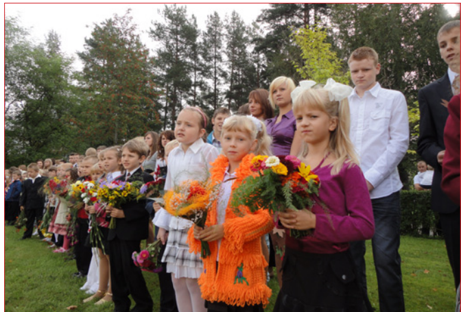
Pirmais septembris Lielvārdes pamatskolā.

Jaunajā mācību gadā novēlu darba prieku skolotājiem, prieku mācīties — skolēniem, pacietību un izturību — visiem mācību procesā iesaistītajiem! ❖