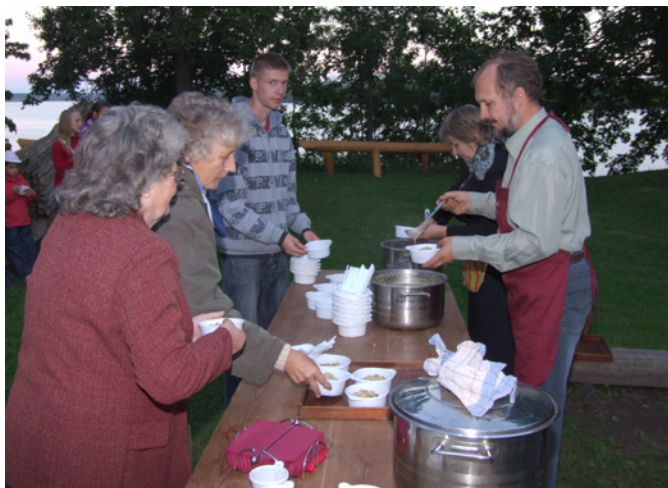
Tradicionālais cienasts — pelēkie zirņi.