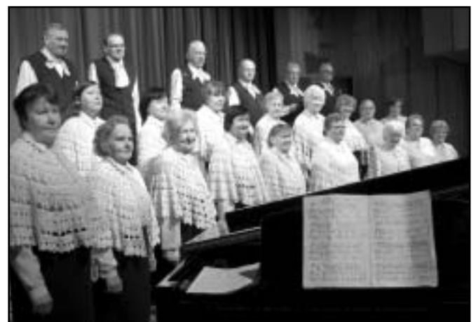
Uzstājas koris „Kamene”.

Paldies visiem kora dalībniekiem, diriģentiem un māju saimniekiem par kopīgi pavadīto brīnišķīgo atpūtas pēcpusdienu, sildot sirdis skaistās dziesmās un jaunizveidotā novada kaimiņu satikšanās priekā vienotā draudzībā! Paldies Lielvārdes novada vadībai par transportu korim „Kamene” un lielā autobusa vadītājam par laipno apkalpošanu! Paldies visiem, visiem baltās ziemas dienas brīnuma piemeklētājiem!