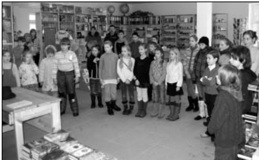
Akcijas "Sveiciens Lielvārdei" noslēgums „Jumavas grāmatnīcā”.

Paldies Lielvārdes skolām, bibliotēkai un novada domei par atbalstu un dalībnieku skubināšanu!