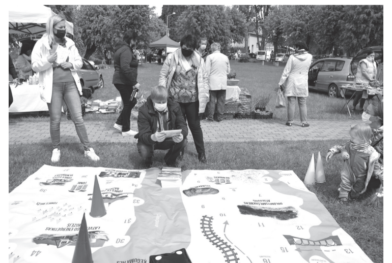
Foto: Kintija Sparāne-Tumaša Spēles laukumam izmantotās fotogrāfijas: Kristaps Selga,

Ilze Puriņa, Edgars Sparāns, Dana Vietniece, Ieva Vējone, Kintija Sparāne-Tumaša