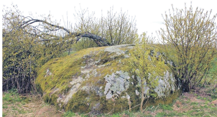
Sietiņu dižakmens (Velnakmens).