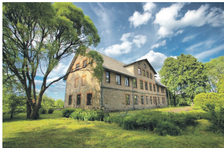
“Rembates pamatskola”.