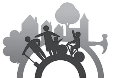
SABIEDRĪBA AR DVĒSELI - LATVIJA

7. martā Bauskas novada Īslīces pagastā norisinājās pašvaldību apvienības “Sabiedrība ar dvēseli – Latvija” 2019.gada konkursu noslēguma pasākums.