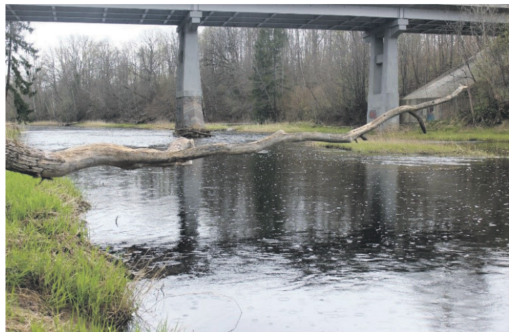
“Ogre upe”, Glāžšķūnis.

Ieva Vējone Projektu vadītāja ar specializāciju uzņēmējdarbības un tūrisma attīstībā