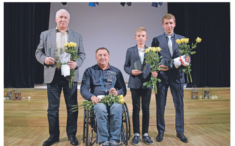
Keguma novada sporta laureāti.