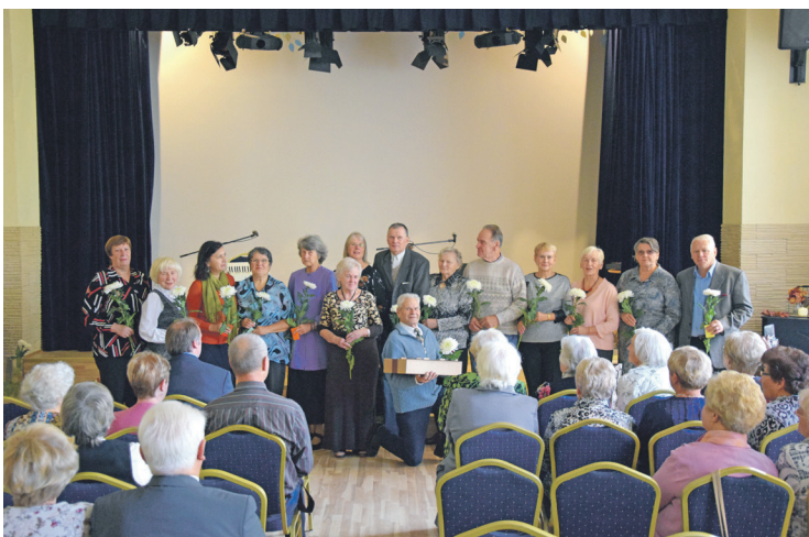
Aktīvākie pensionāru biedrības biedri.