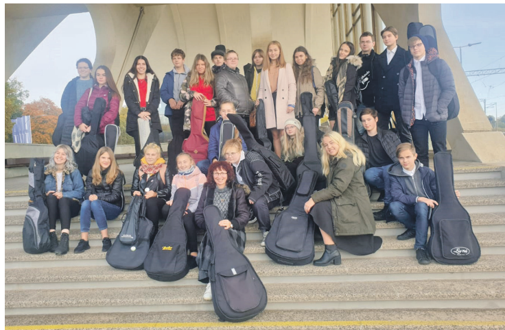
Ķeguma, Lielvārdes un Ogres ģitāristi pie Mākslas stacijas "Dubulti".

Katrs šāds ceļojums sniedz dažādu izjūtu gammu. Ir daudz nezināmā, bet tieši tas jau arī rada piedzīvojuma sajūtu.