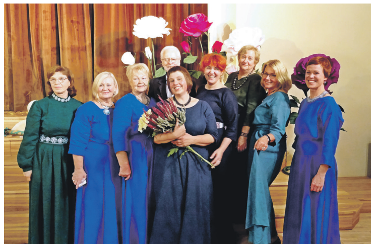
Dāmu deju kopas "Rasa" un kopas "Vecsaule" dalībnieces.

Rudens cilvēka dzīvē ir brieduma un vieduma laiks. Rudens dāvā bagātu ražu, ko ar savu darbu esam sarūpējuši. Nonākot savā dzīves rudenī esam iekrājuši bagātīgu zināšanu, prasmju un dzīves vieduma bagāžu. Rudentiņu mēs daudzīnām par zelta rudeni.