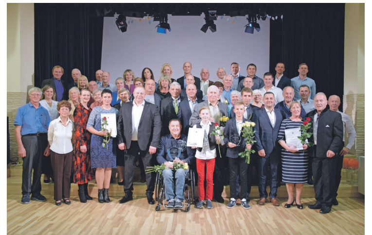
Keguma novada labākie sportisti.