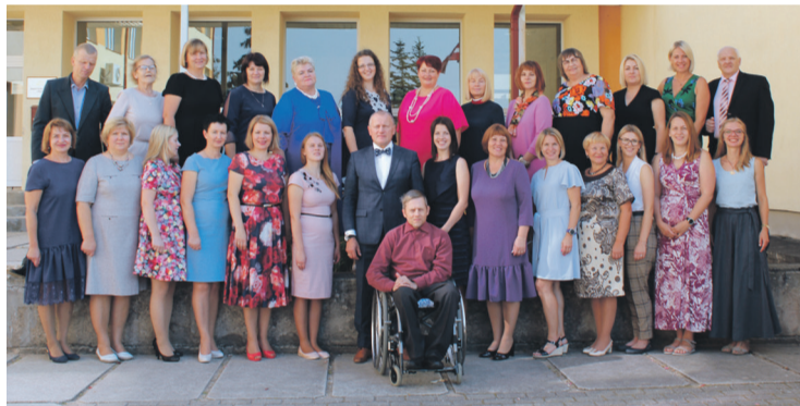
Ķeguma komercnovirziena vidusskolas skolotāju kolektīvs.

2019.gada 1.septembrī Ķeguma novada pašvaldības izglītība iestādēs jauno mācību gadu uzsāka 699 izglītojamie, tas ir par 27 izglītojamajiem vairāk nekā pērn. Ķeguma komercnovirziena vidusskolā mācās 324 skolēni, tajā skaitā 44 pirmklasnieki, Birzgaļes pamatskolā – 88 skolēni, tajā skaitā 9 pirmklasnieki, pirmsskolas iestādi "Gaismiņa" apmeklē 219 audzēkņi, bet pirmsskolas iestādi "Birztaļiņa" 68 audzēkņi.