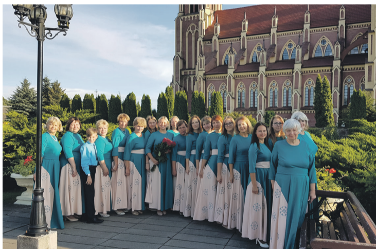
Gervjati ciematā pie Svētās Trīsvienības katoļu dievnama.

būtisks nosacījums – saimniecībā jāstrādā vienas ģimenes locekļiem.