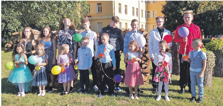
Mācību gadu Birzgaļes pamatskolā sāk 88 audzēkņi, tajā skaitā 9 pirmklasnieki.

Šogad jaunais mācību gads sākas 2.septembrī, kad no rīta pie izglītības iestādēm bija redzami saposušies bērni un jaunieši, skanēja čalas un smieklī. Līdzās pašiem mazākajiem satraukti un smaidīgi skolēnu vecāki, bet skolotāju rokās uzdziedēja skolēnu dāvatie rudens ziedi. Prieks un satraukums virmoja gaisā. Jaunais mācību gads ir sācies.