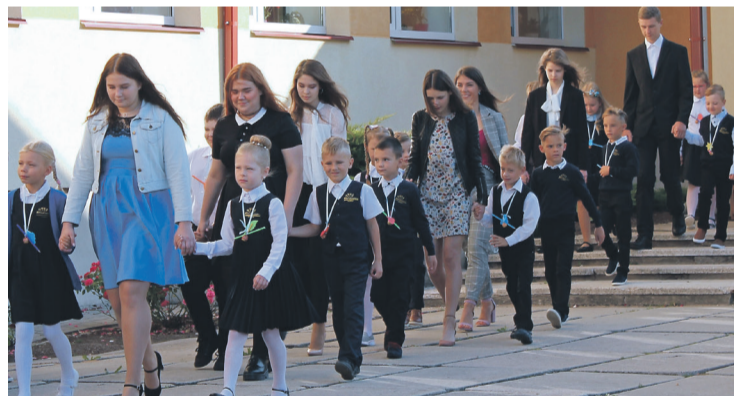
Ķegumā skolas gaitas sāk 44 pirmklasnieki.

Īpašs šis mācību gads arī Ķeguma komercnovirziena vidusskolai, kura gatavojas skolas akreditācijai.