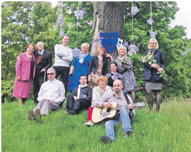
Strazdumuižas Drāmas un dzejas teātris.