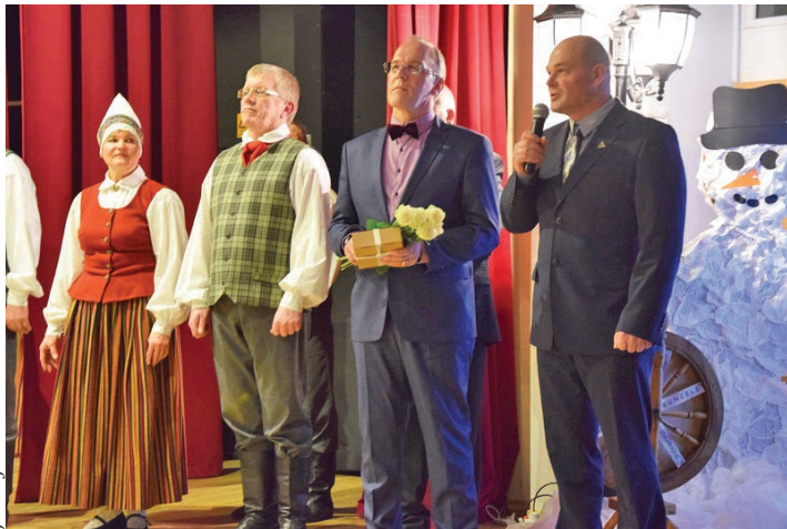
Ķeguma novada domes pārstāvji sveic kolektīvu jubilejā