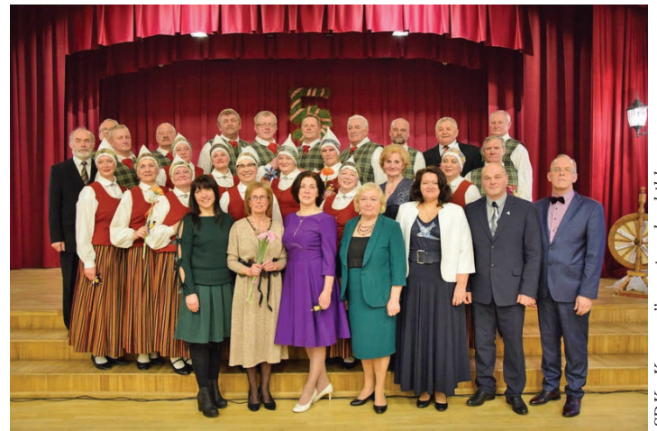
SDK „Ķegums” un viesu kopbilde