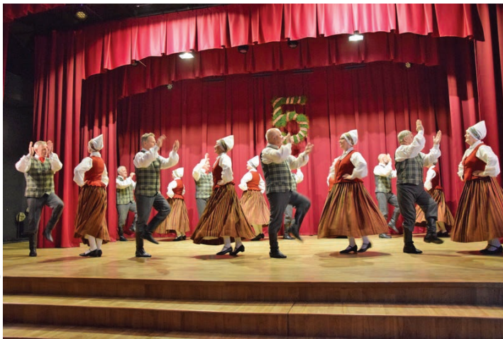
SDK „Ķegums” dalībnieki