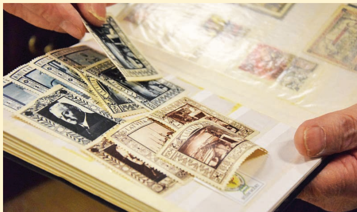
1939. gada pastmarkas ar Ķeguma HES

Informācija iegūta no Latvijas Pasta un papildināta ar Ķeguma novada domes sabiedrisko attiecību speciālistes tekstu.