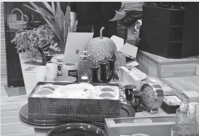
Rudens izsolē amestās mantas

Otrajā oktobra sestdienā Ķeguma tautas namā norisinājās biedrības Starptautiskais Soroptimistu klubs „Ogre-Ķegums” organizētā „Lielā Rudens izsole”.