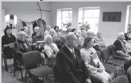
Dzejas vakara apmeklētāji un dzejnieki

Septembra pēdējā nedēļā Ķeguma novada bibliotēkā notika dzejas vakars „Mans domu pavadēns...”