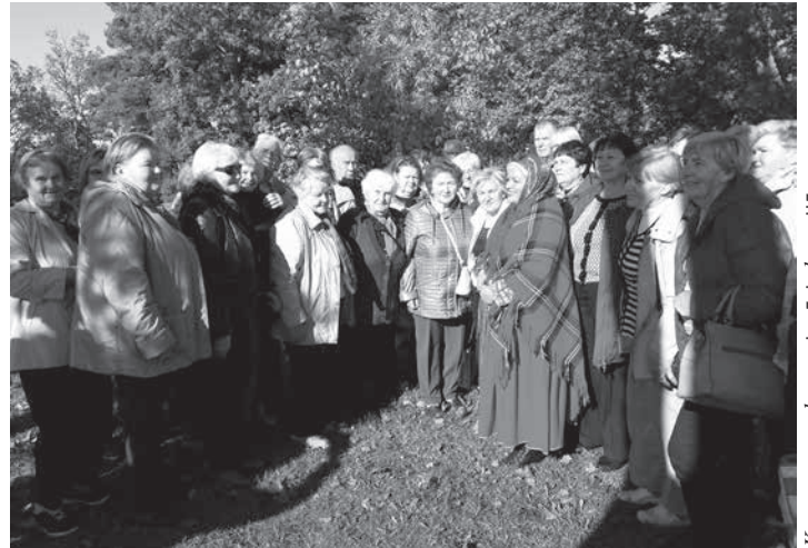
Ķeguma novada pensionāri ekskursijā

Bijām arī suitu amatniecības tirdziņā. Tikāmies ar sklandu raušu cepēju un degustējām pagatavoto.