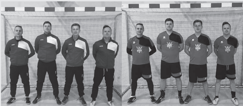
SK „Birzgale” jaunie formastērpi

Formas tērpi tika pasūtīti firmā SIA „SPORTA PUNKTS LATVIJA”.