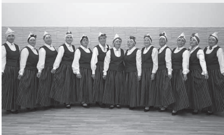
Deju kolektīva „Rasa” jaunie tautas tērpa brunči

Lai veicinātu sieviešu radošo aktivitāti un valsts kultūras tradīciju saglabāšanu, biedrība „Sieviešu klubs Ķeguma saulespuķes”, Iedzīvotāju iniciatīvas veicināšanas projektu konkursa ietvaros īstenojusi projektu „Brunči – košākā tautas tērpa sastāvdaļa”.